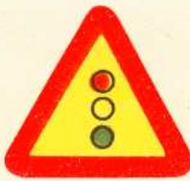
rys. 1 — 29