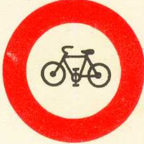
rys. II A - 13