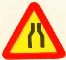
rys. 1 — 12