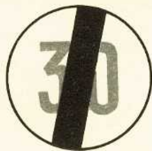
rys. II A — 18a