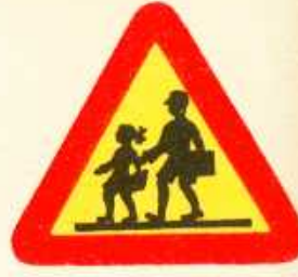
rys. 1 — 17