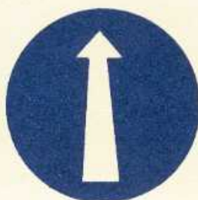
rys. II B — 4