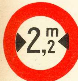
rys. II A - 14