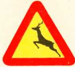
rys. 1 — 18a