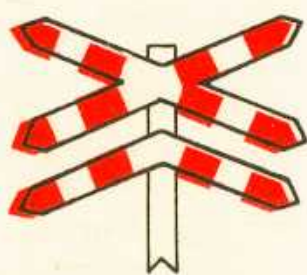
rys. 1 — 9a