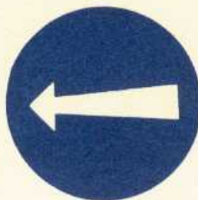
rys. II B — 2