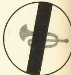
rys. II A — 26a