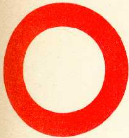
rys. II A - 1