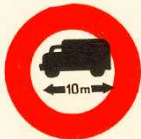
rys. II A — 24