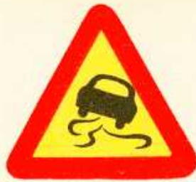
rys. 1 — 15