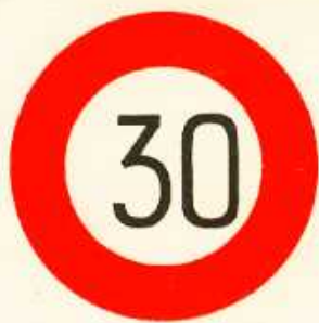
rys. II A — 18