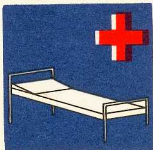
rys. III A — 2