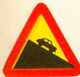
rys. 1 — 11