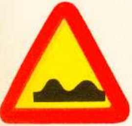
rys. 1 — 1