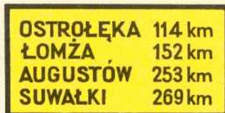
rys. III C — 2