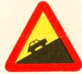
rys. 1 — 23