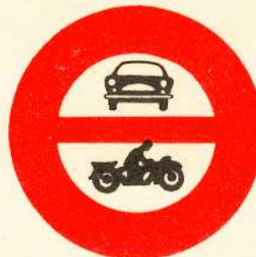
rys. II A - 8