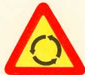
rys. 1 — 26