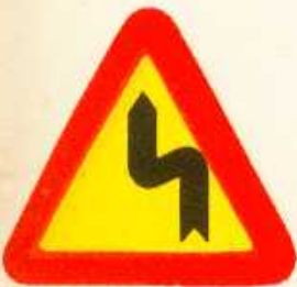
rys. 1 — 5