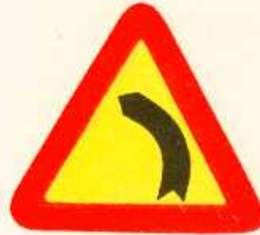
rys. 1 — 3