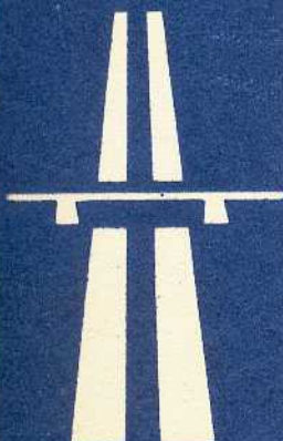
rys. III A — 12