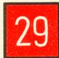
rys. III C — 3