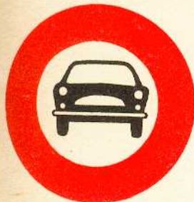
rys. II A - 6