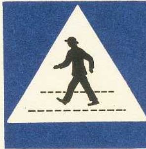
rys. III A — 11