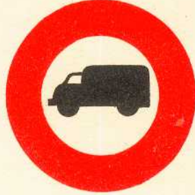
rys. II A - 9