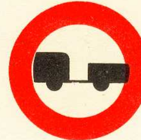
rys. II A - 11