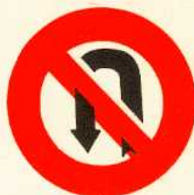
rys. II A — 23