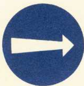
rys. II B — 1