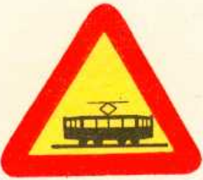
rys. 1 — 21