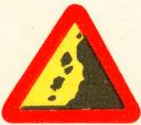
rys. 1 — 25