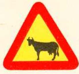
rys. 1 — 18