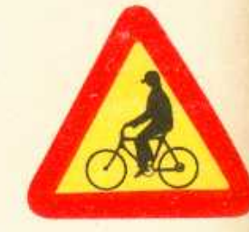
rys. 1 — 24