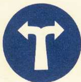
rys. II B — 3