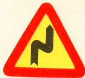
rys. 1 — 4