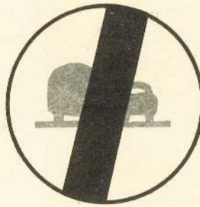
rys. II A - 5a