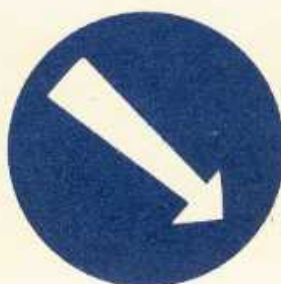
rys. II B — 5