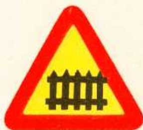
rys. 1 — 7