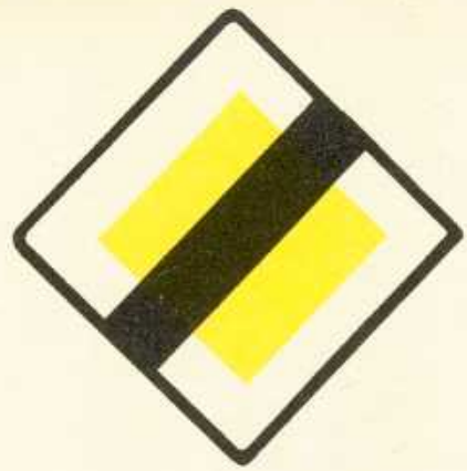
rys. III A — 15