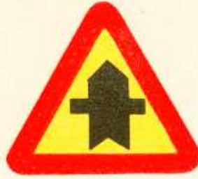
rys. 1 — 19