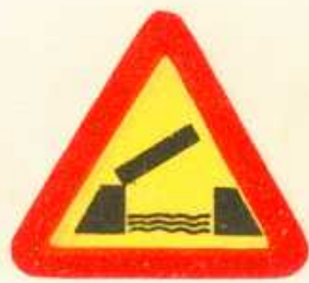
rys. 1 — 13