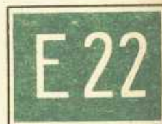
rys. III C — 4