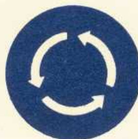
rys. II B — 6