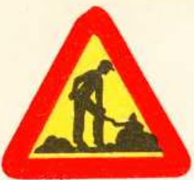
rys. 1 — 14