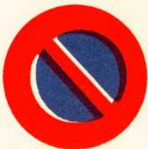
rys. II A — 21