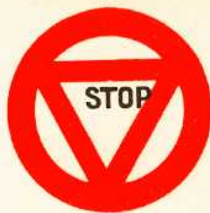
rys. II A — 19