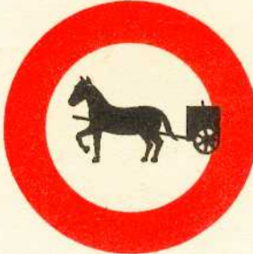
rys. II A - 12