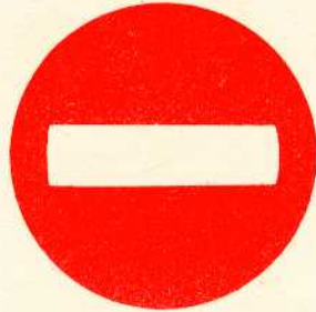
rys. II A - 2