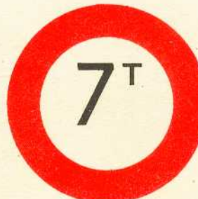
rys. II A - 16