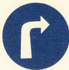
rys. II B — 1a