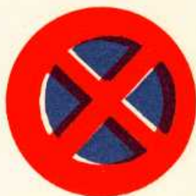
rys. II A — 22