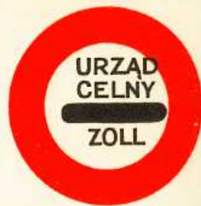
rys. II A — 20