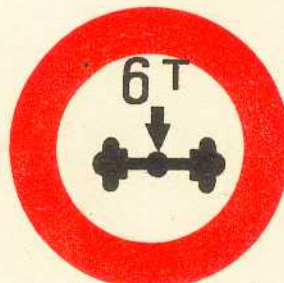
rys. II A - 17