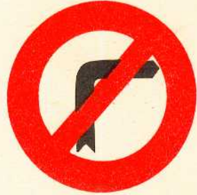
rys. II A - 3a