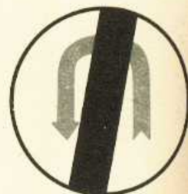
rys. II A — 23a