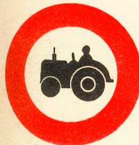
rys. II A - 10