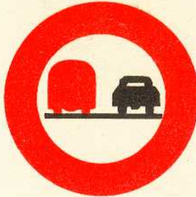
rys. II A - 5