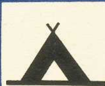
rys. III A — 7