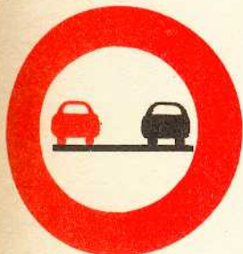
rys. II A - 4