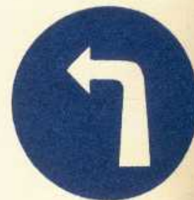
rys. II B — 2a