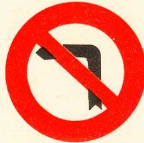
rys. II A - 3