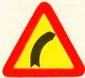
rys. 1 — 2