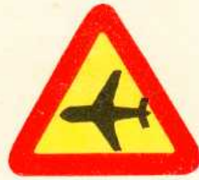
rys. 1 — 22