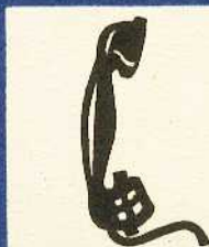
rys. III A — 5