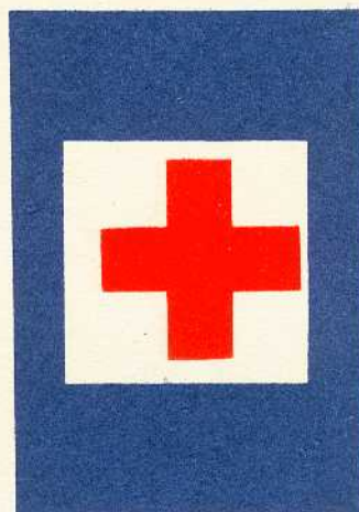
rys. III A — 3