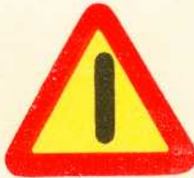
rys. 1 — 30