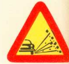
rys. 1 — 28