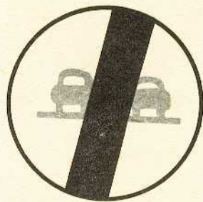
rys. II A - 4a