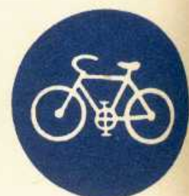
rys. II B — 7