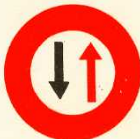
rys. II A — 25