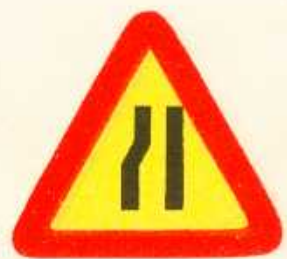
rys. 1 — 12a