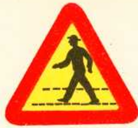
rys. 1 — 16