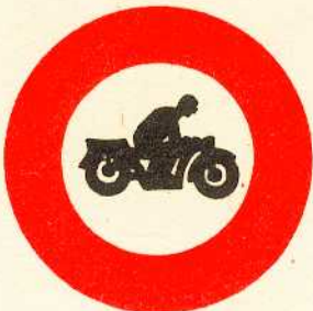
rys. II A - 7