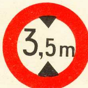
rys. II A - 15