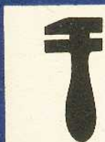
rys. III A — 4