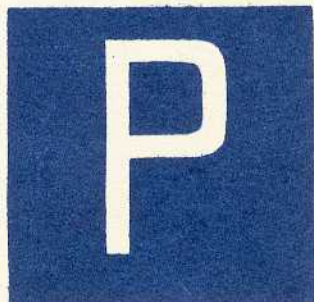
rys. III A — 1