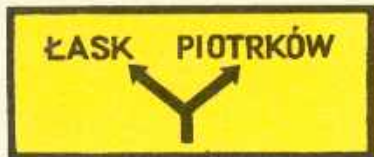
rys. III B — 1