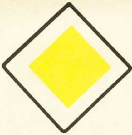
rys. III A — 14