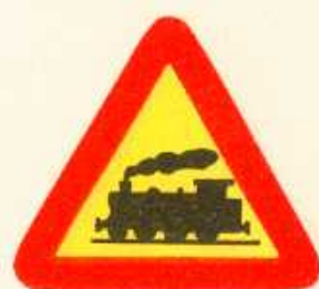
rys. 1 — 8