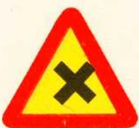
rys. 1 — 6