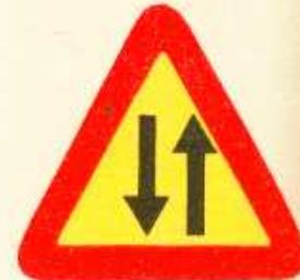
rys. 1 — 20