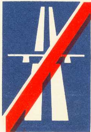
rys. III A — 13