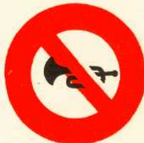
rys. II A — 26