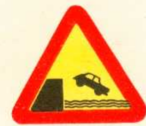
rys. 1 — 27