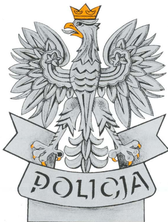
GŁOWICA SZTANDARU — STRONA GŁÓWNA