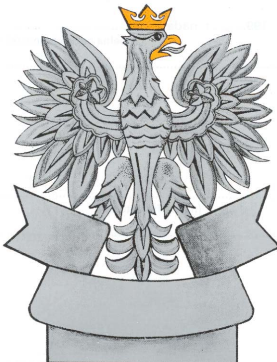
GŁOWICA SZTANDARU — STRONA ODWROTNA