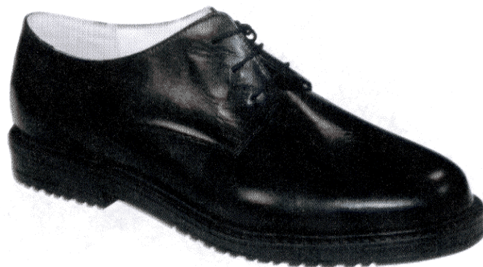
Półbuty koloru czarnego