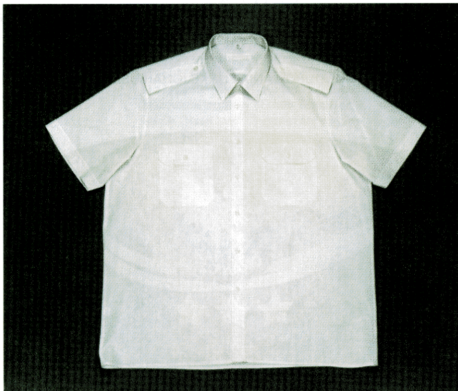
Koszula koloru białego z krótkimi rękawami