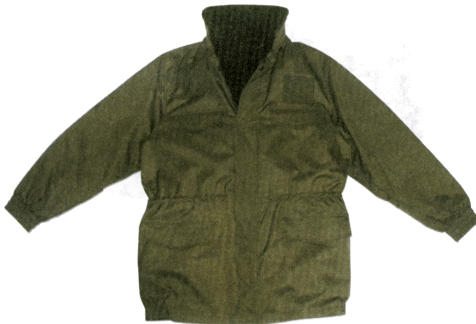
Kurtka służbowa Straży Granicznej koloru khaki z podpinką