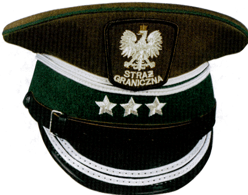
Czapka garnizonowa Straży Granicznej koloru khaki