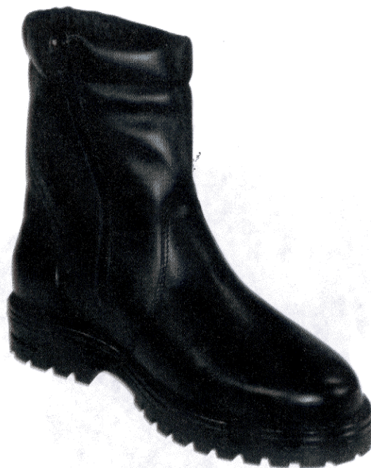
Botki zimowe koloru czarnego