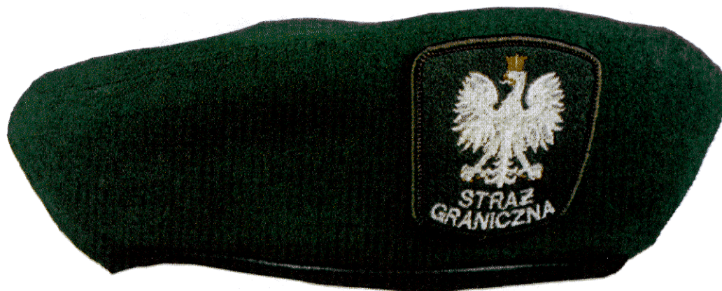
Beret Straży Granicznej koloru zielonego