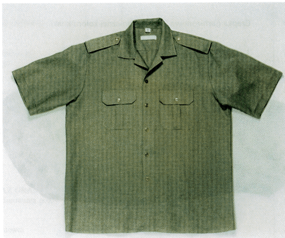
Koszula koloru khaki z krótkimi rękawami i wykładanym kołnierzem