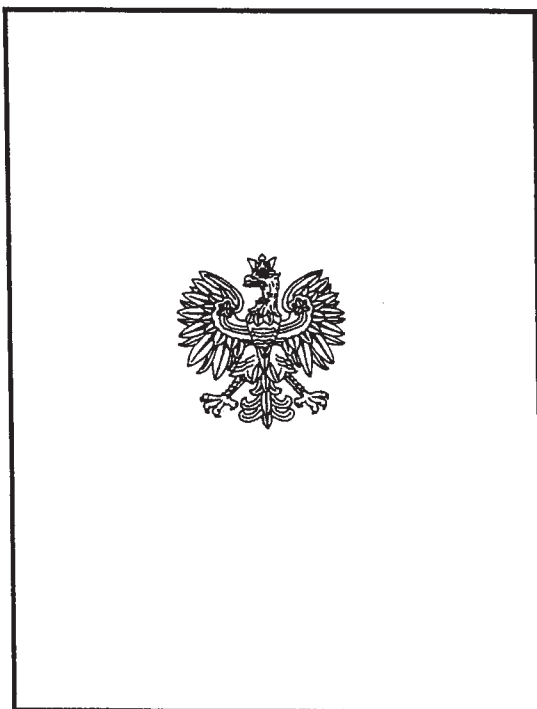
Zewnętrzna strona legitymacji