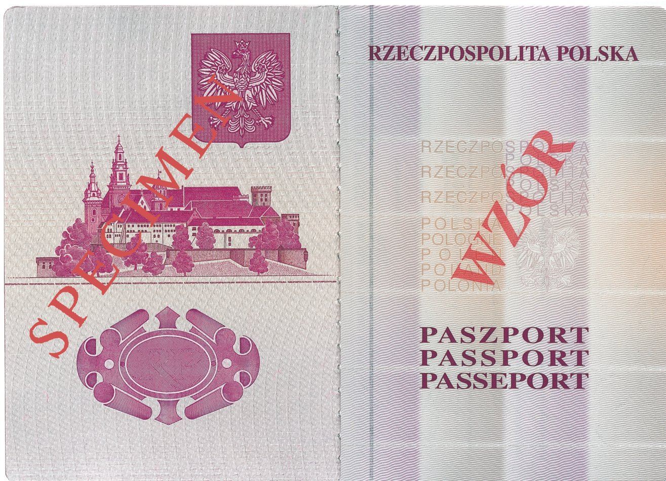
Strona 2 okładki (wewnętrzna)