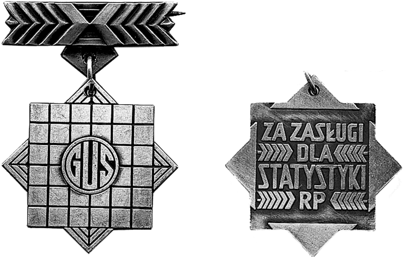
Wzór w powiększeniu