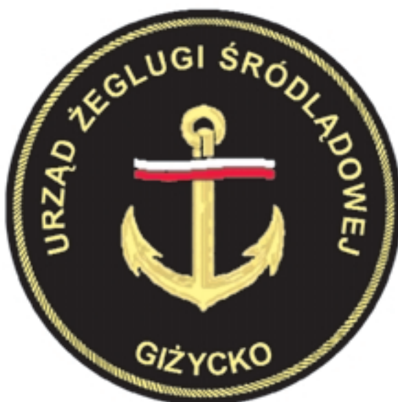
Wzór nr 10 — Emblemat na rękaw