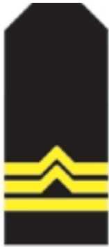
b) starszy inspektor