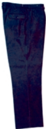
Wzór nr 3 — Spodnie