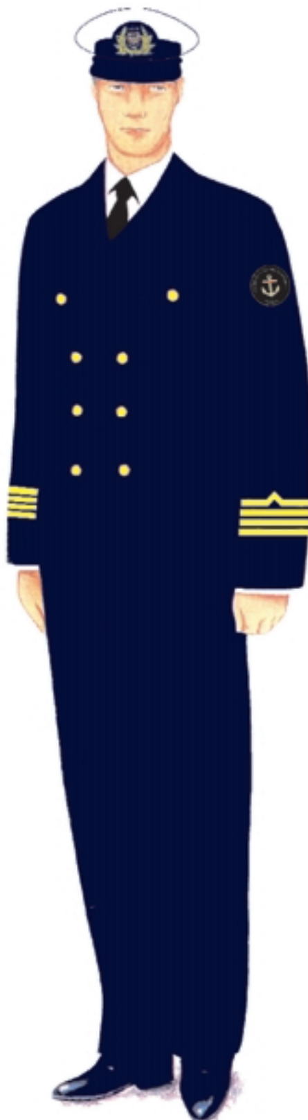
a) umundurowanie wyjściowe