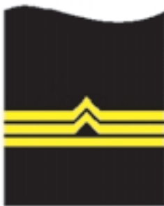
b) starszy inspektor