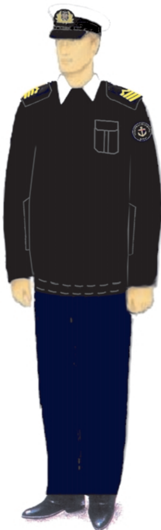
c) umundurowanie letnie ze swetrem