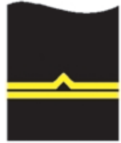
d) młodszy inspektor