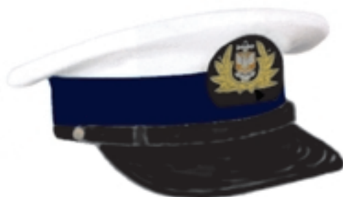
Wzór nr 1a — Czapka typu marynarskiego