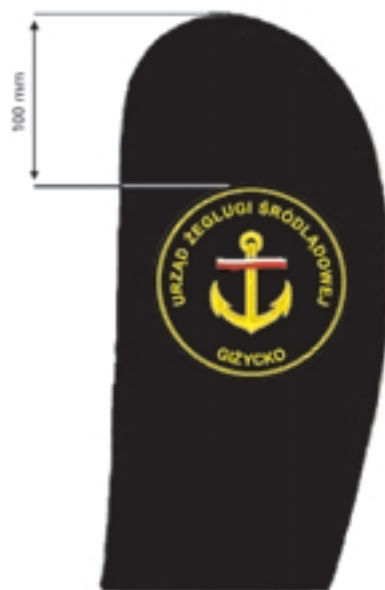
Wzór nr 10a — Sposób umieszczania emblematu na rękawie