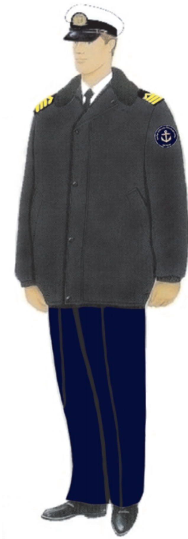
e) umundurowanie z kurtką