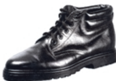
Wzór nr 7 — Botki ocieplane