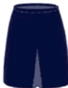
Wzór nr 3a — Spódnica