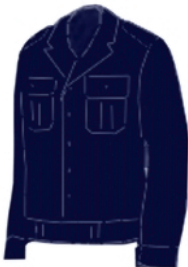
Wzór nr 6 — Bluza olimpijka