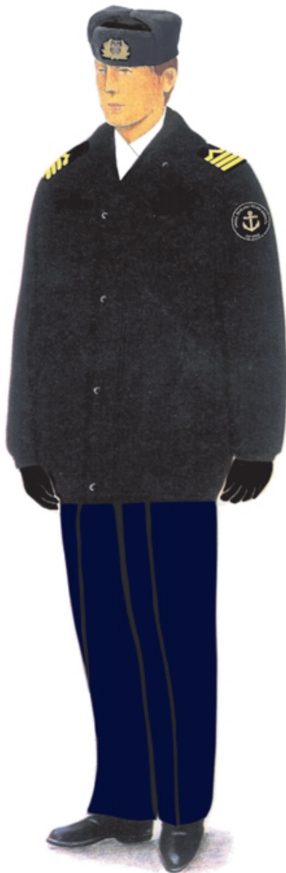
f) umundurowanie zimowe