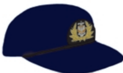
Wzór nr 1b — Czapka typu sportowego