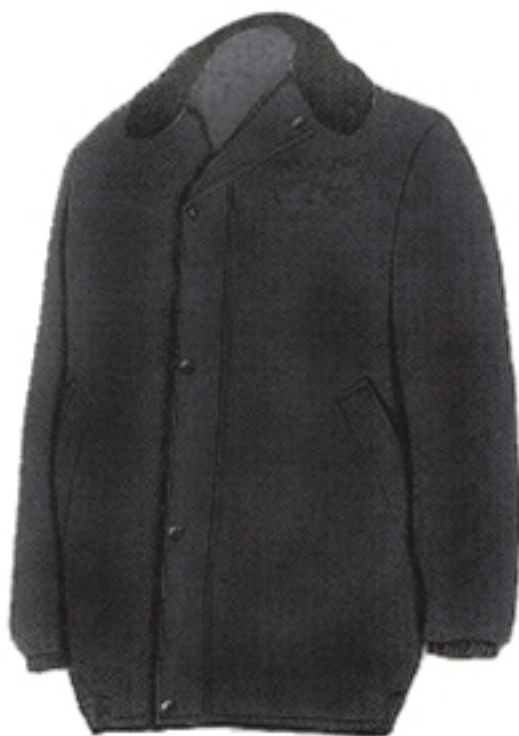
Wzór nr 5 — Kurtka