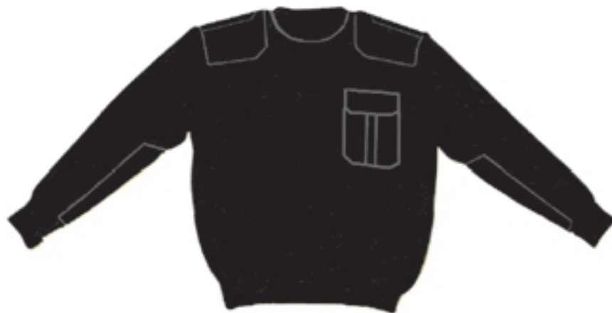
Wzór nr 4 — Sweter