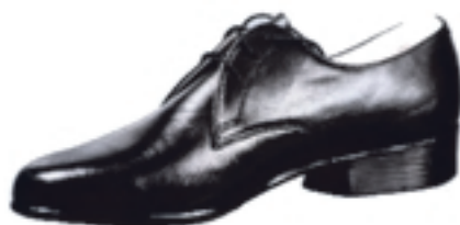
Wzór nr 8 — Półbuty