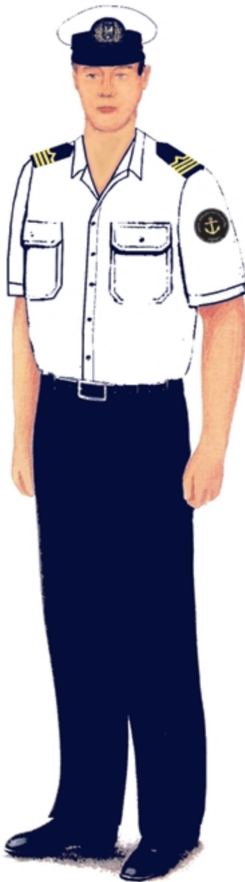
b) umundurowanie letnie z koszulą z krótkim rękawem