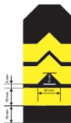
Wzór nr 11b — Sposób umieszczania dystynkcji na naramiennikach