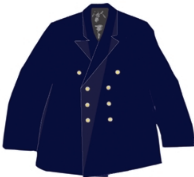
Wzór nr 2 — Marynarka mundurowa