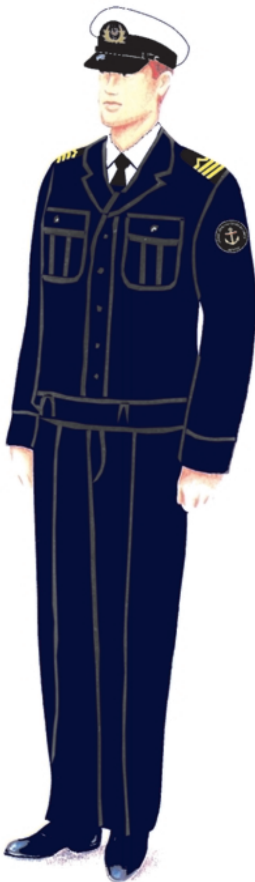
d) umundurowanie letnie z bluzą olimpijką