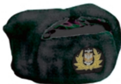
Wzór nr 1c — Czapka futrzana