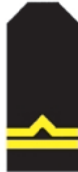
d) młodszy inspektor