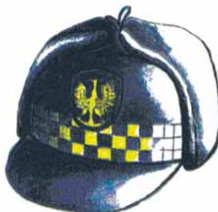
Rys. 6. Uszanka z daszkiem