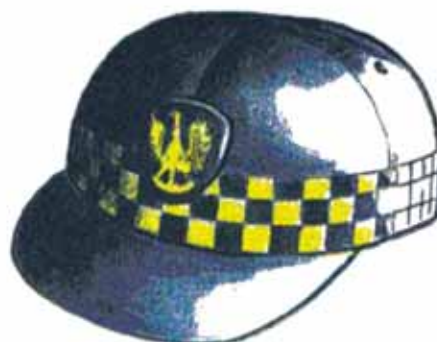
Rys. 5. Czapka typu sportowego