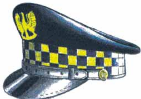
Rys. 1. Czapka służbowa okrągła dla inspektora, specjalisty, strażnika i aplikanta