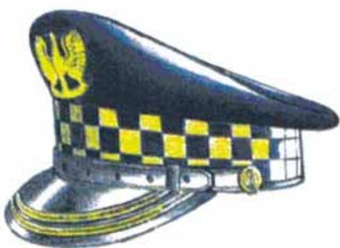
Rys. 3. Czapka służbowa z dwoma galonami dla komendanta i zastępcy komendanta