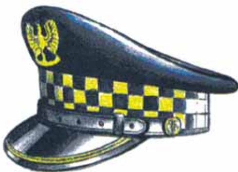
Rys. 2. Czapka służbowa okrągła z jednym galonem dla naczelnika, zastępcy naczelnika, kierownika i zastępcy kierownika