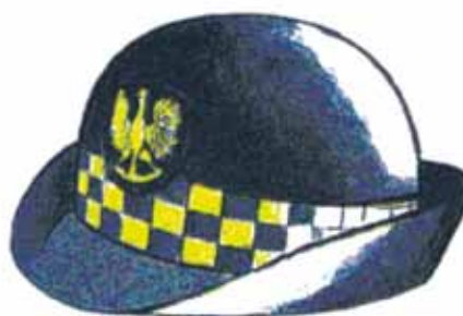
Rys. 4. Kapelusz damski