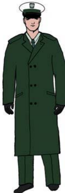
Ubiór Głównego Inspektora Transportu Drogowego (jego zastępcy) oraz wojewódzkiego inspektora transportu drogowego (jego zastępcy) w płaszczu.