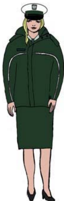
Ubiór uprawnionego w kurtce \frac{3}{4} — kobiety. 1)