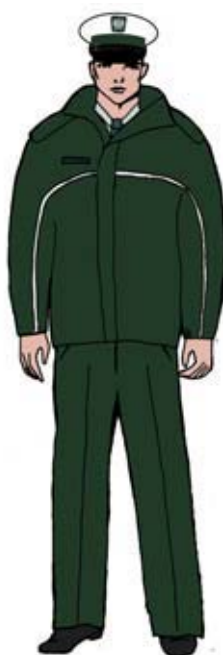
Ubiór uprawnionego w kurtce \frac{3}{4} — mężczyzny.