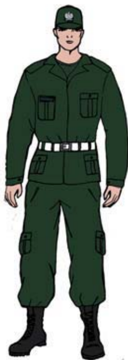
Ubiór uprawnionego w bluzie polowej.