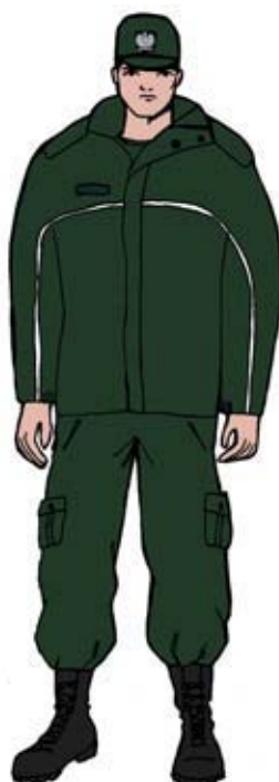
Ubiór uprawnionego w kurtce \frac{3}{4} .