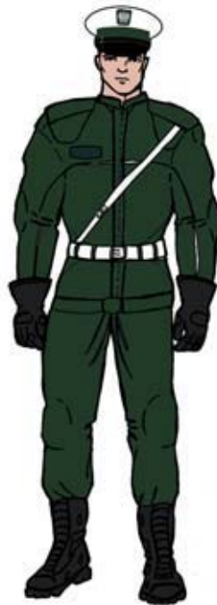
Ubiór uprawnionego — motocyklisty. 4)