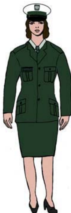
Ubiór uprawnionego w marynarce gabardynowej — kobiety. 2)