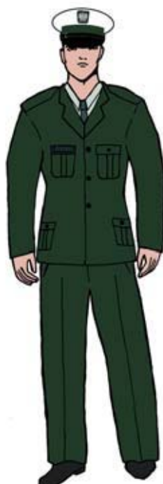
Ubiór uprawnionego w marynarce gabardynowej — mężczyzny.