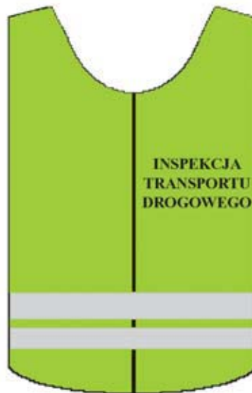
Kamizelka ostrzegawcza — przód.