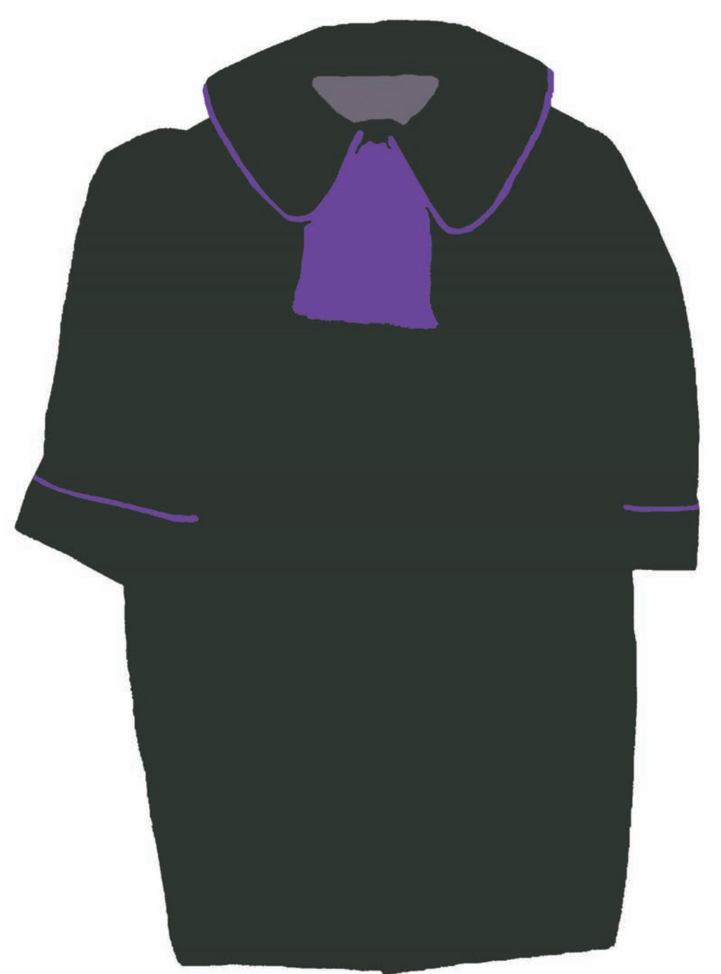
widok z przodu