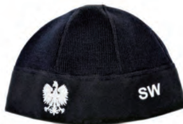
czapka polowa zimowa