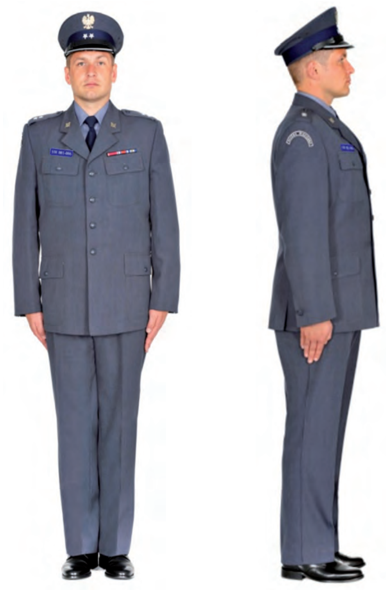
Ubiór funkcjonariusza mężczyzny w mundurze służbowym, półbutach służbowych i w czapce służbowej