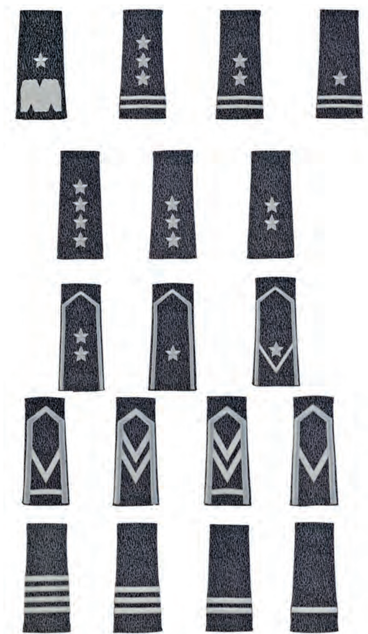
Dystynkcje wykonane na wsuwkach, noszone na składnikach wyposażenia polowego