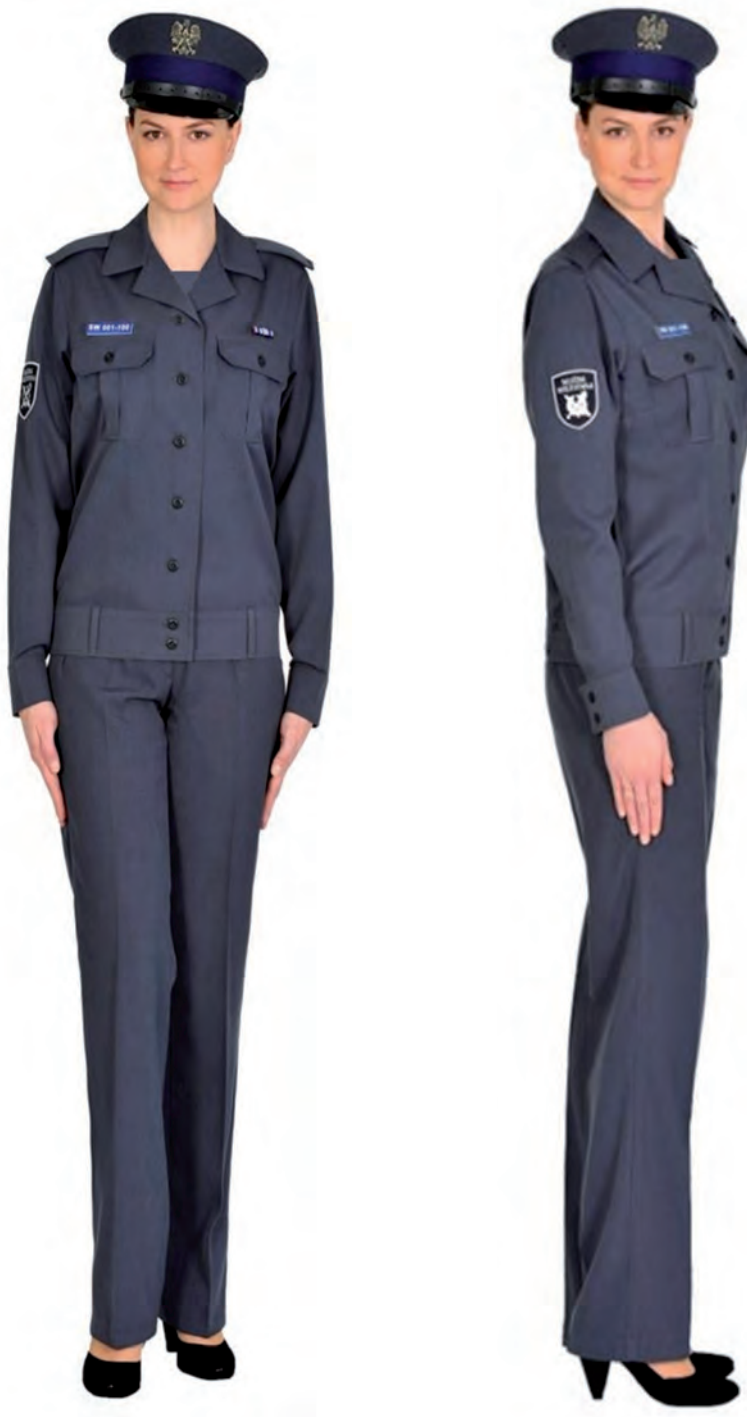
Ubiór funkcjonariusza kobiety w wiatrówce letniej, spodniach letnich i w czapce służbowej