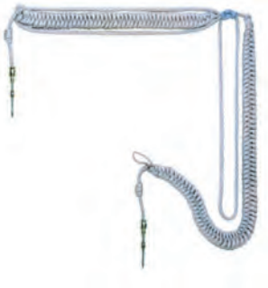
sznur galowy generała