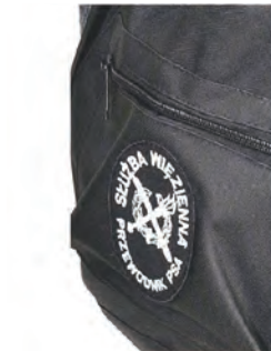
znak identyfikacyjny przewodnika psa