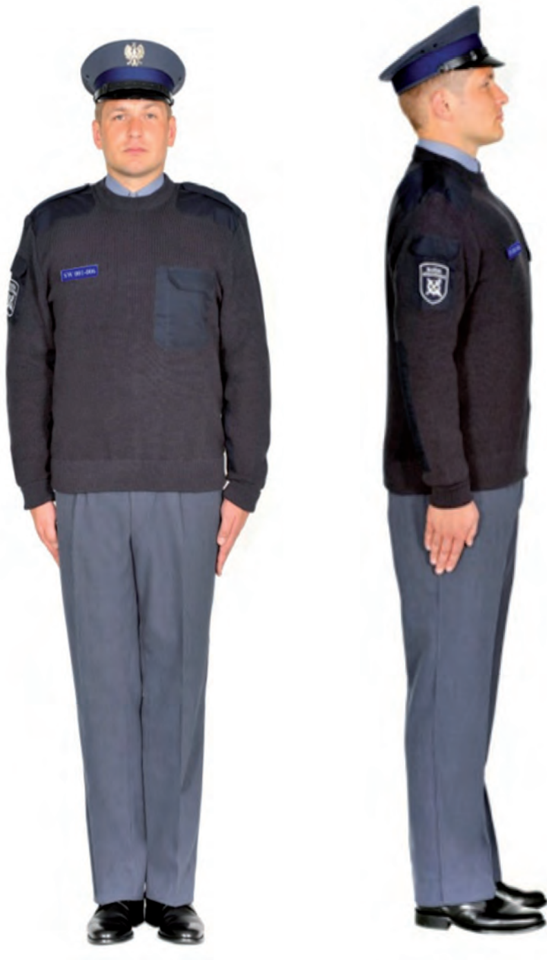
Ubiór funkcjonariusza w swetrze, półbutach służbowych i w czapce służbowej