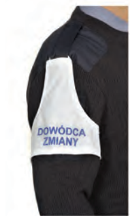
znak funkcyjny w formie opaski