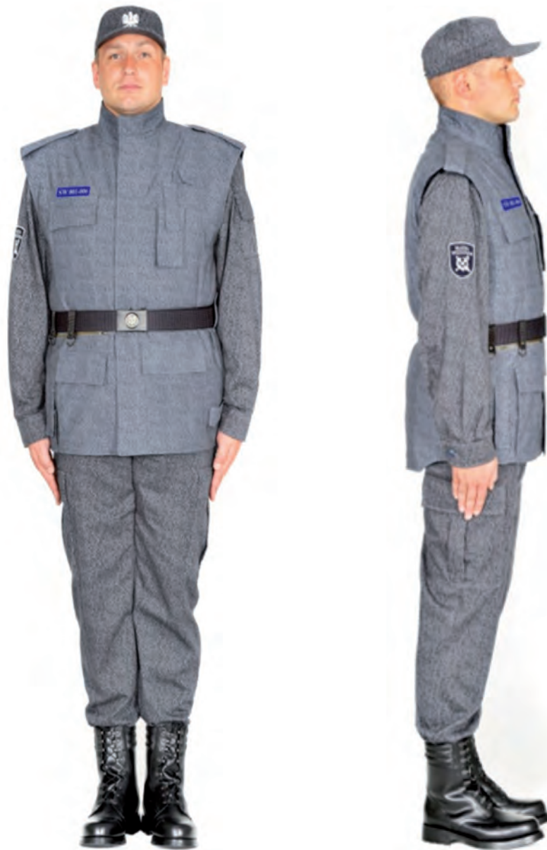
Ubiór funkcjonariusza w ocieplaczu polowym, trzewikach polowych i w czapce polowej