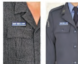
sposób noszenia znaku numerycznego