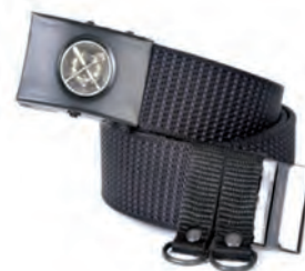
pas parciany polowy