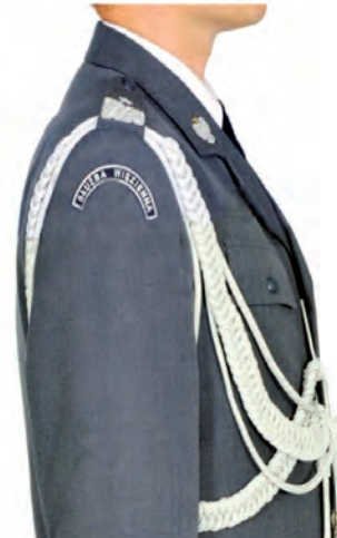
umiejscowienie oznak służby w kształcie półkolistym na rękawie kurtki mundurowej