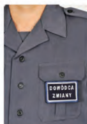
sposób noszenia znaku funkcyjnego w formie plakietki