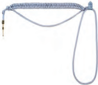
sznur galowy oficera