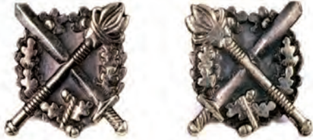
oznaka służby w kształcie koła (prawa i lewa)