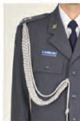
sposób noszenia znaku imiennego