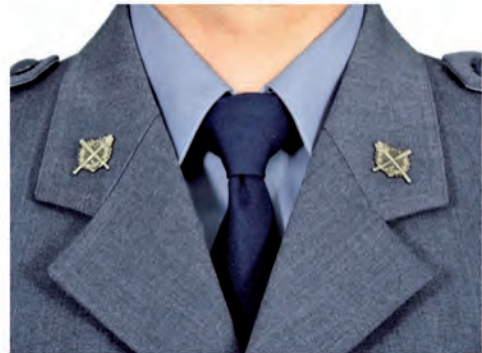
umiejscowienie oznak służby w kształcie koła na klapach munduru