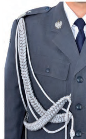
system mocowania sznura galowego generała do munduru wyjściowego