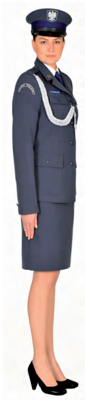
Ubiór funkcjonariusza kobiety w mundurze wyjściowym ze sznurem galowym, półbutach wyjściowych i w czapce wyjściowej