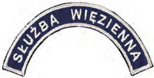
oznaka służby w kształcie półkolistym