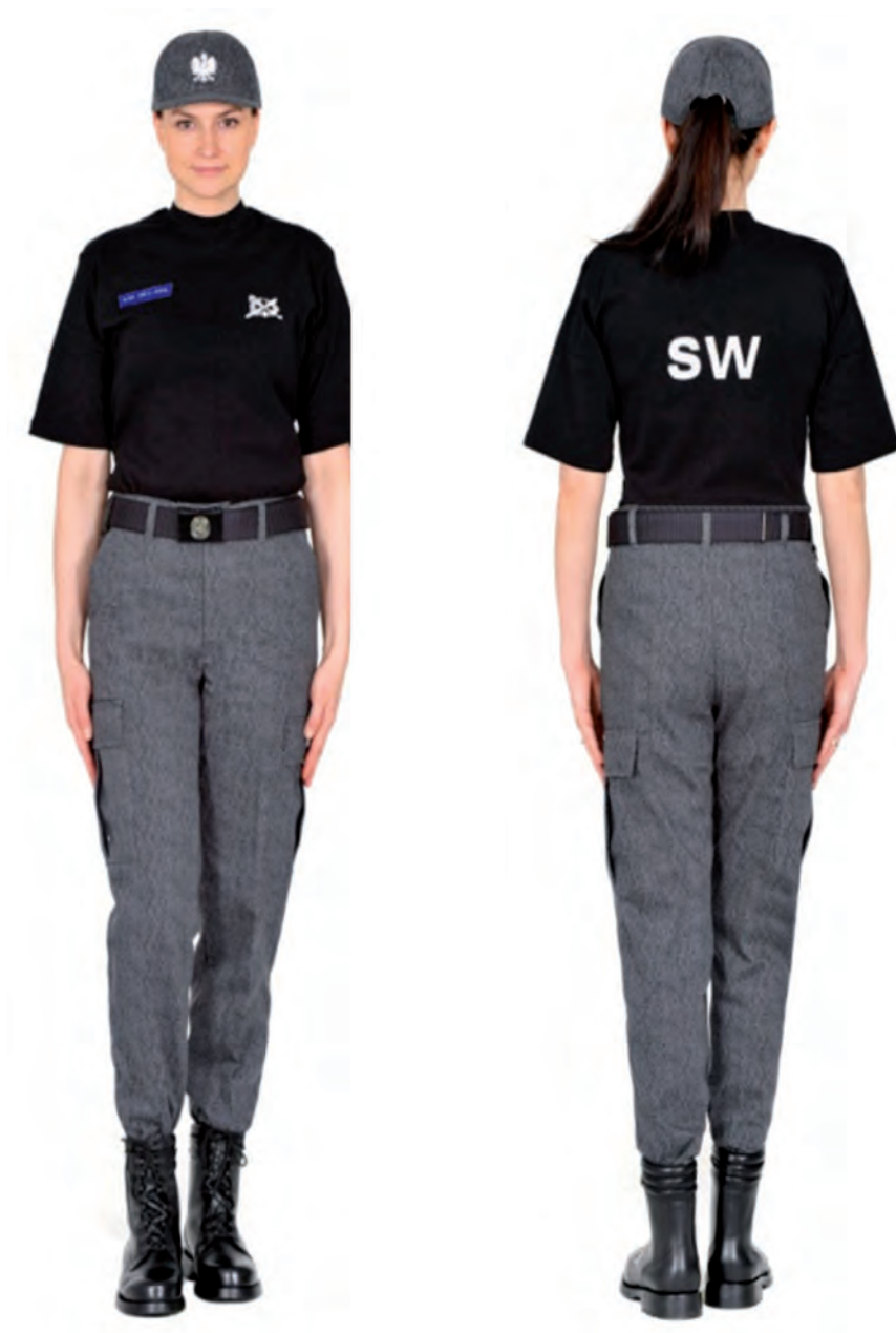
Ubiór funkcjonariusza w podkoszulku, trzewikach polowych i w czapce polowej