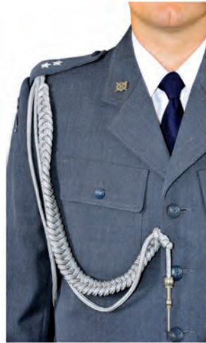
system mocowania sznura galowego oficera do munduru wyjściowego