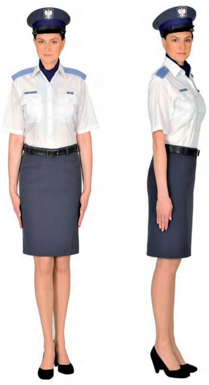
Ubiór funkcjonariusza kobiety w koszuli wyjściowej letniej, apaszcze, spódnicy letniej, półbutach wyjściowych i w czapce wyjściowej