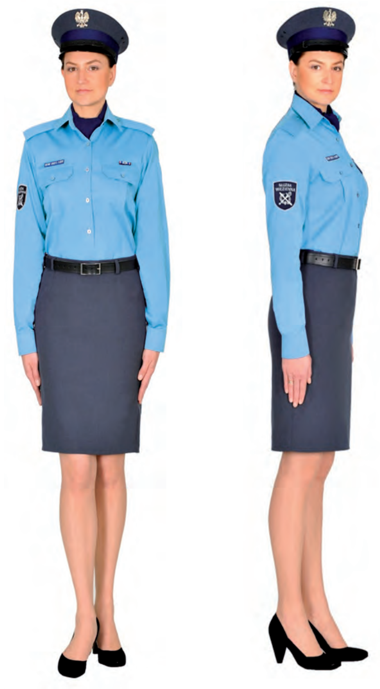
Ubiór funkcjonariusza kobiety w koszuli służbowej, spódnicy letniej i w czapce służbowej