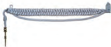
sznur galowy chorążego