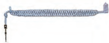
sznur galowy podoficera i szeregowego