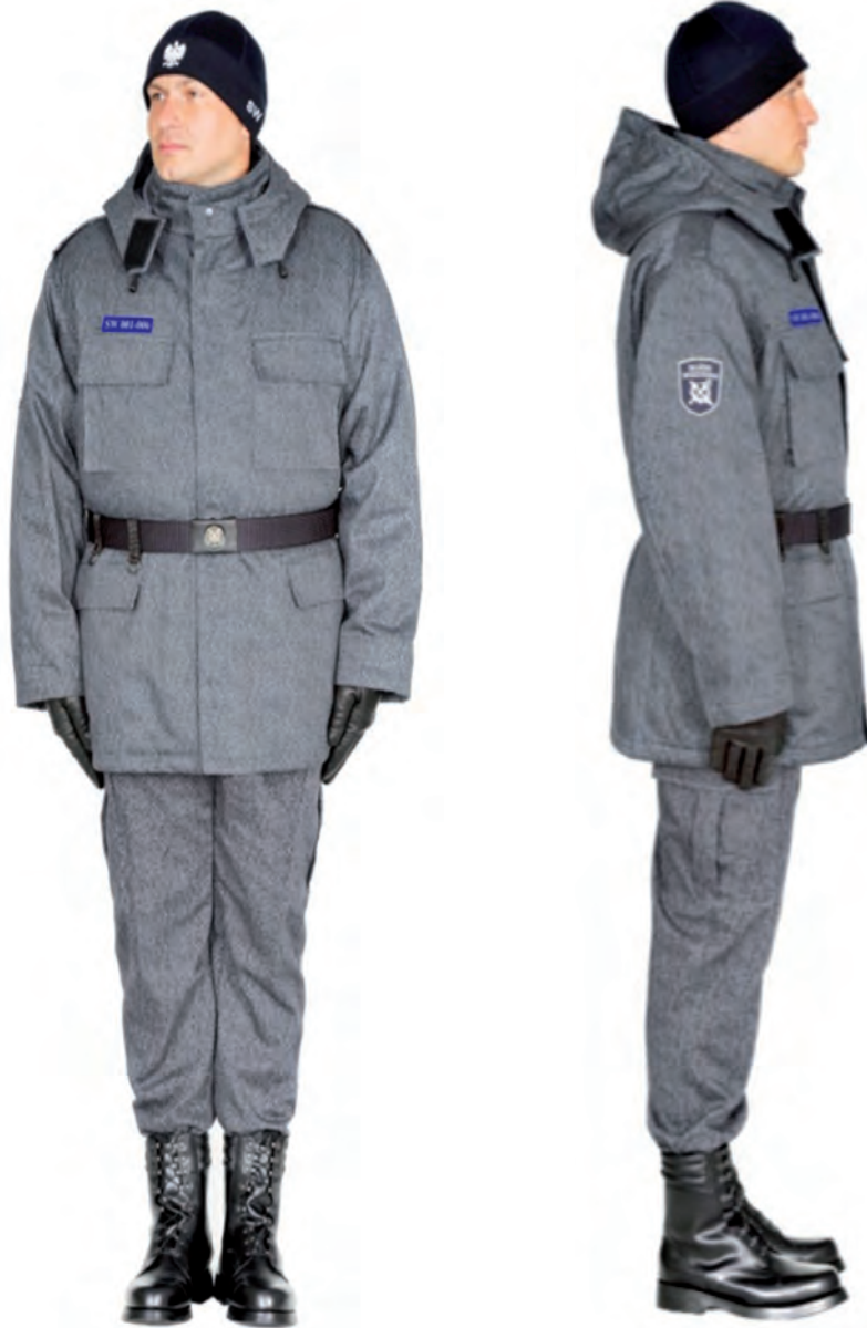
Ubiór funkcjonariusza w kurtce polowej, trzewikach polowych i w czapce polowej ocieplanej