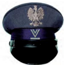
starszy sierżant sztabowy