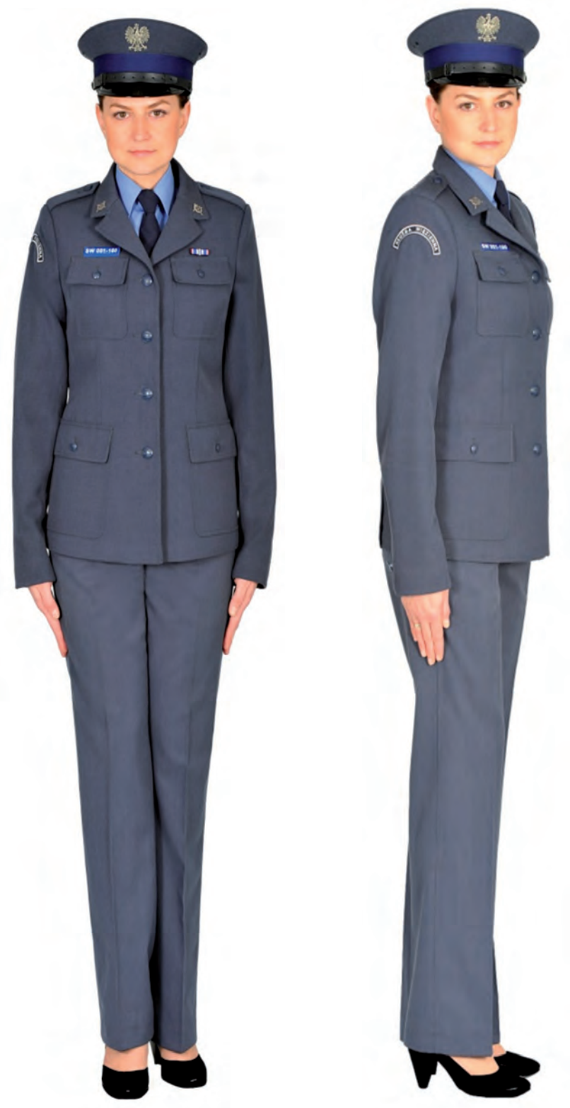
Ubiór funkcjonariusza kobiety w mundurze służbowym, półbutach służbowych i w czapce służbowej