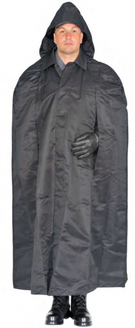
Ubiór funkcjonariusza w pelerynie