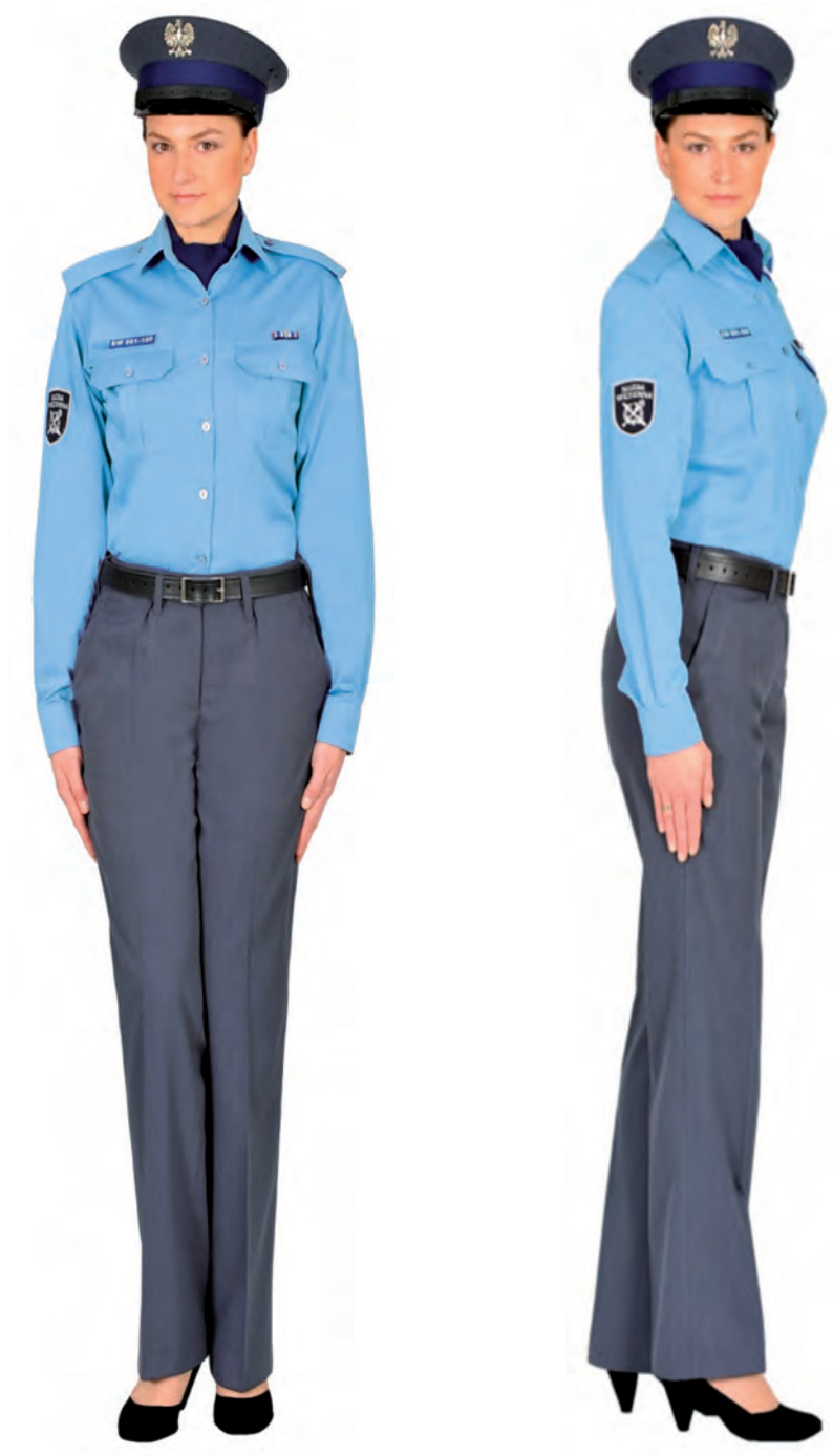
Ubiór funkcjonariusza kobiety w koszuli służbowej, apaszcze, spodniach, półbutach służbowych i w czapce służbowej