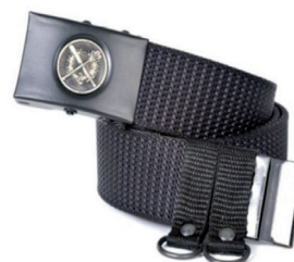
pas parciany polowy