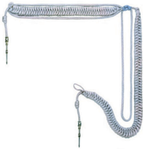
sznur galowy generała