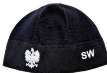
czapka polowa zimowa