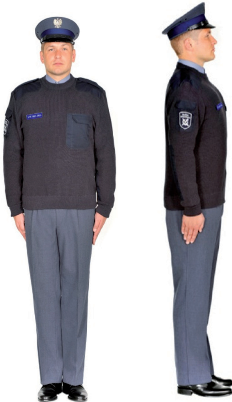
Ubiór funkcjonariusza w swetrze, półbutach służbowych i w czapce służbowej