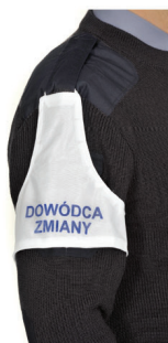
znak funkcyjny w formie opaski