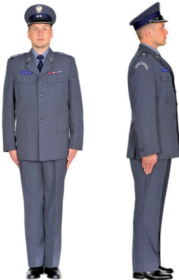
Ubiór funkcjonariusza mężczyzny w mundurze służbowym, półbutach służbowych i w czapce służbowej