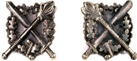
oznaka służby w kształcie koła (prawa i lewa)