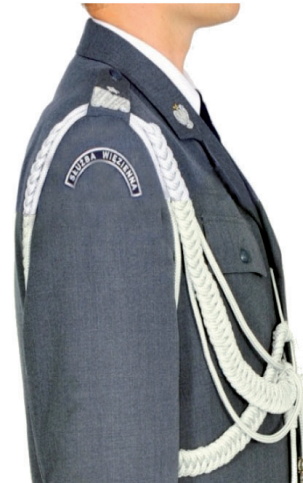
umiejscowienie oznak służby w kształcie półkolistym na rękawie kurtki mundurowej