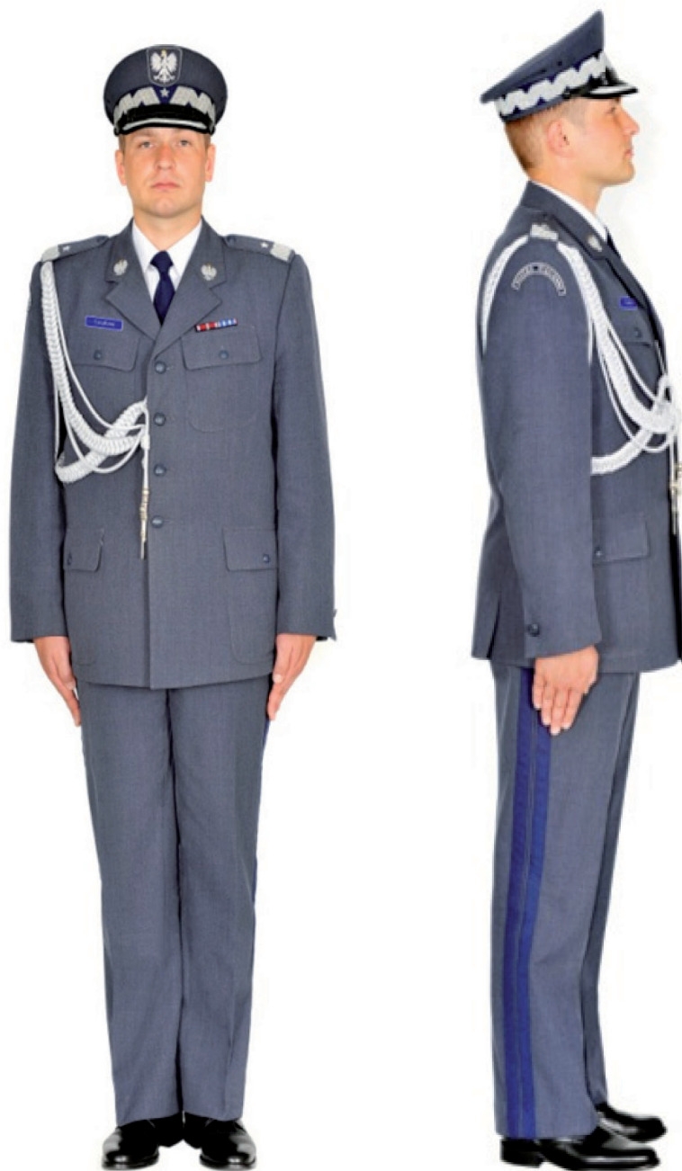
Ubiór generała w mundurze wyjściowym ze sznurem galowym, półbutach wyjściowych i w czapce wyjściowej