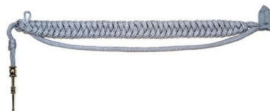
sznur galowy chorążego