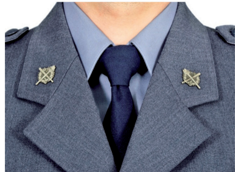
umiejscowienie oznak służby w kształcie koła na klapach munduru