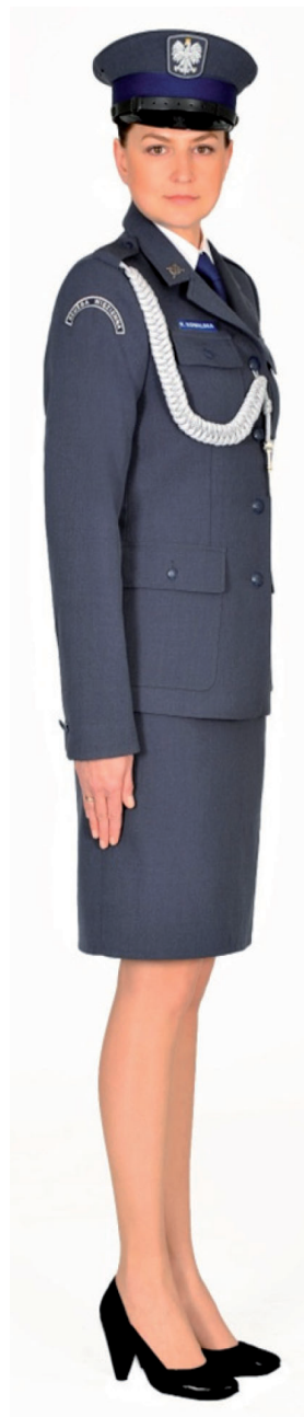
Ubiór funkcjonariusza kobiety w mundurze wyjściowym ze sznurem galowym, półbutach wyjściowych i w czapce wyjściowej