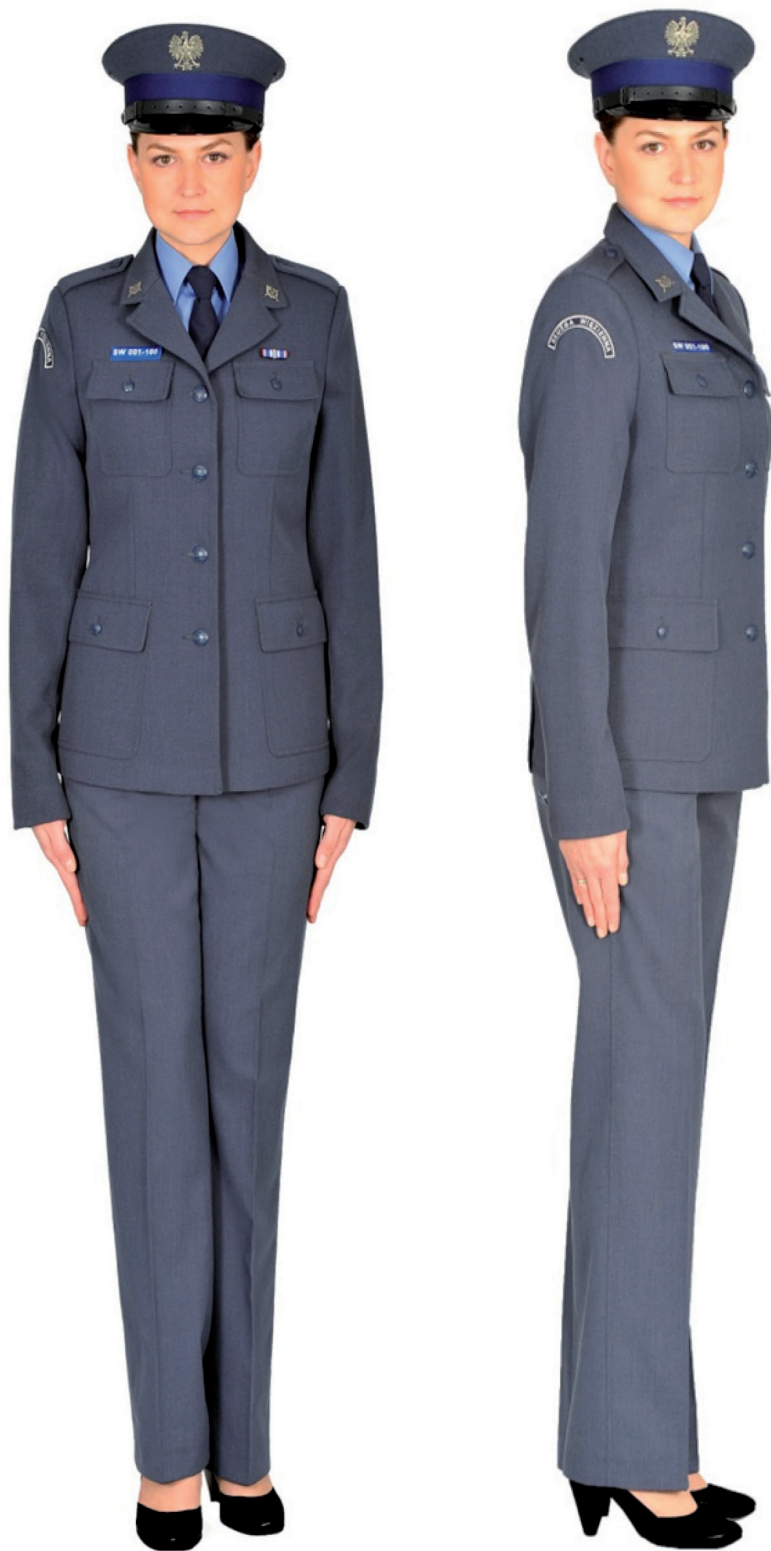
Ubiór funkcjonariusza kobiety w mundurze służbowym, półbutach służbowych i w czapce służbowej