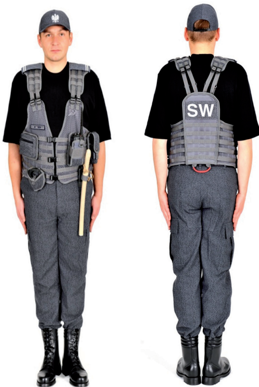
Ubiór funkcjonariusza w podkoszulku, kamizelce taktycznej, trzewikach polowych i w czapce polowej