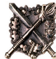
oznaka służby w kształcie koła, występująca pojedynczo