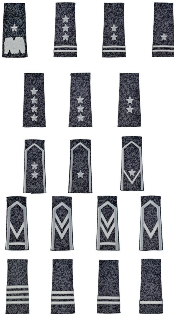
Dystynkcje wykonane na wsuwkach, noszone na składnikach wyposażenia polowego