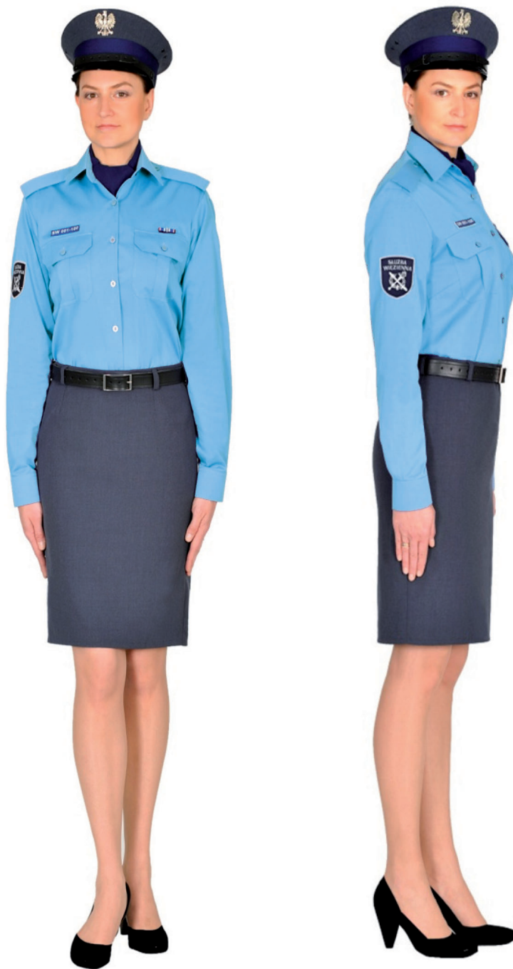
Ubiór funkcjonariusza kobiety w koszuli służbowej, spódnicy letniej i w czapce służbowej