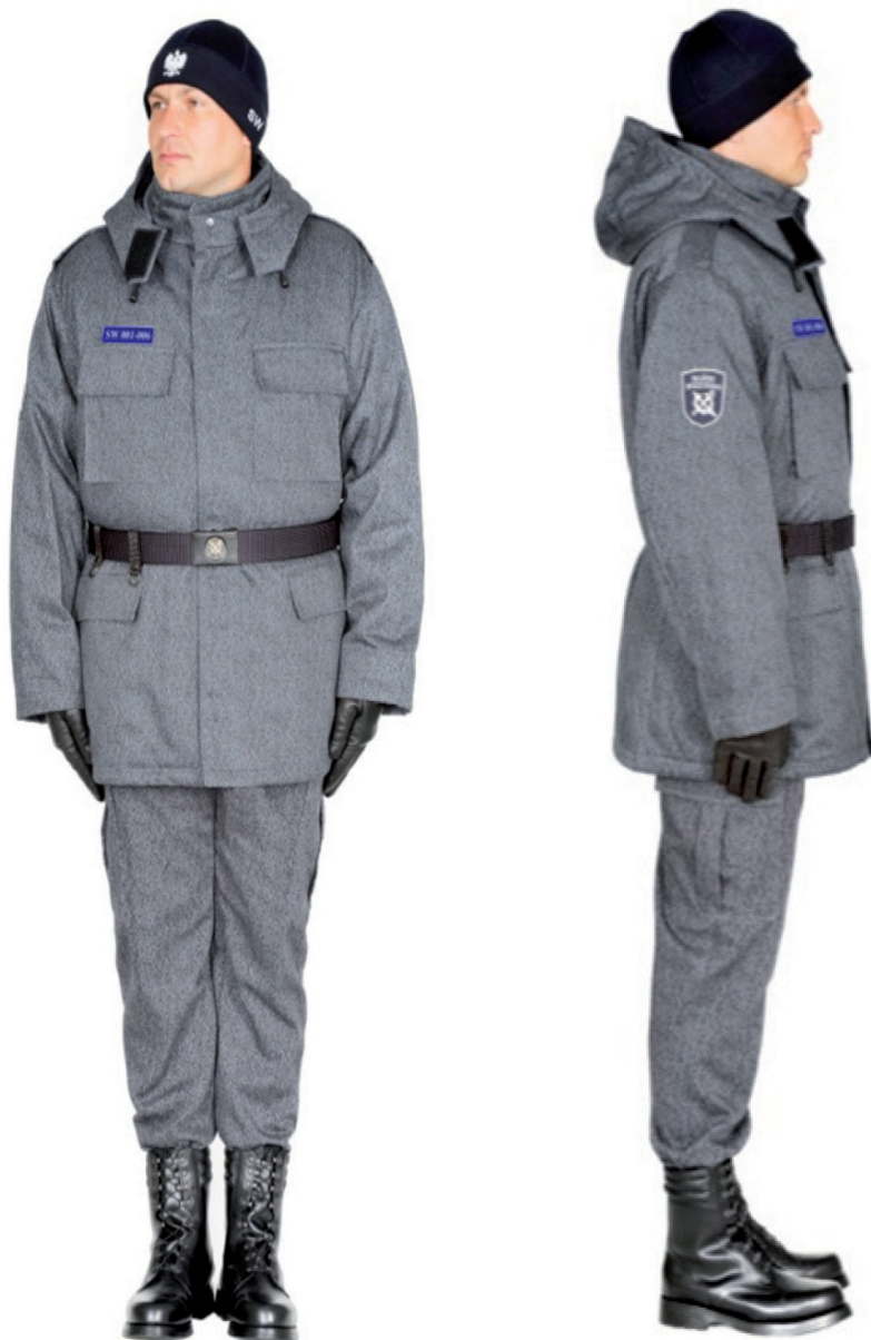
Ubiór funkcjonariusza w kurtce polowej, trzewikach polowych i w czapce polowej ocieplanej