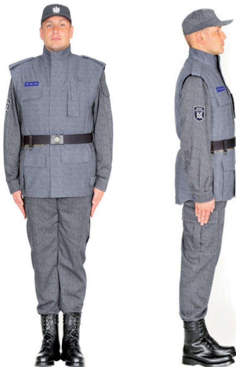
Ubiór funkcjonariusza w ocieplaczu polowym, trzewikach polowych i w czapce polowej