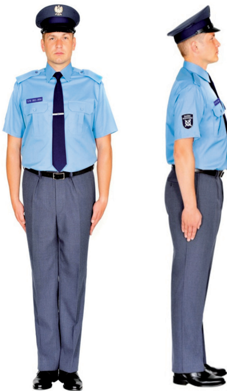
Ubiór funkcjonariusza mężczyzny w koszuli służbowej letniej, spodniach letnich i w czapce służbowej