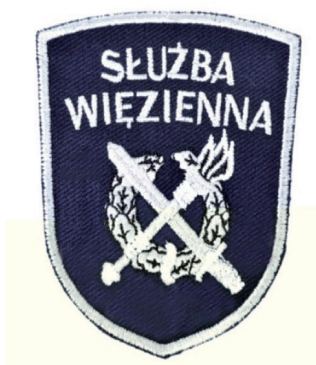
oznaka służby w kształcie tarczy