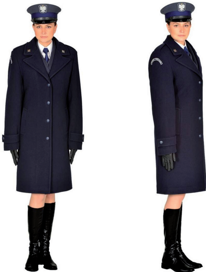
Ubiór funkcjonariusza kobiety w płaszczu wyjściowym zimowym, oficerkach damskich i w czapce wyjściowej