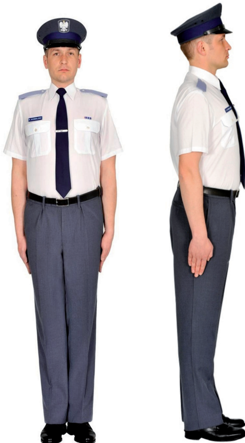
Ubiór funkcjonariusza mężczyzny w koszuli wyjściowej letniej, krawacie, spodniach letnich, półbutach wyjściowych i w czapce wyjściowej