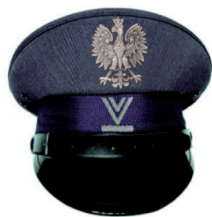
starszy sierżant sztabowy