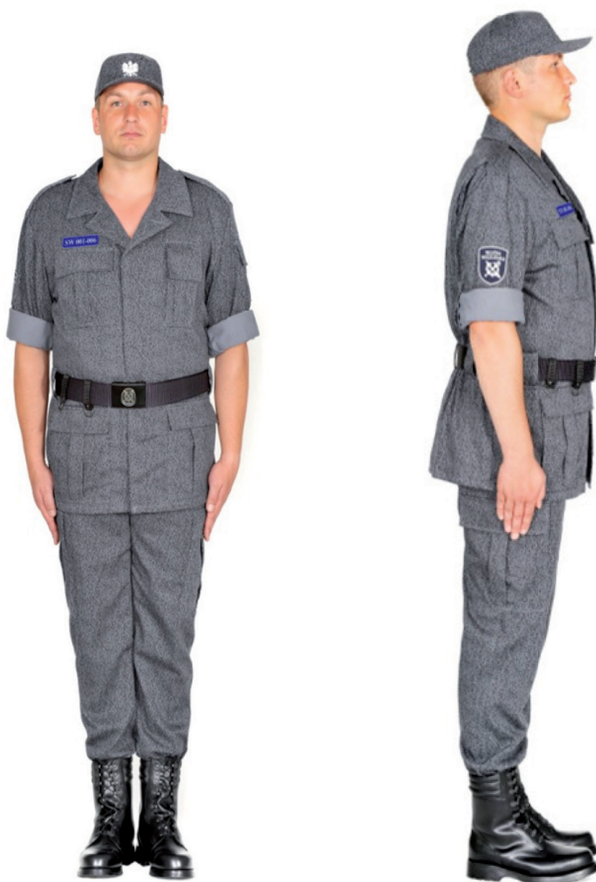
Ubiór funkcjonariusza w kurtce munduru polowego z podwiniętymi rękawami, trzewikach polowych i w czapce polowej