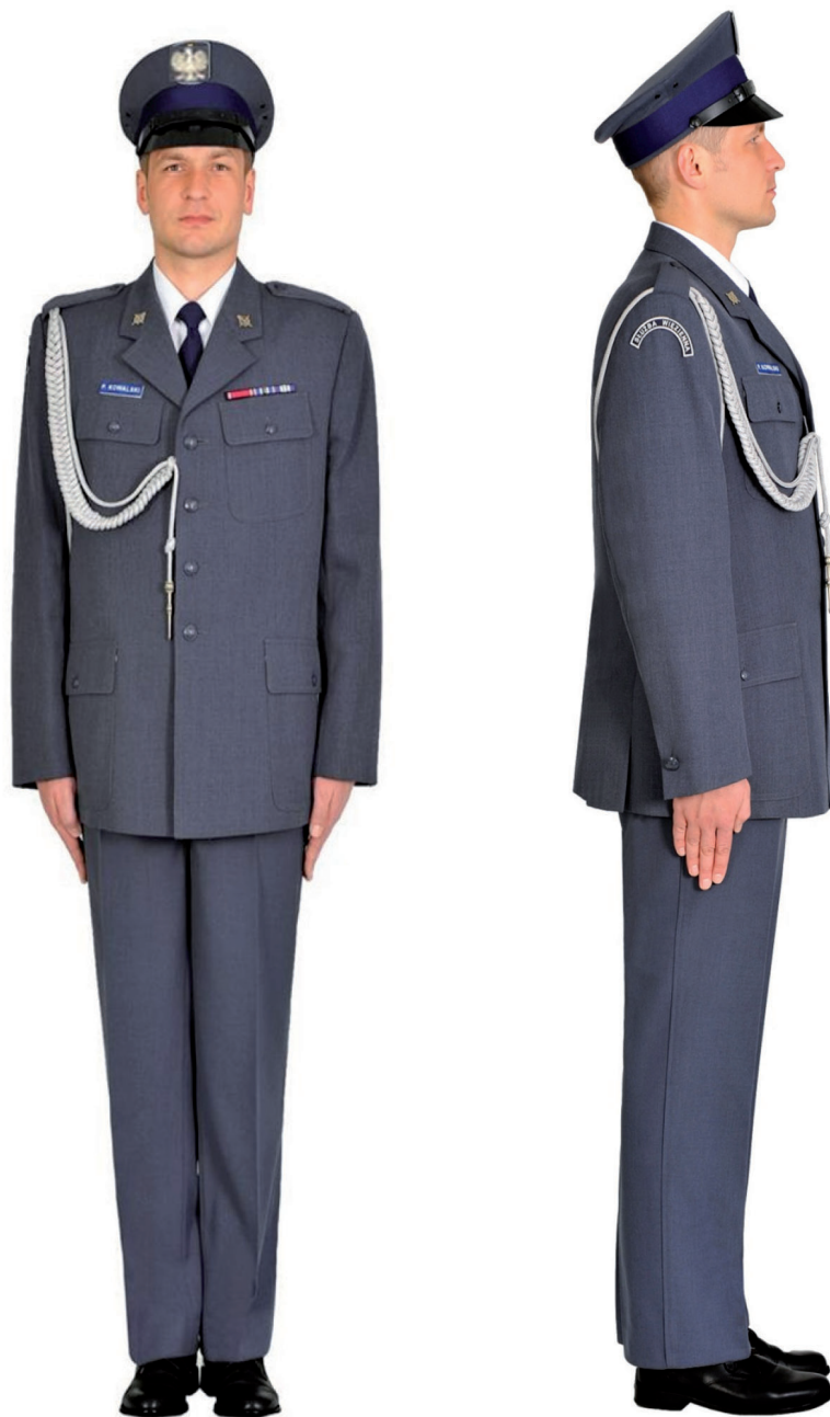
Ubiór funkcjonariusza mężczyzny w mundurze wyjściowym ze sznurem galowym, półbutach wyjściowych i w czapce wyjściowej