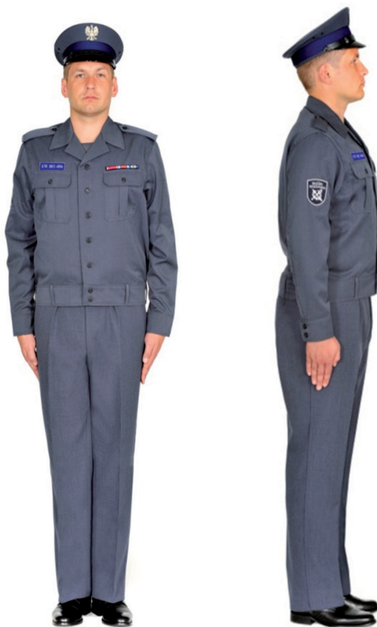
Ubiór funkcjonariusza mężczyzny w wiatrówce letniej, spodniach letnich i w czapce służbowej