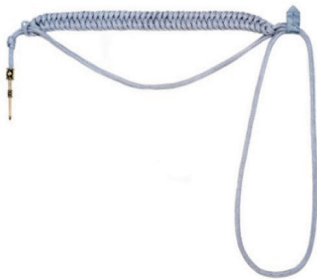
sznur galowy oficera