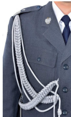
system mocowania sznura galowego generała do munduru wyjściowego