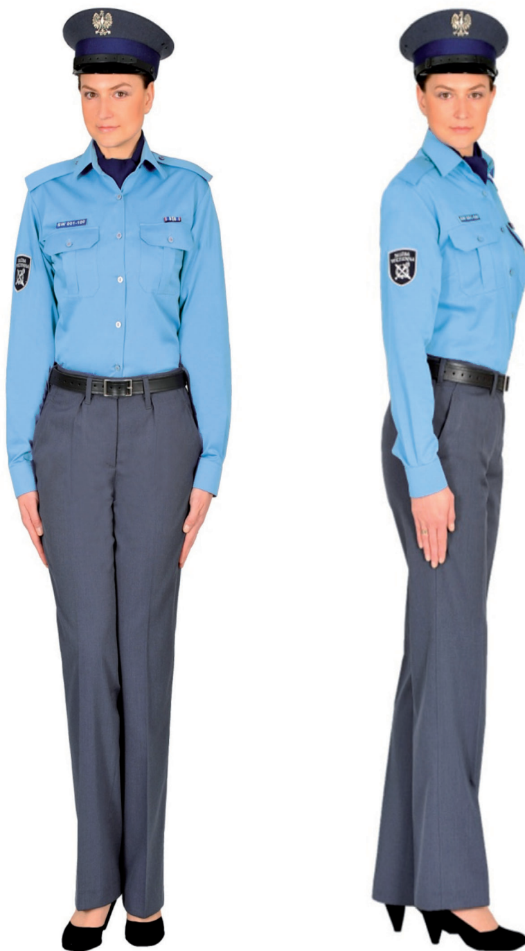
Ubiór funkcjonariusza kobiety w koszuli służbowej, apaszcze, spodniach, półbutach służbowych i w czapce służbowej