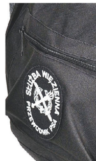
znak identyfikacyjny przewodnika psa