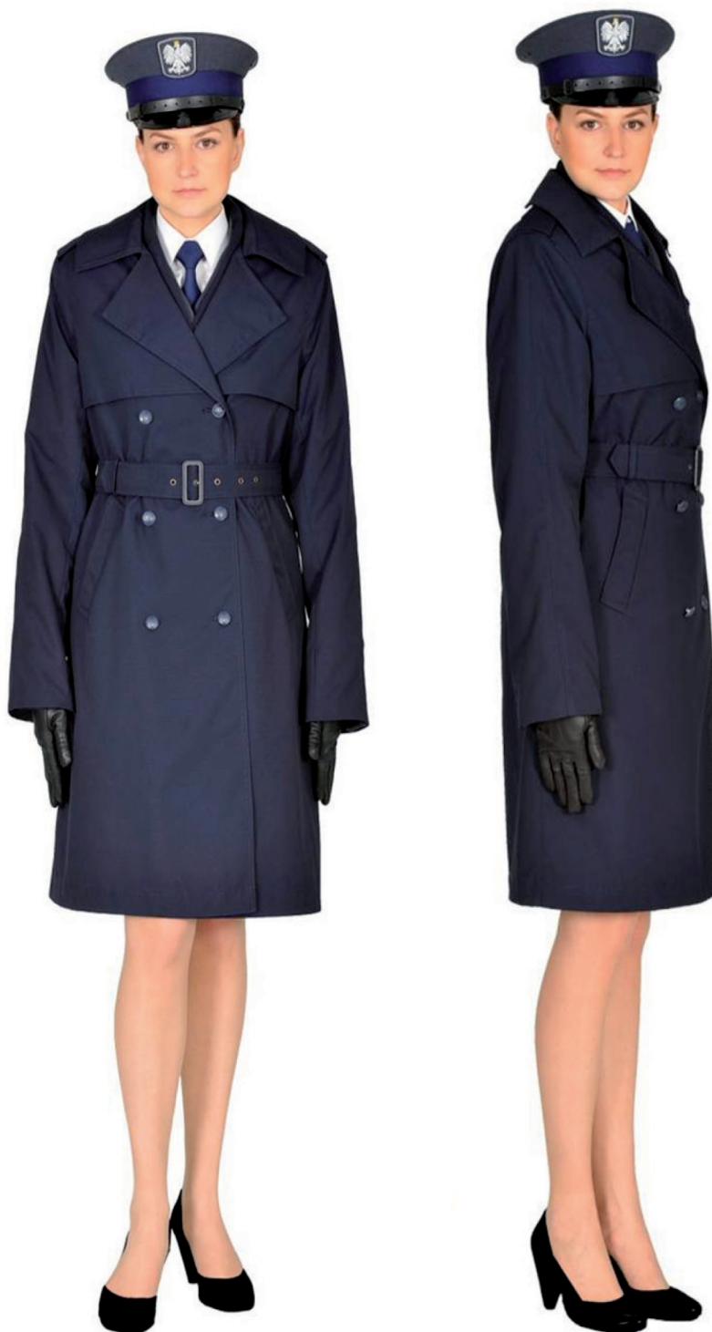
Ubiór funkcjonariusza kobiety w płaszczu wyjściowym letnim, półbutach wyjściowych i w czapce wyjściowej