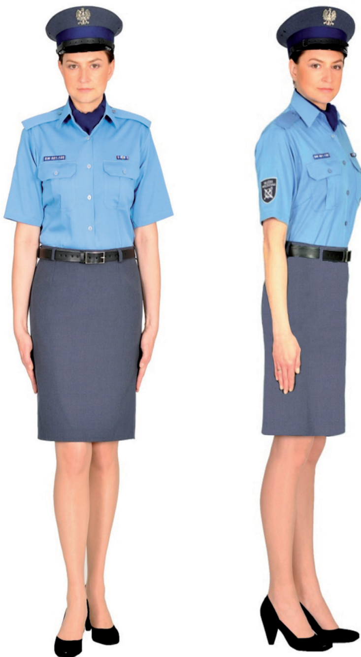
Ubiór funkcjonariusza kobiety w koszuli służbowej letniej, spódnicy letniej i w czapce służbowej