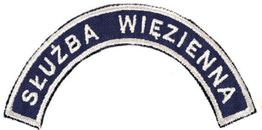
oznaka służby w kształcie półkolistym