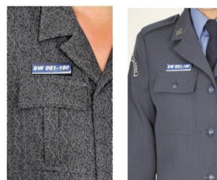
sposób noszenia znaku numerycznego