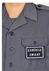
sposób noszenia znaku funkcyjnego w formie plakietki