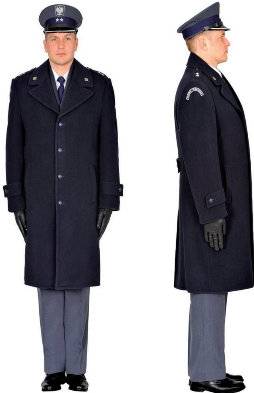
Ubiór funkcjonariusza mężczyzny w płaszczu wyjściowym zimowym, półbutach wyjściowych i w czapce wyjściowej