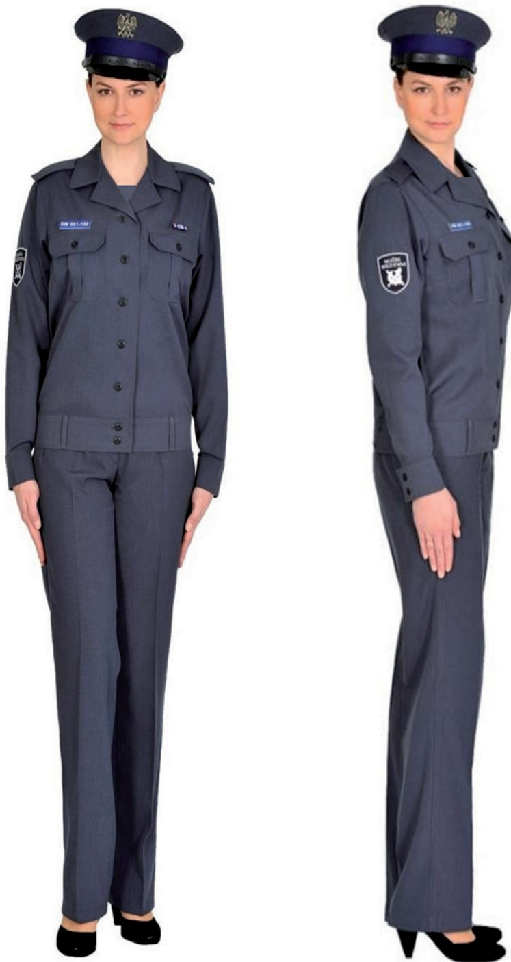
Ubiór funkcjonariusza kobiety w wiatrówce letniej, spodniach letnich i w czapce służbowej