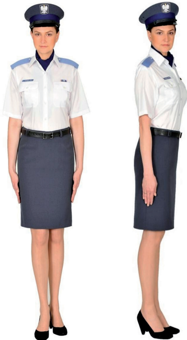
Ubiór funkcjonariusza kobiety w koszuli wyjściowej letniej, apaszcze, spódnicy letniej, półbutach wyjściowych i w czapce wyjściowej