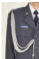
sposób noszenia znaku imiennego