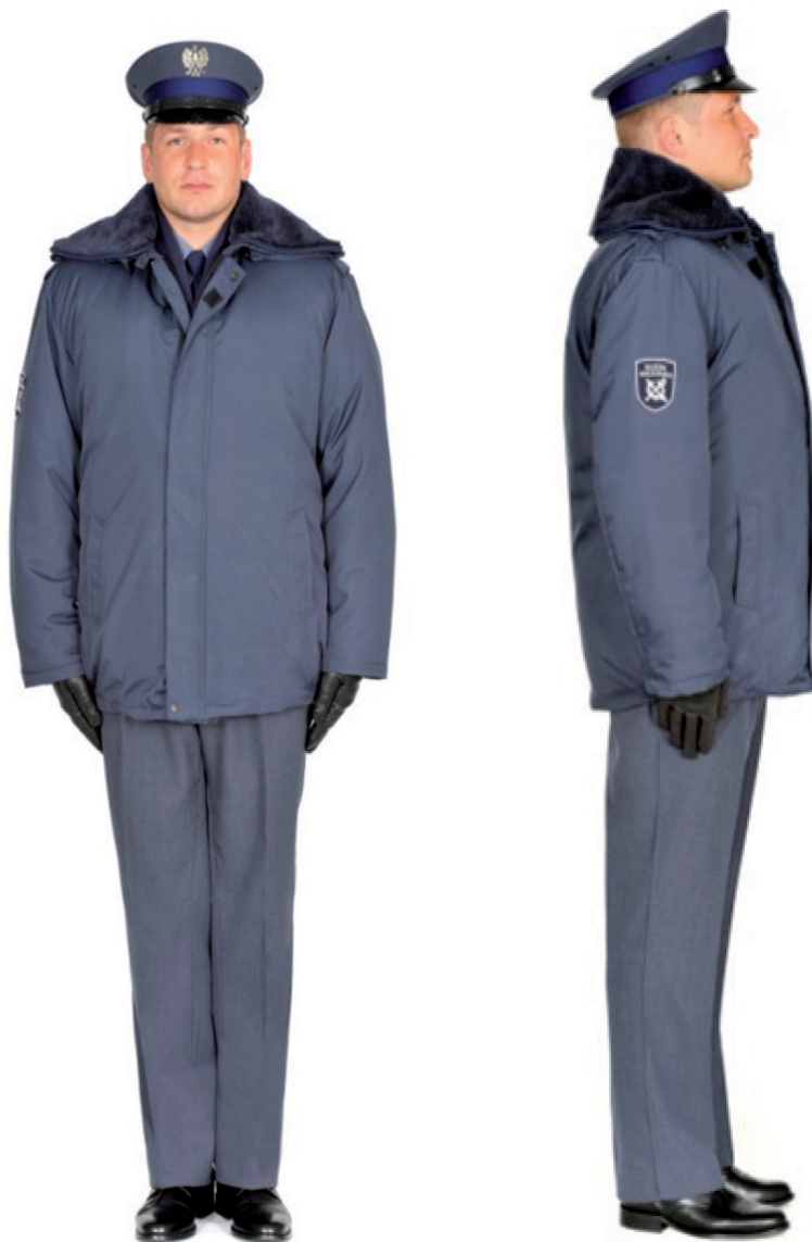
Ubiór funkcjonariusza w kurtce całorocznej, półbutach służbowych i w czapce służbowej