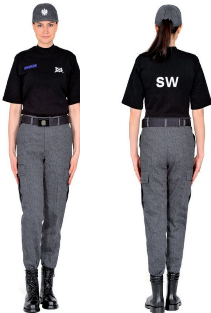
Ubiór funkcjonariusza w podkoszulku, trzewikach polowych i w czapce polowej