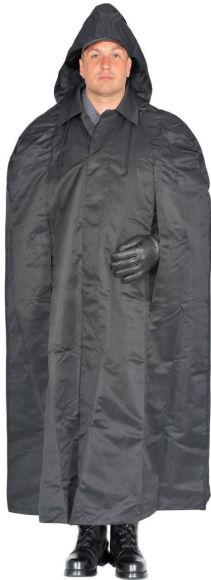
Ubiór funkcjonariusza w pelerynie