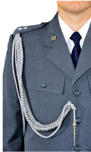
system mocowania sznura galowego oficera do munduru wyjściowego