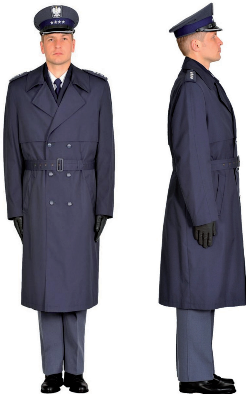
Ubiór funkcjonariusza mężczyzny w płaszczu wyjściowym letnim, półbutach wyjściowych i w czapce wyjściowej