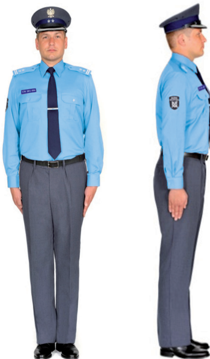
Ubiór funkcjonariusza mężczyzny w koszuli służbowej, krawacie, spodniach, półbutach służbowych i w czapce służbowej