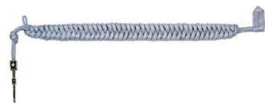
sznur galowy podoficera i szeregowego