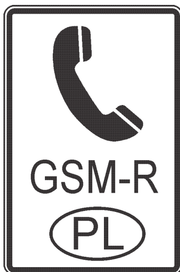
Rys. 198a. Wskaźnik W 33