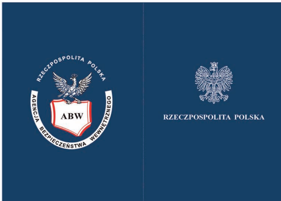
Strona 1, 4