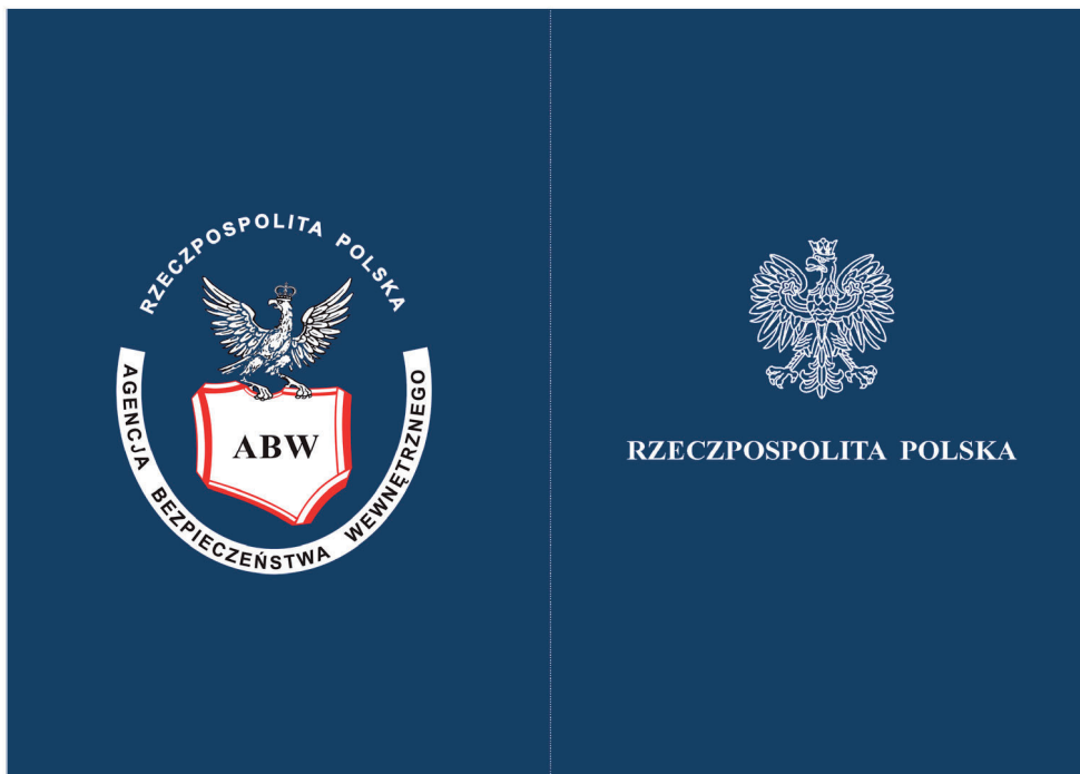
Strona 1, 4