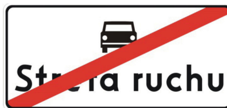
Rys. 5.2.57.1. Znak D-53

Znak D-53 „koniec strefy ruchu” (rys. 5.2.57.1) stosuje się w celu wskazania wyjazdu z drogi wewnętrznej położonej w strefie ruchu. Znak ten umieszcza się na wszystkich wyjazdach ze strefy oznakowanej znakami D-52, w tym samym przekroju poprzecznym drogi co znak D-52. Znak D-53 „koniec strefy ruchu” może być umieszczony po lewej stronie jezdni, na odwrotnej stronie znaku D-52.”;