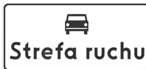
Rys. 5.2.56.1. Znak D-52