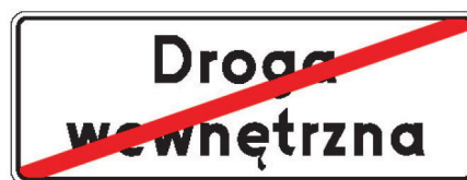
Rys. 5.2.53.1. Znak D-47

Znak D-47 „koniec drogi wewnętrznej” (rys. 5.2.53.1) stosuje się w celu wskazania wjazdu z drogi wewnętrznej na drogę publiczną. Znak ten może być umieszczony po lewej stronie jezdni, na odwrotnej stronie znaku D-46.