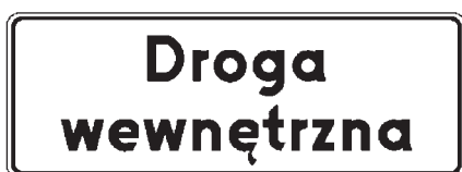
Rys. 5.2.52.1. Znak D-46

Znak D-46 „droga wewnętrzna” (rys. 5.2.52.1) stosuje się w celu wskazania wjazdu na drogę wewnętrzną, w rozumieniu art. 8 ust. 1 ustawy z dnia 21 marca 1985 r. o drogach publicznych (Dz. U. z 2007 r. Nr 19, poz. 115, z późn. zm. 4) ).