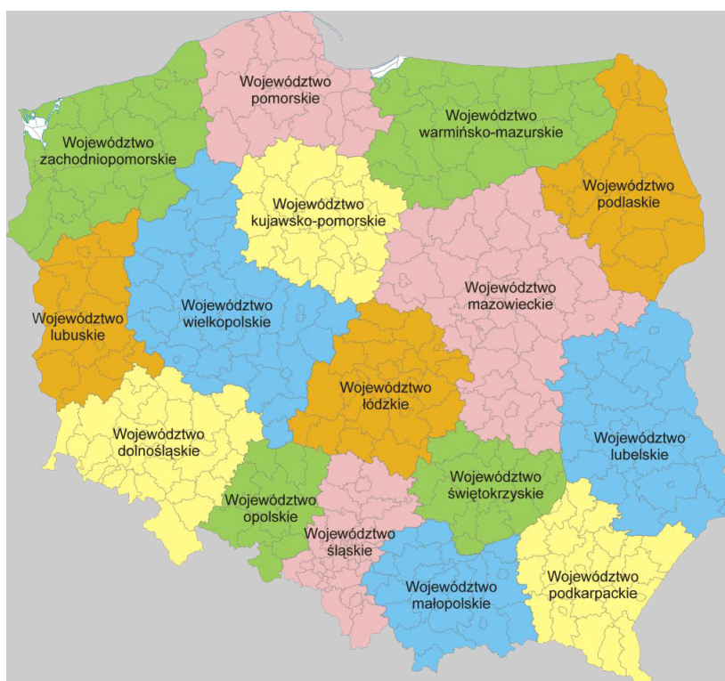
Mapa 2. Podział administracyjny Rzeczypospolitej Polskiej

Program wprowadza się na terytorium Rzeczypospolitej Polskiej. Program jest realizowany na obszarze 16 województw, obejmujących 314 powiatów oraz 66 miast na prawach powiatów.