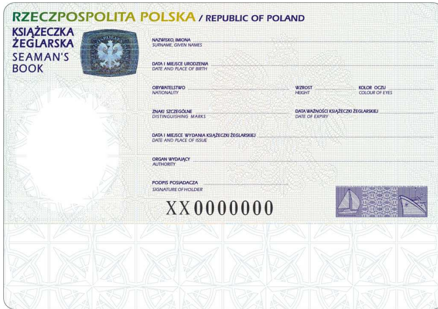
Naklejka personalizacyjna do książeczki żeglarskiej