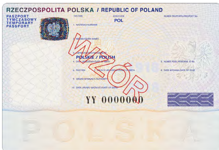
Naklejka personalizacyjna do paszportu tymczasowego