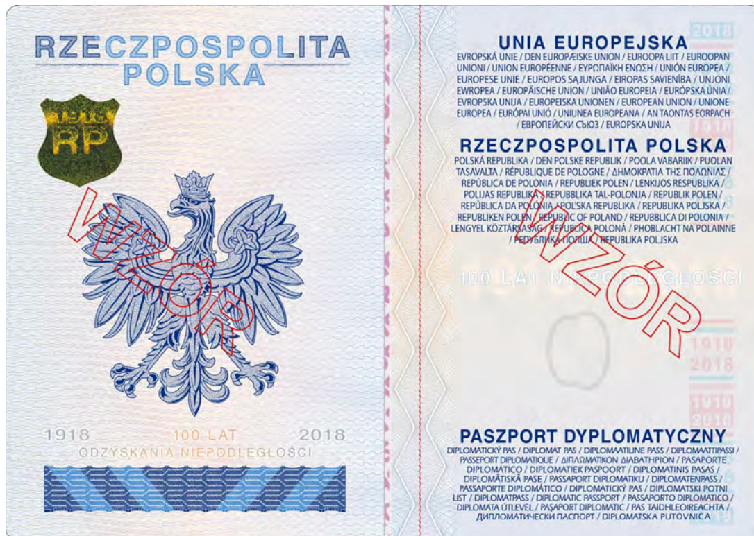
Strona 2 okładki (wewnętrzna)

Okładka zewnętrzna – koloru bordo, z tworzywa sztucznego, z wytłoczonymi bezbarwnymi elementami oraz napisami w języku polskim, angielskim oraz godłem w kolorze złotym