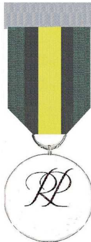
STRONA ODWROTNA Skala 1:1