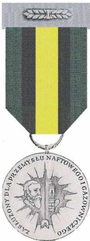
STRONA LICOWA Skala 1:1