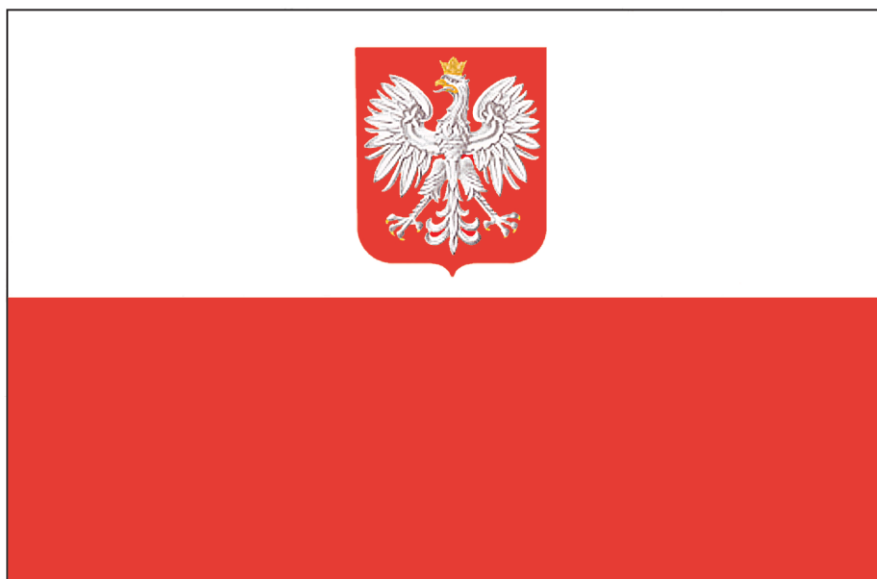
Flaga państwowa z godłem Rzeczypospolitej Polskiej

Stosunek wysokości godła do szerokości flagi – wynosi 2:5