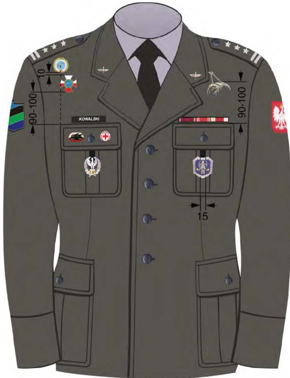
Rys. 6. Sposób noszenia baretek orderów, odznaczeń oraz odznak na kurtce munduru wyjściowego Sił Powietrznych.