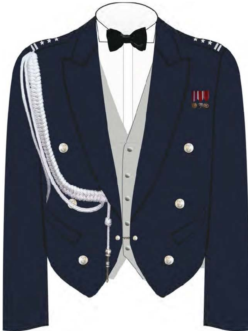
Rys. 1. Sposób noszenia miniaturki orderów i odznaczeń na półfraku munduru wieczorowego.

Załącznik do rozporządzenia Ministra Obrony Narodowej z dnia 4 sierpnia 2015 r.