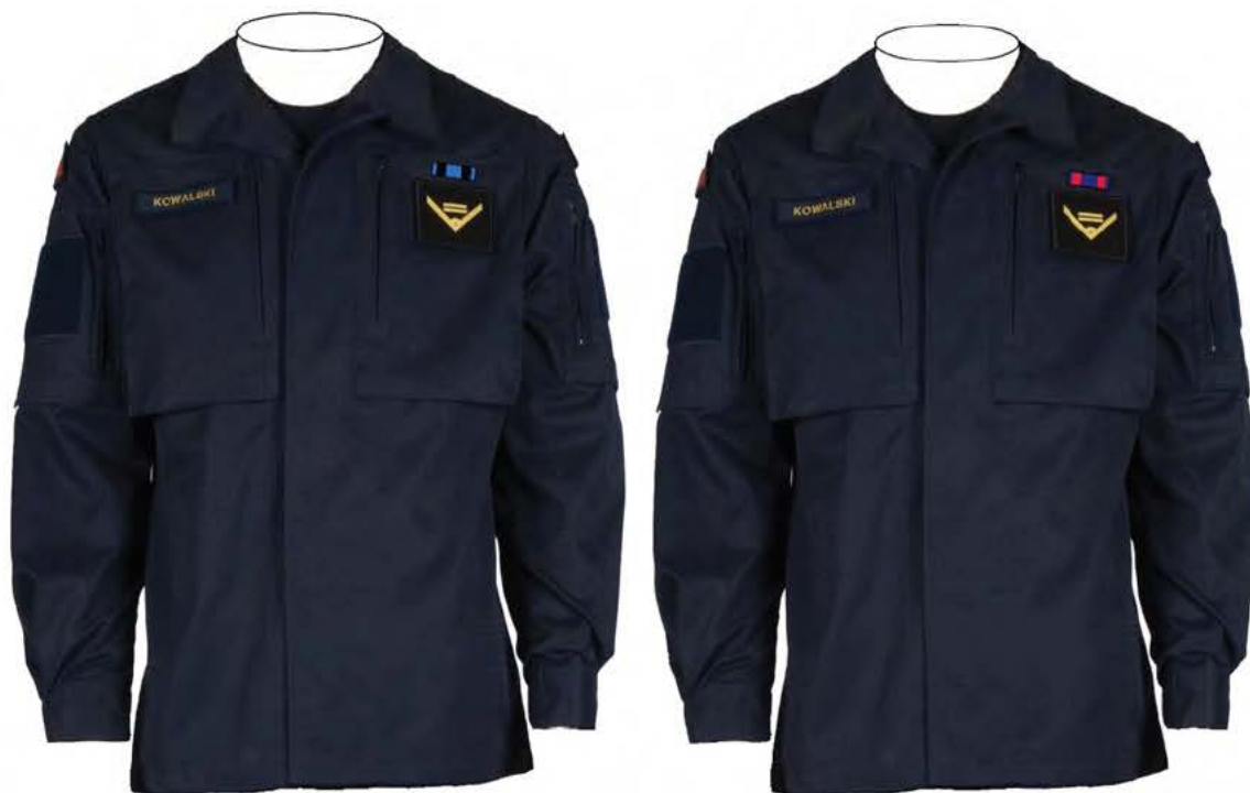
Rys. 10. 7) Sposób noszenia baretek Orderu Wojennego Virtuti Militari i Orderu Krzyża Wojskowego na bluzie munduru ćwiczebnego.