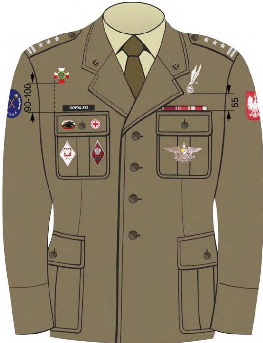
Rys. 5. Sposób noszenia baretek orderów, odznaczeń oraz odznak na kurtce munduru wyjściowego Wojsk Lądowych.