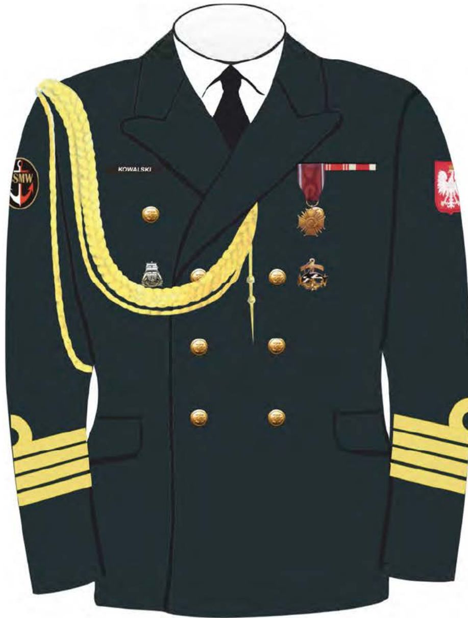
Rys. 4. Sposób noszenia odznak orderów, odznaczeń i odznak na kurtce munduru galowego Marynarki Wojennej.