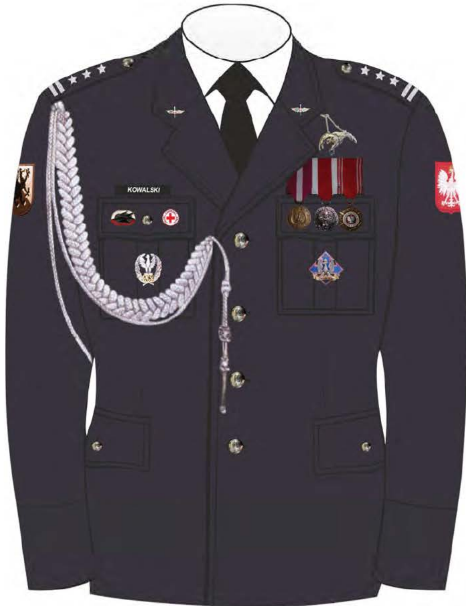
Rys. 3. Sposób noszenia odznak orderów, odznaczeń i odznak na kurtce munduru galowego Sił Powietrznych.