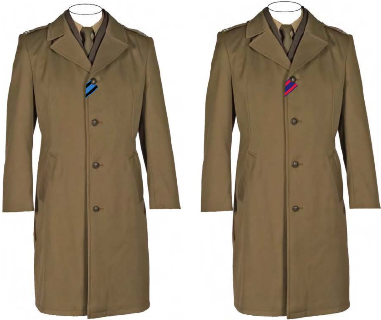
Rys. 11. 7) Sposób noszenia taśmy Orderu Wojennego Virtuti Militari i Orderu Krzyża Wojskowego na płaszczach.