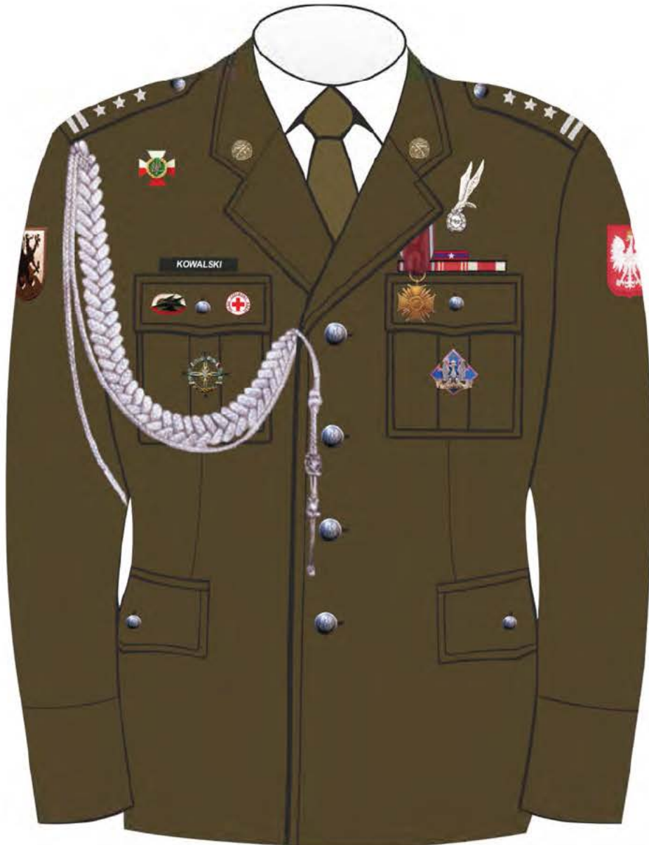
Rys. 2. Sposób noszenia odznak orderów, odznaczeń i odznak na kurtce munduru galowego Wojsk Lądowych.