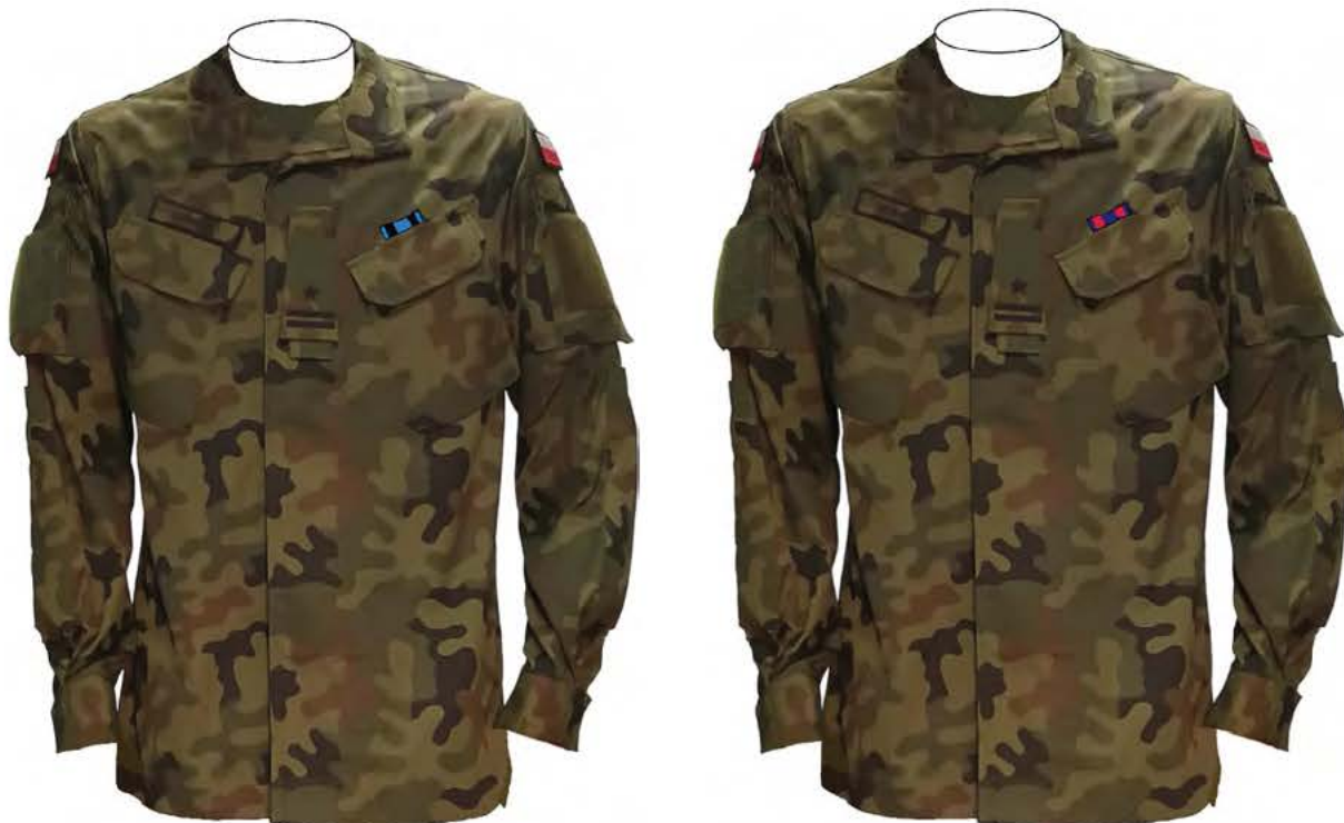
Rys. 9. 7) Sposób noszenia baretek Orderu Wojennego Virtuti Militari i Orderu Krzyża Wojskowego na bluzie munduru polowego.