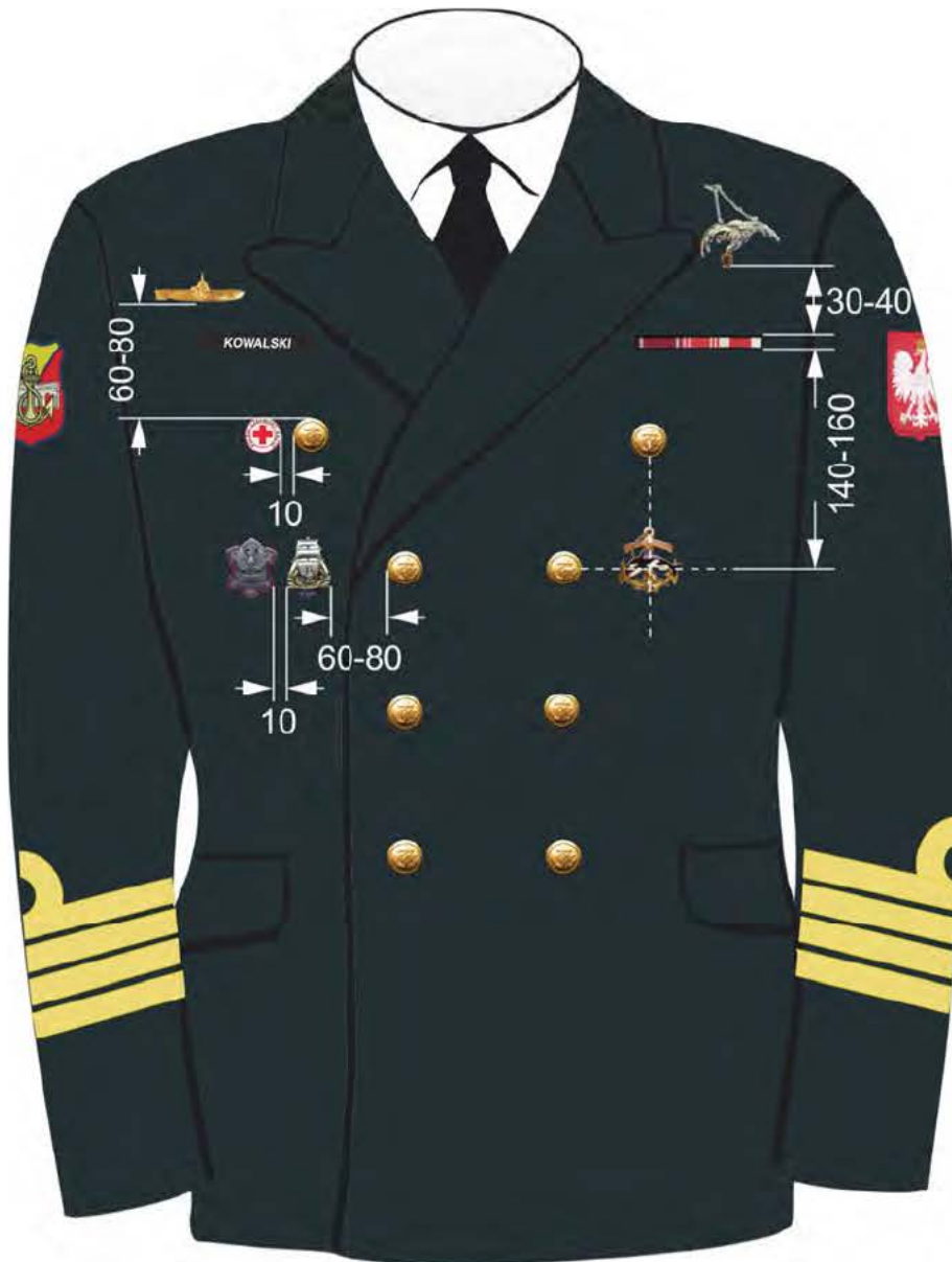
Rys. 7. Sposób noszenia baretek orderów, odznaczeń oraz odznak na kurtce munduru wyjściowego Marynarki Wojennej.