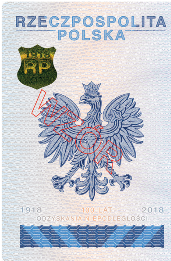
Strona 2 okładki (wewnętrzna)