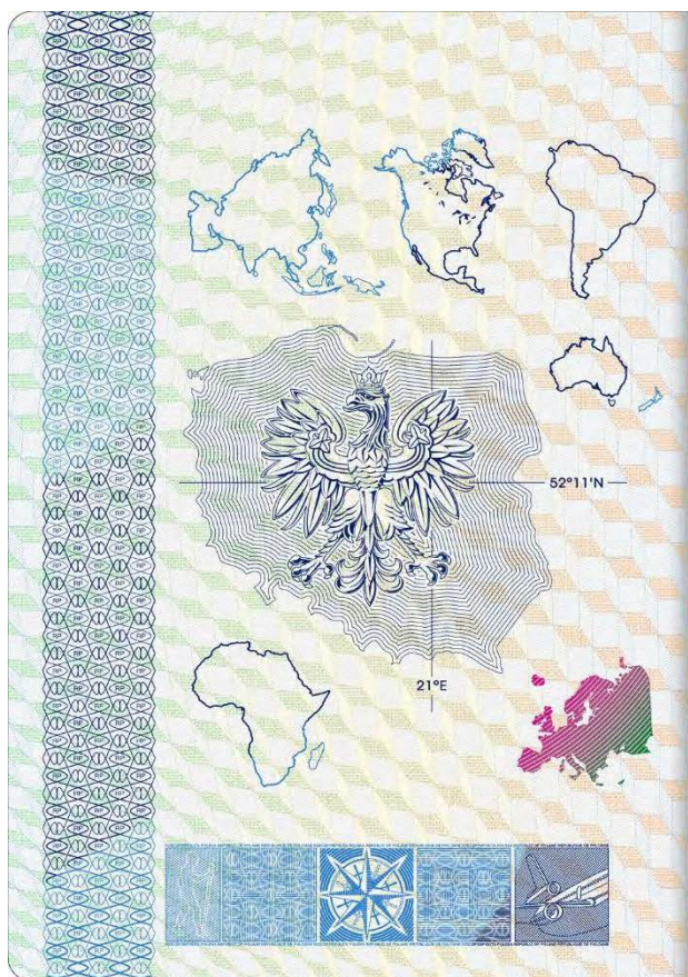
Strona 2 okładki (wewnętrzna)