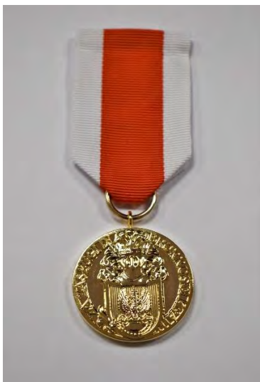
STRONA LICOWA MEDALU