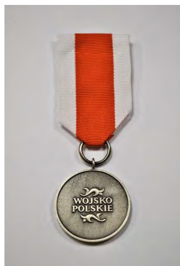
STRONA ODWROTNA MEDALU