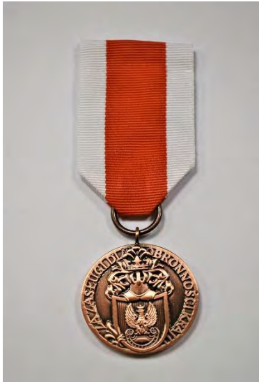
STRONA LICOWA MEDALU