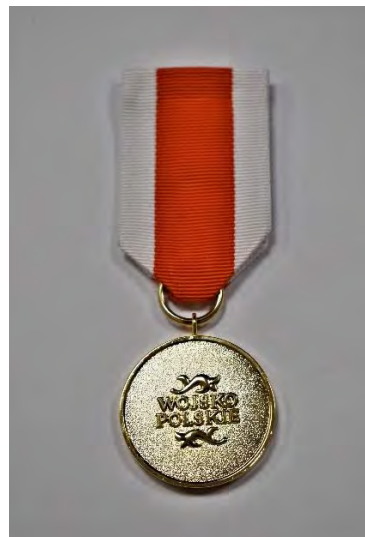
STRONA ODWROTNA MEDALU