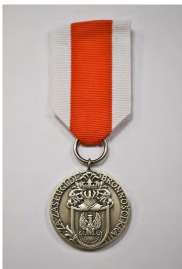
STRONA LICOWA MEDALU