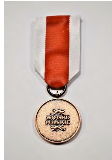
STRONA ODWROTNA MEDALU