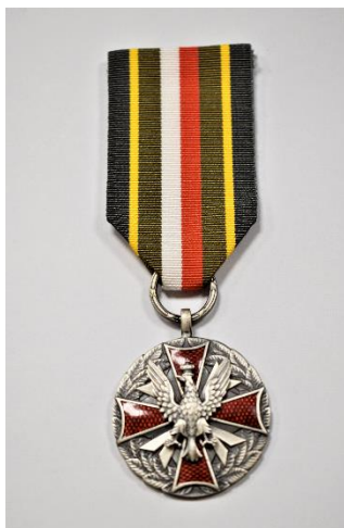
strona licowa medalu