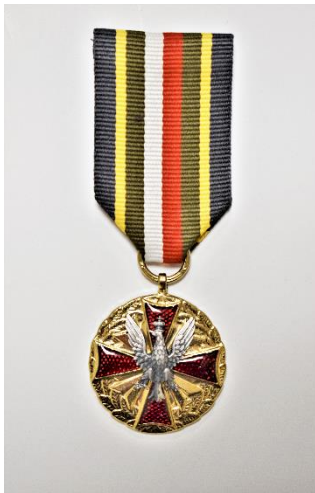
strona licowa medalu