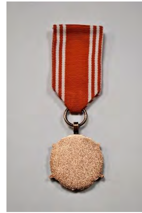
strona odwrotna medalu