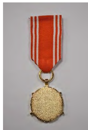
strona odwrotna medalu