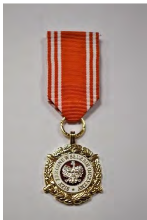
strona licowa medalu