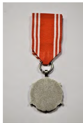
strona odwrotna medalu