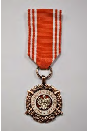
strona licowa medalu