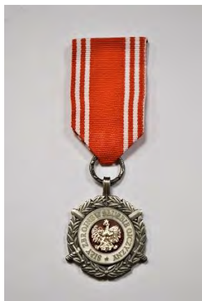
strona licowa medalu