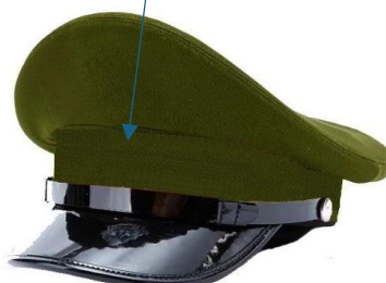
czapka okrągła typu garnizonowego