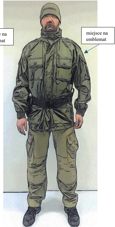
kurtka ocieplana z kapturem oraz spodnie od munduru polowego