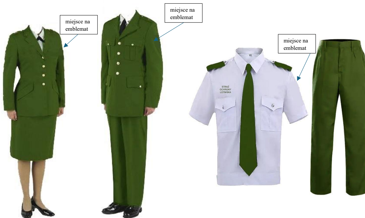
mundur wyjściowy kobięcy i męski (marynarka i spódnica/spodnie)