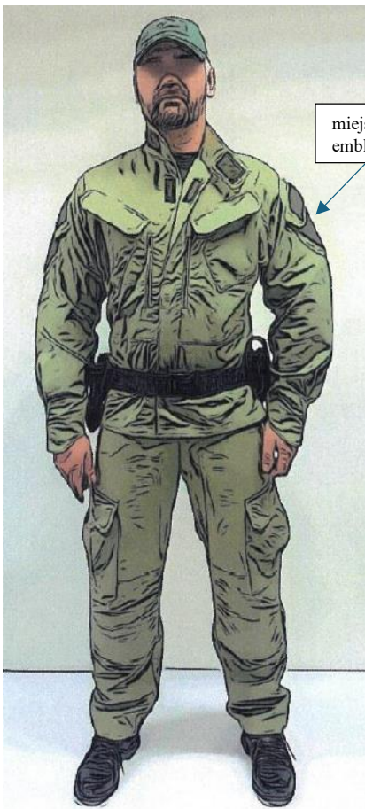
mundur polowy (bluza i spodnie)