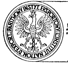
Modèle du cachet