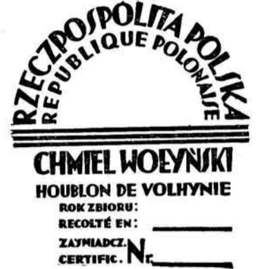
Wzór napisu na opakowaniu Nr. 4 Modèle des marques d'emballage