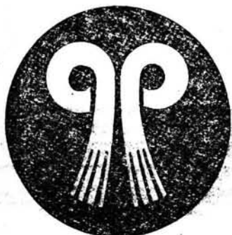
4. Znak fabryczny Dolnośląskiej Fabryki Dywanów Smyrneńskich w Kowarach