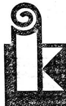
3. Znak fabryczny Śląskich Zakładów Pluszu i Dywanów w Kietrze