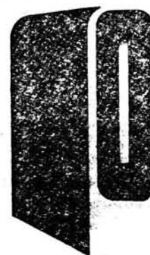
6. Znak fabryczny Kaliskiej Fabryki Pluszu i Aksamitu w Kaliszu

§ 2. Okólnik wchodzi w życie z dniem ogłoszenia.