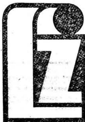
5. Znak fabryczny Lubuskich Zakładów Tkanin Dekoracyjnych w Żarach