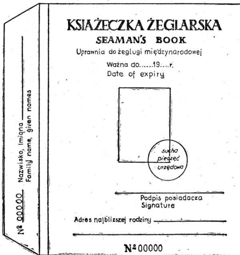
okładka str. 2