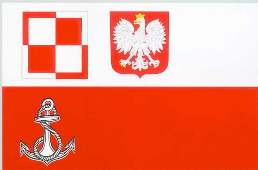
FLAGA LOTNISK (LĄDOWISK) MARYNARKI WOJENNEJ