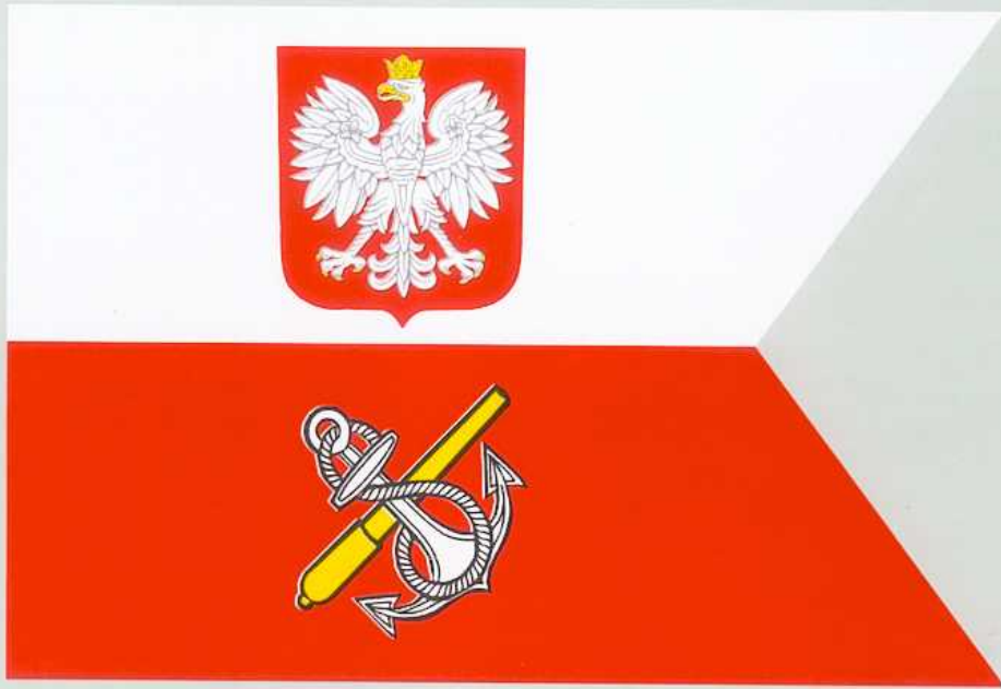
FLAGA MINISTRA OBRONY NARODOWEJ