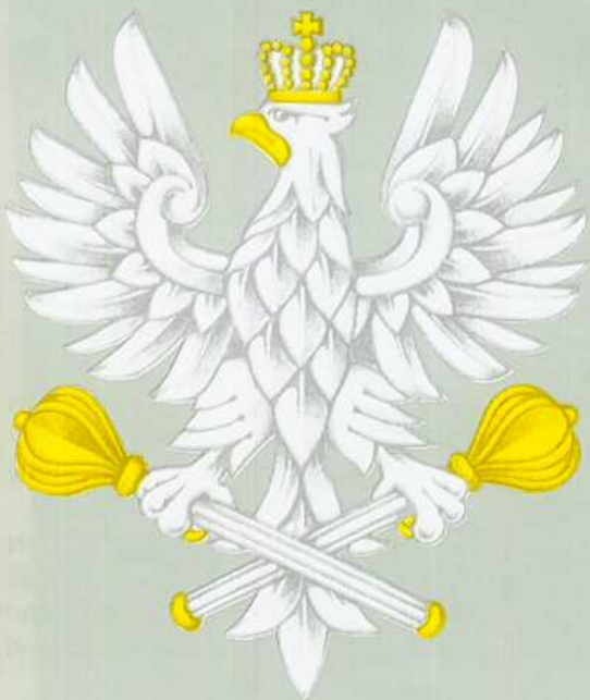
ORZEŁ MARSZAŁKA POLSKI