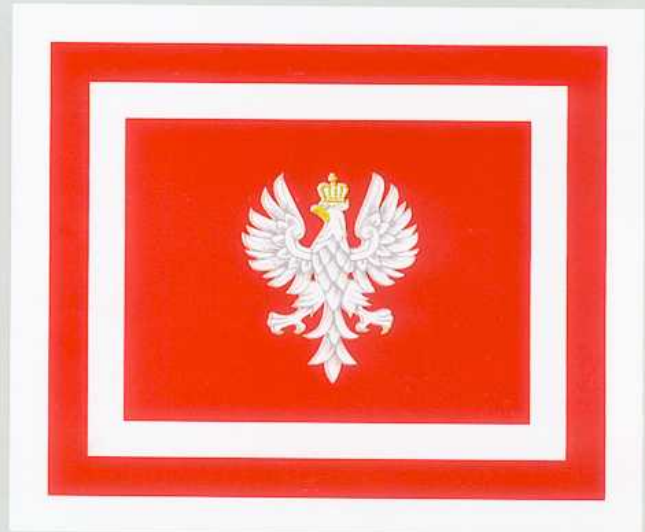
FLAGA SZEFA SZTABU GENERALNEGO WOJSKA POLSKIEGO