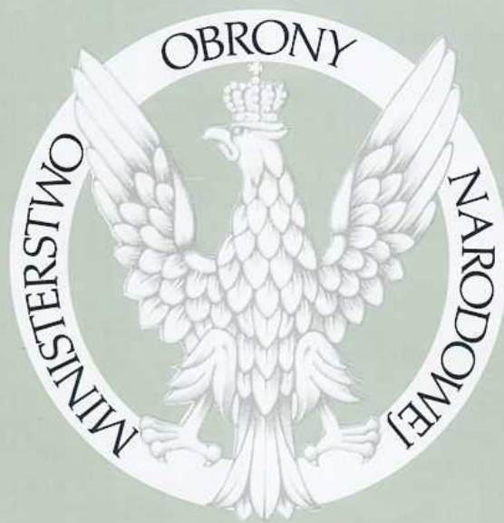
ORZEŁ MINISTERSTWA OBRONY NARODOWEJ