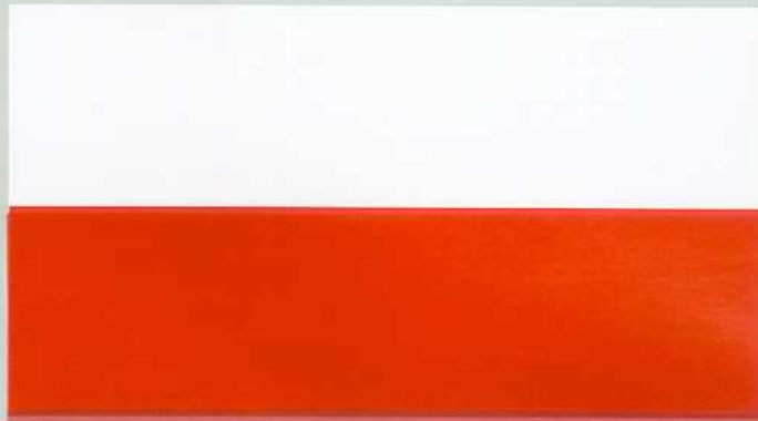
FLAGA PAŃSTWOWA RZECZYPOSPOLITEJ POLSKIEJ