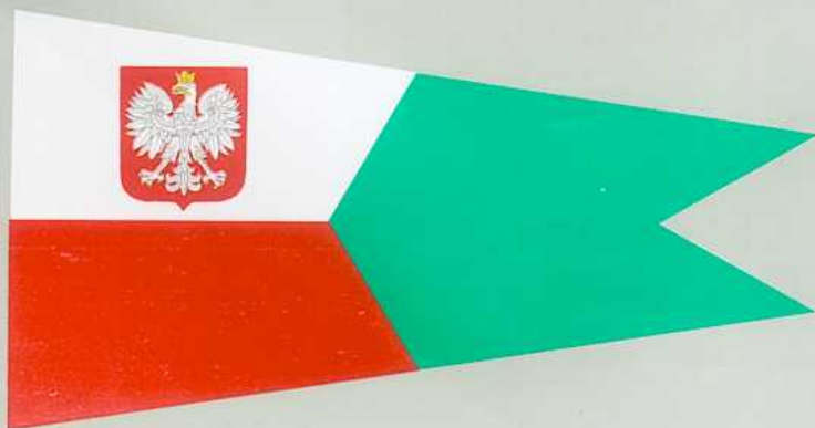
PROPORCZYK DOWÓDCY GRUPY