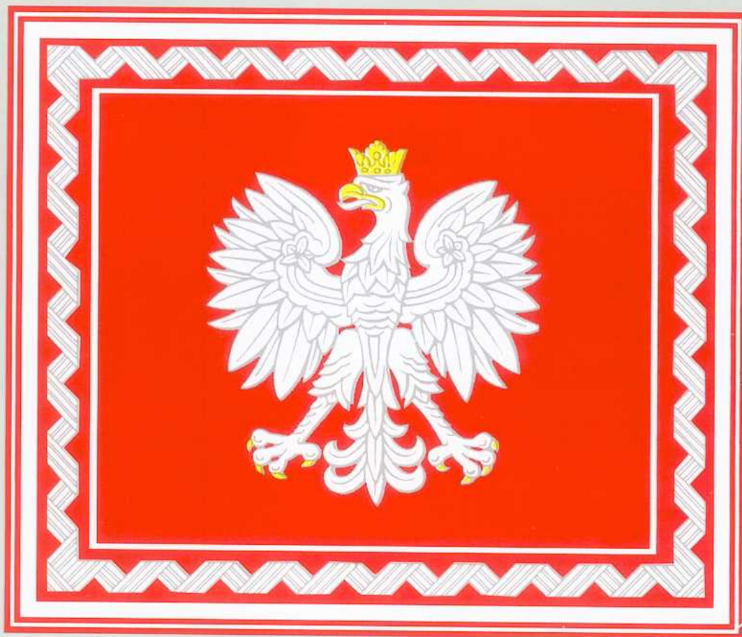
PROPORZEC PREZYDENTA RZECZYPOSPOLITEJ POLSKIEJ