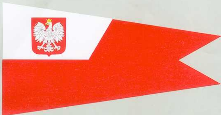
PROPORCZYK SZEFA SZTABU MARYNARKI WOJENNEJ