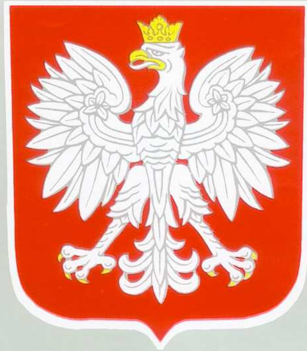
GODŁO RZECZYPOSPOLITEJ POLSKIEJ