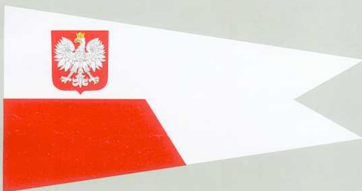
PROPORCZYK DOWÓDCY FLOTYLI