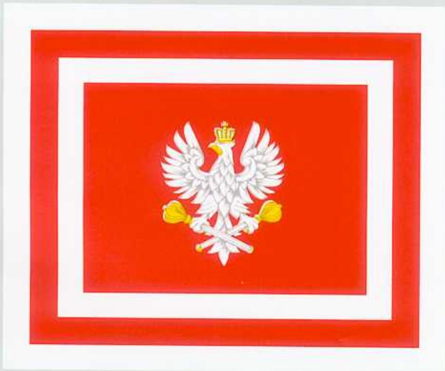
FLAGA MARSZAŁKA POLSKI