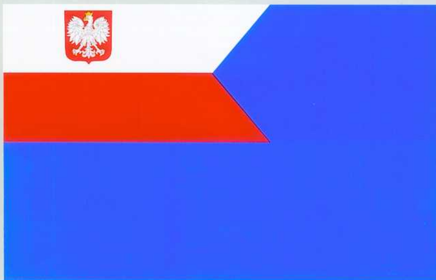
BANDERA POMOCNICZYCH JEDNOSTEK PŁYWAJĄCYCH MARYNARKI WOJENNEJ