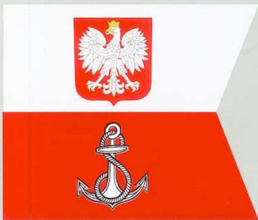
FLAGA DOWÓDCY MARYNARKI WOJENNEJ