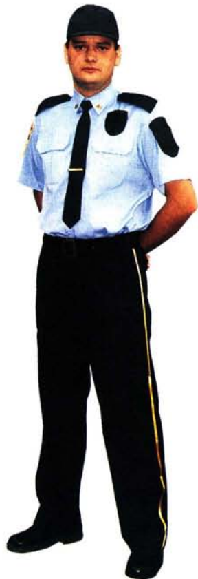
1. Ubiór służbowy letni z czapką typu baseball