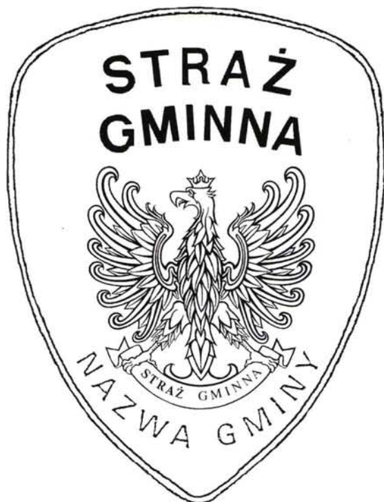
1. Emblemat dla straży gminnej