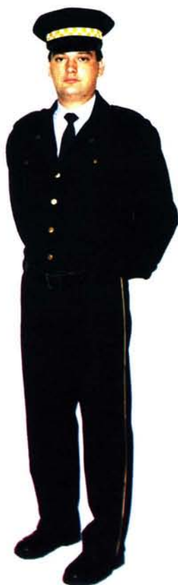
3. Ubiór służbowy letni z wiatrówką