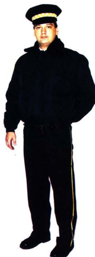
4. Ubiór służbowy zimowy z kurtką uniwersalną krótką