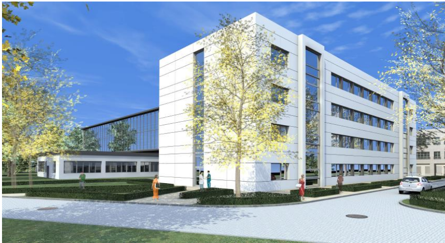
Rycina 4: Wizualizacja budynku CLS