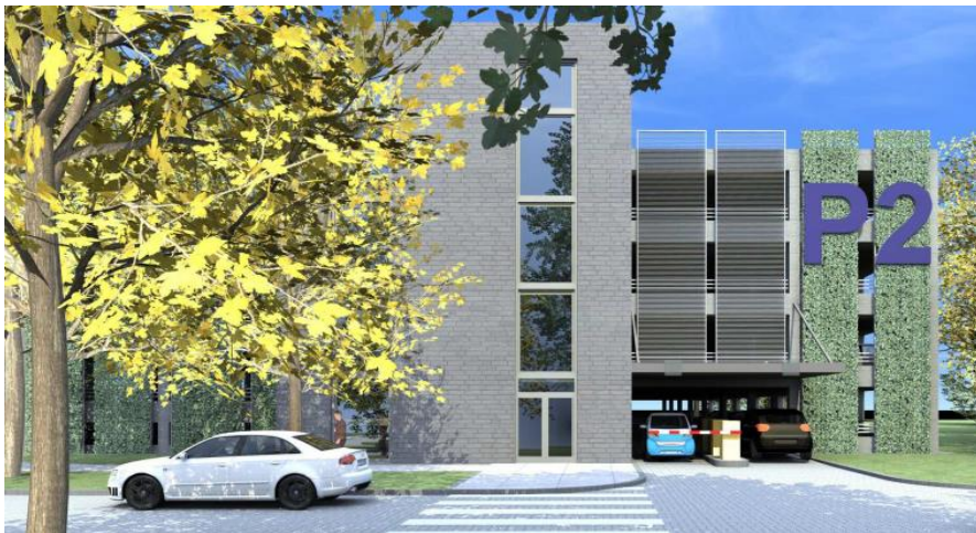
Rycina 5: Wizualizacja wielopoziomowego parkingu naziemnego