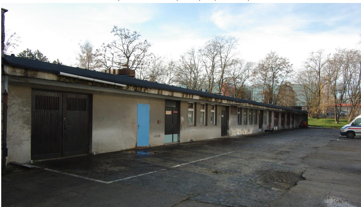
Rycina 6: Stan obecny – Budynek pomocniczy