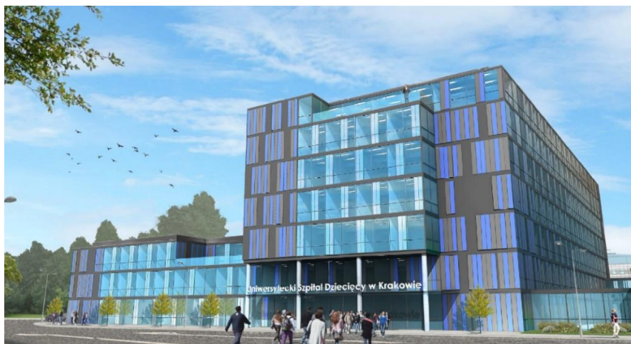
Rycina 2: Wizualizacja budynku UCP – widok 1