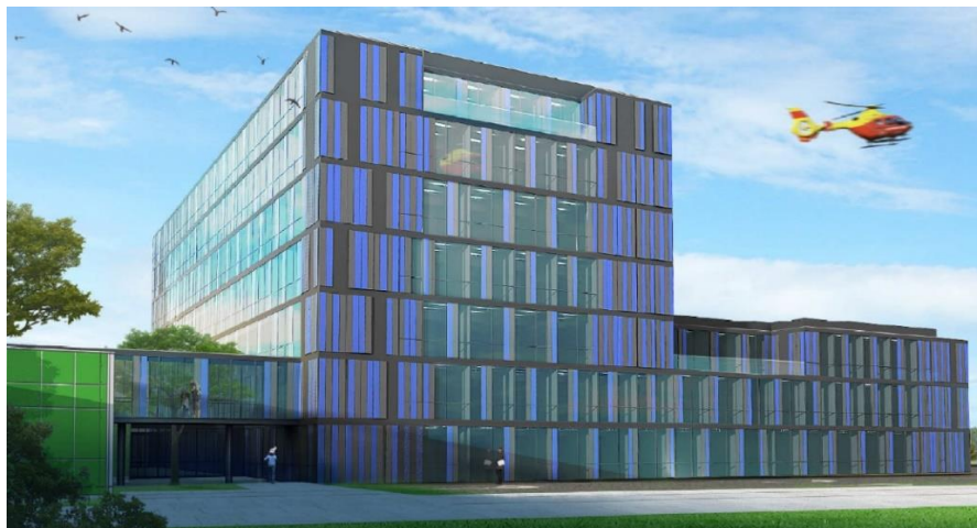
Rycina 3: Wizualizacja budynku UCP – widok 2