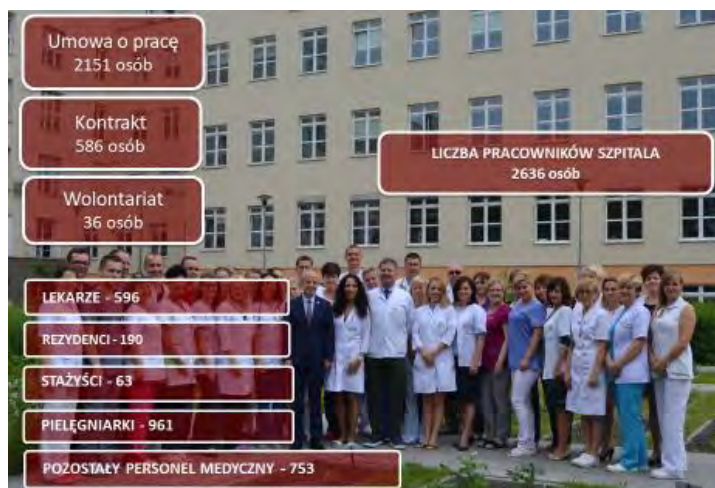
Zdjęcie 2 – Zasoby kadrowe Szpitala.

Kadra Szpitala czynnie organizuje i uczestniczy w konferencjach i zjazdach naukowych dotyczących różnego rodzaju aspektów medycznych.