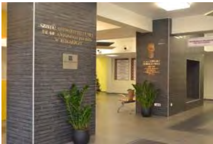
Zdjęcie 1 – Hol Wejścia Głównego Szpitala Uniwersyteckiego nr 1 im. dr. A. Jurasza w Bydgoszczy.