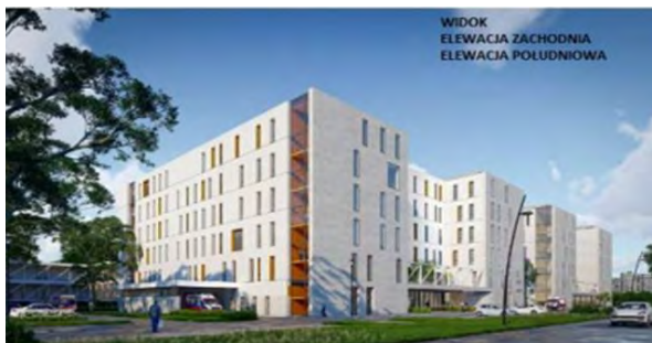
Zdjęcie 3 – Wizualizacja - widok elewacja zachodnia i elewacja południowa.

W ramach inwestycji planuje się budowę nowego budynku szpitalnego, przebudowę istniejących i budowę nowych dróg dojazdowych, infrastruktury technicznej oraz zagospodarowanie terenów zielonych niezbędnych dla funkcjonowania nowych obiektów. Inwestycja obejmuje również wyposażenie poszczególnych obszarów i pomieszczeń nowego budynku oraz zakładów diagnostycznych Szpitala powiązanych z udzielaniem świadczeń dla pacjentów pediatrycznych w sprzęt i aparaturę medyczną oraz wyposażenie w inne niezbędne sprzęty i urządzenia zgodne z funkcją tych pomieszczeń.