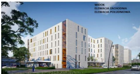
Zdjęcie 3 – Wizualizacja - widok elewacja zachodnia i elewacja południowa.

W ramach inwestycji planuje się budowę nowego budynku szpitalnego, przebudowę istniejących i budowę nowych dróg dojazdowych, infrastruktury technicznej oraz zagospodarowanie terenów zielonych niezbędnych dla funkcjonowania nowych obiektów. Inwestycja obejmuje również wyposażenie poszczególnych obszarów i pomieszczeń nowego budynku oraz zakładów diagnostycznych Szpitala powiązanych z udzielaniem świadczeń dla pacjentów pediatrycznych w sprzęt i aparaturę medyczną oraz wyposażenie w inne niezbędne sprzęty i urządzenia zgodne z funkcją tych pomieszczeń.