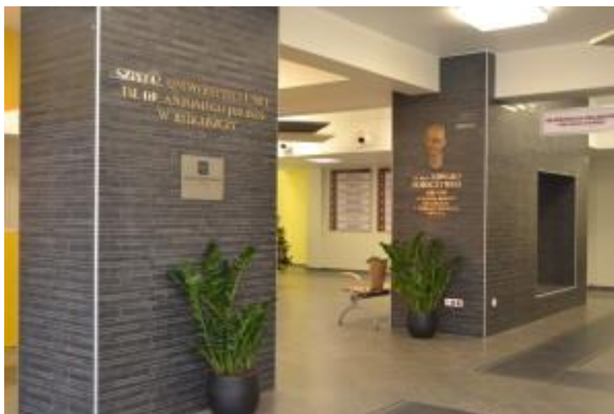
Zdjęcie 1 – Hol Wejścia Głównego Szpitala Uniwersyteckiego nr 1 im. dr. A. Jurasza w Bydgoszczy.