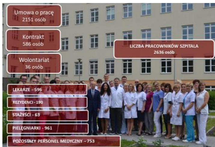
Zdjęcie 2 – Zasoby kadrowe Szpitala.

Kadra Szpitala czynnie organizuje i uczestniczy w konferencjach i zjazdach naukowych dotyczących różnego rodzaju aspektów medycznych.