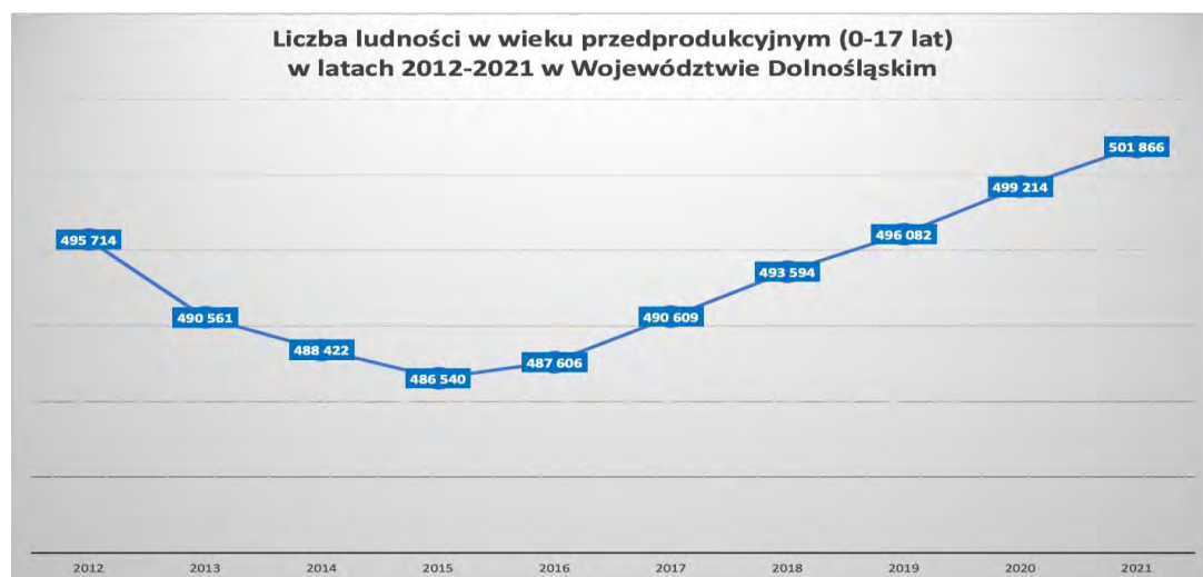
Wykres 1 – Liczba dzieci i młodzieży na Dolnym Śląsku w latach 2012–2021.