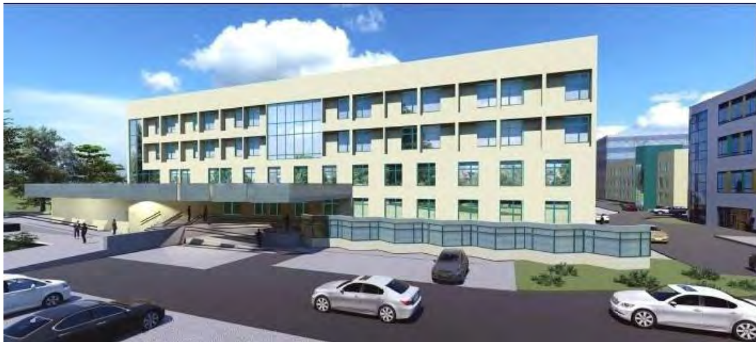
Widok od Parku Skowroniego – wejście główne