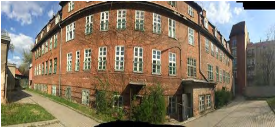
Budynek przy ul. M. Curie-Skłodowskiej 50-52, w którym funkcjonuje Klinika Pediatrii, Gastroenterologii i Żywienia.

Stan techniczny budynku przy ul. M. Curie-Skłodowskiej 50-52, określony między innymi na podstawie prowadzonych kontroli stanu technicznego, przedstawia się następująco: