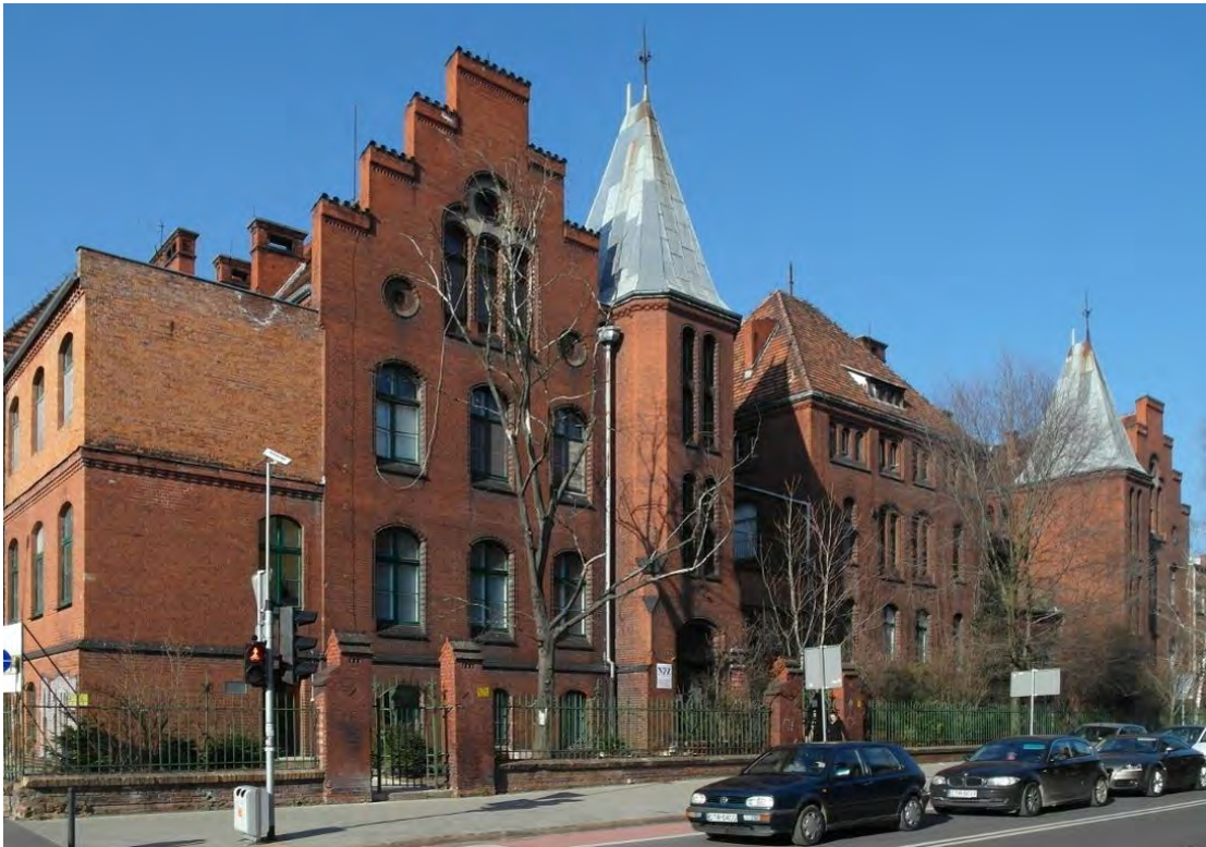
Zdjęcie 1 – Budynek przy ul. T. Chałubińskiego 2-2a.

Budynek przy ul. T. Chałubińskiego 2-2a, w którym obecnie znajduje się Klinika Pediatrii i Chorób Infekcyjnych, Klinika Endokrynologii i Diabetologii Wieku Rozwojowego oraz Klinika Pediatrii, Alergologii i Kardiologii.