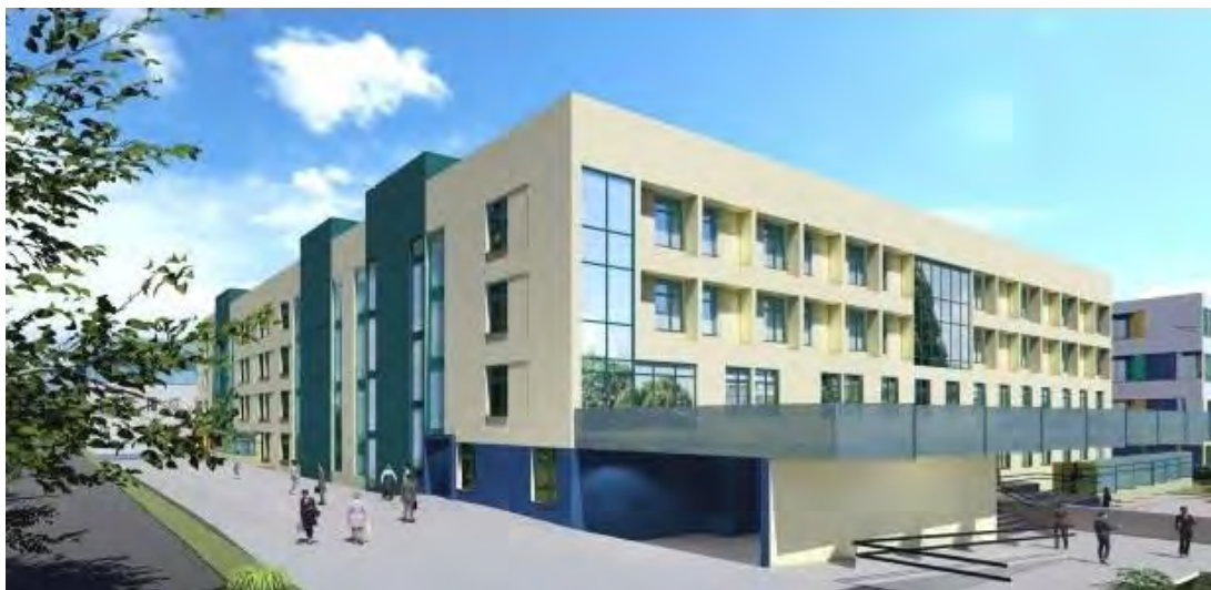
Widok – narożnik północno-zachodni