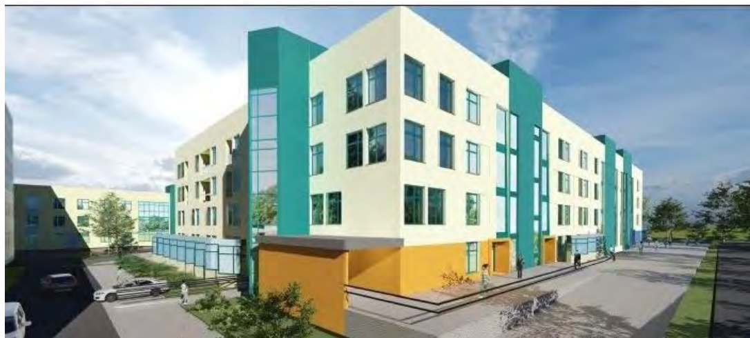
Rysunek 2 – Wizualizacja budynku ZCP.

Widok – narożnik wschodnio-północny obszar zakaźny z podjazdem dla karet