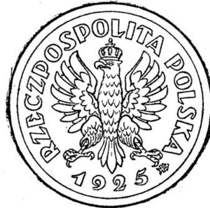
Wzór № 2. Strona odwrotna monety srebrnej wartości 5 złotych.