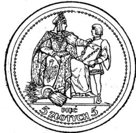
Wzór № 1. Strona główna monety wartości 5 złotych.