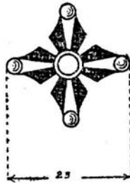
6. Wykroj błachy grzebienia hełmu wyższych funkcjonarjuszów.