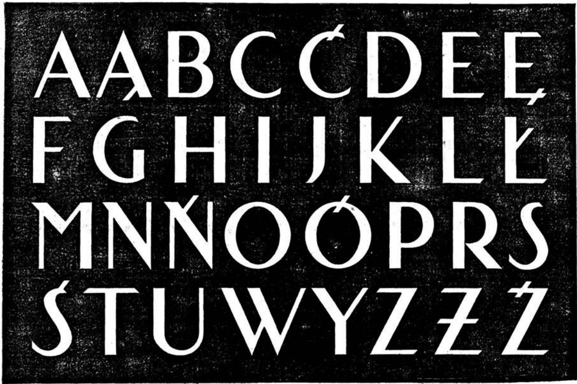
Wzór Nr. 3.