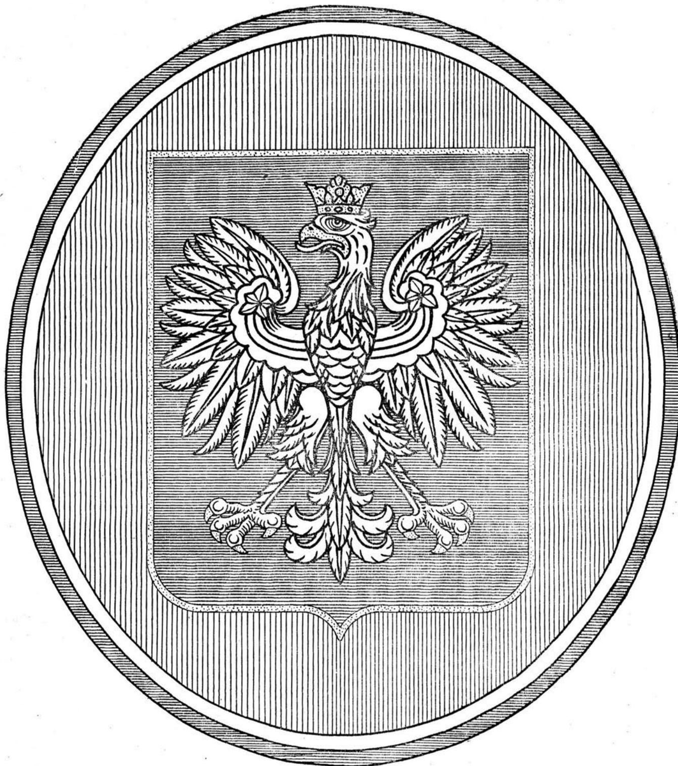
Wzór Nr. 1.

Załączniki do rozp. Prezydenta Rzeczypospolitej z dnia 29 marca 1930 r. (poz. 245).