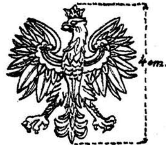
Tabl. Nr. 6