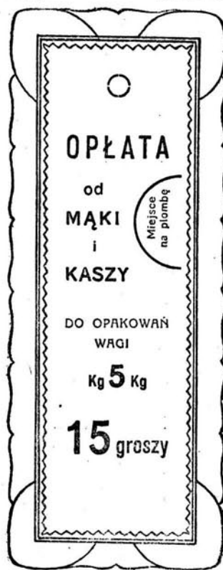
Kolor druku — złoty.