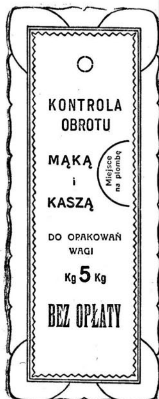
Kolor druku — czarny.