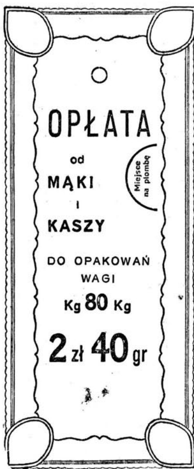
Kolor druku — zielony.