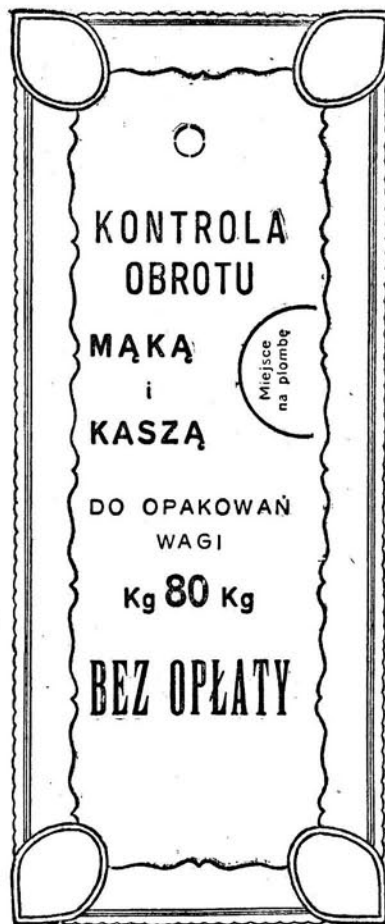
Kolor druku — czarny.