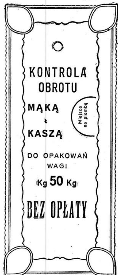
Kolor druku — czarny.