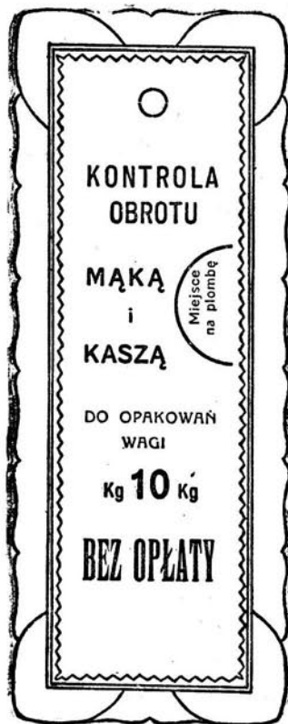
Kolor druku — czarny.