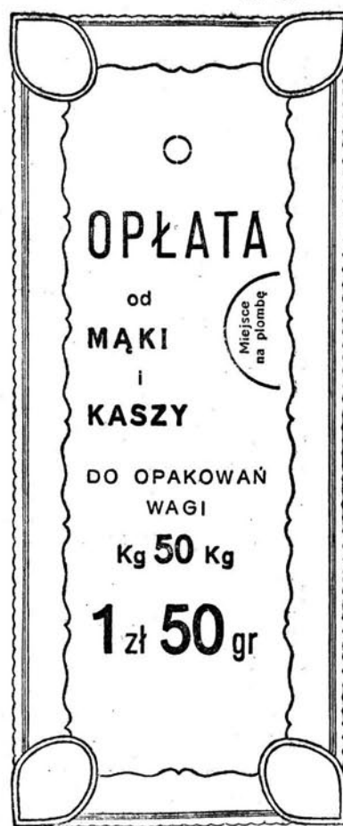
Kolor druku — brązowy.