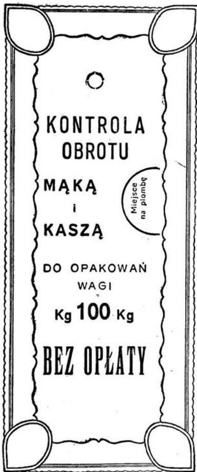
Kolor druku — czarny.