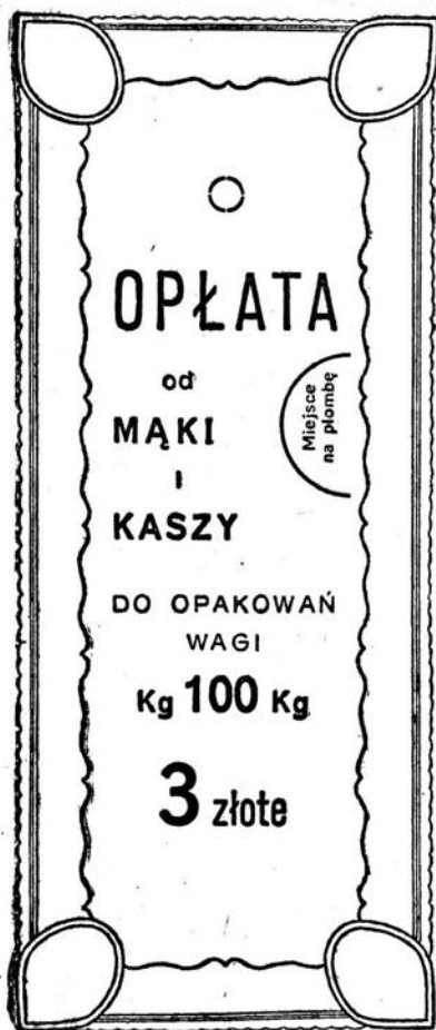
Kolor druku — niebieski.