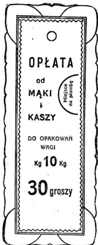
Kolor druku — fioletowy.