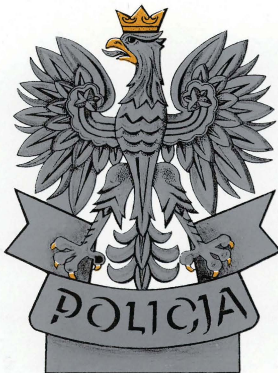
GŁOWICA SZTANDARU — STRONA GŁÓWNA