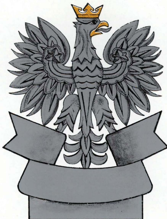
GŁOWICA SZTANDARU — STRONA ODWROTNA