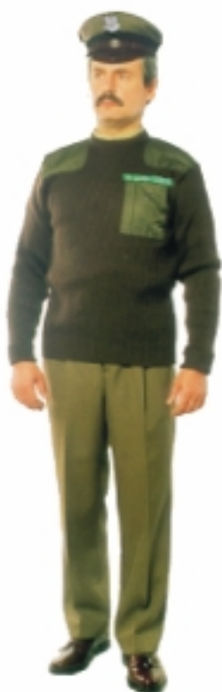
Sweter do munduru