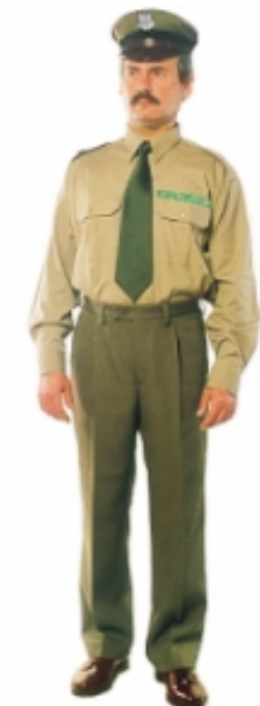
Mundur męski z koszulą z długim rękawem