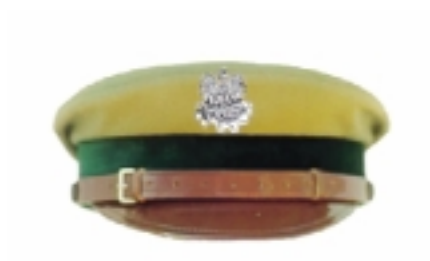
Czapka do munduru wyjściowego i polowego