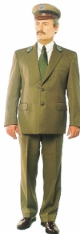
Mundur wyjściowy męski