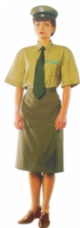
Mundur damski z koszulą z krótkim rękawem