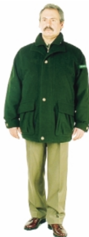
Kurtka zimowa męska