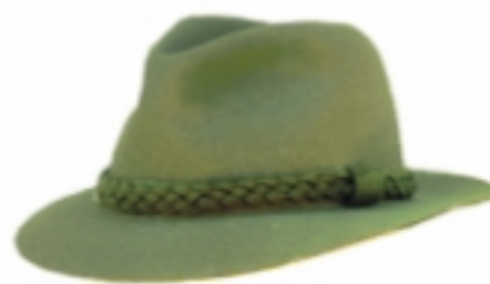
Kapelusz męski do munduru wyjściowego