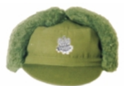
Czapka zimowa do munduru polowego