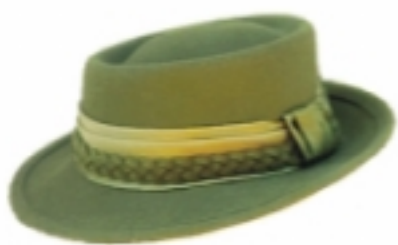
Kapelusz damski do munduru wyjściowego