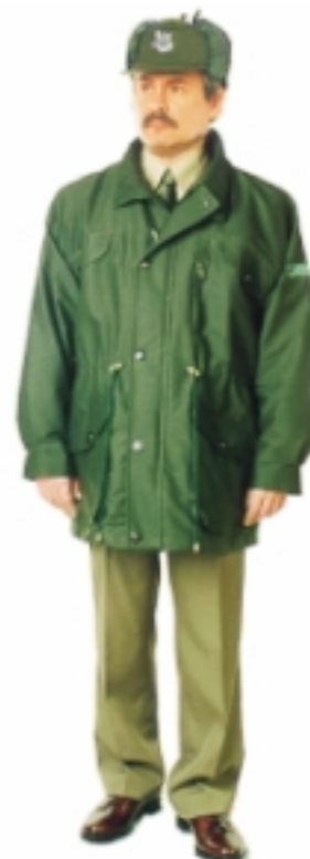
Kurtka do munduru