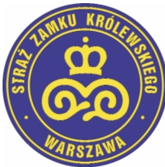
Emblemat na rękawy