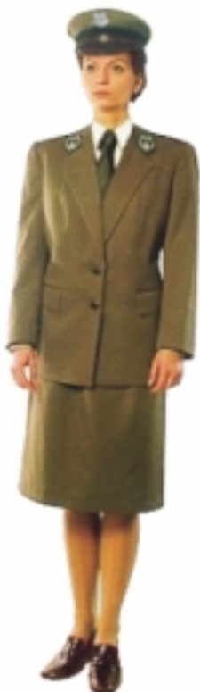
Mundur wyjściowy damski