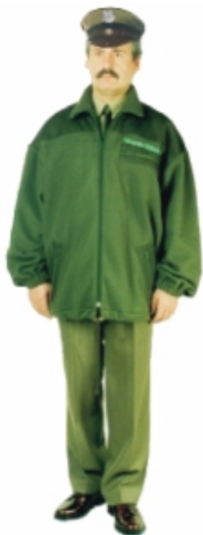
Bluza z polaru do munduru