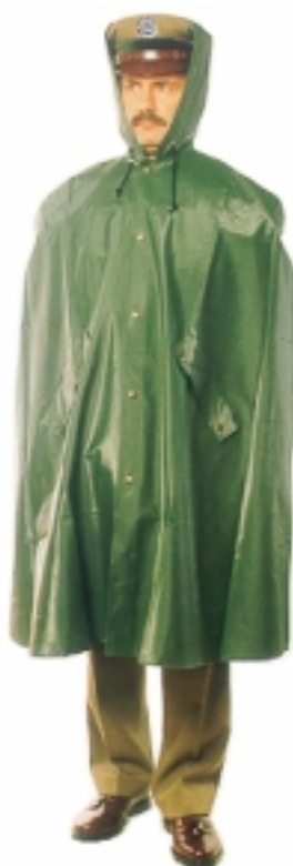
Peleryna do munduru