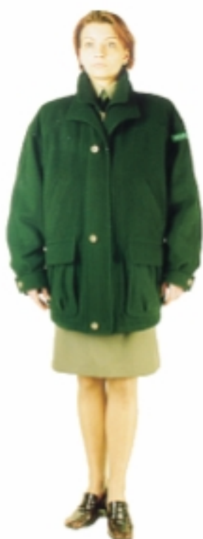
Kurtka zimowa damska