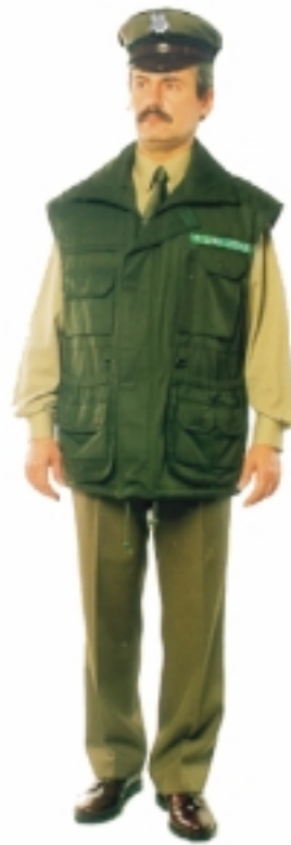
Kamizelka do munduru