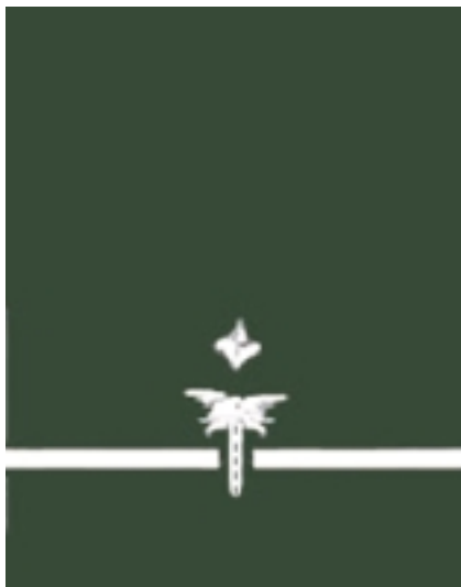
Młodszy Inspektor Transportu Drogowego