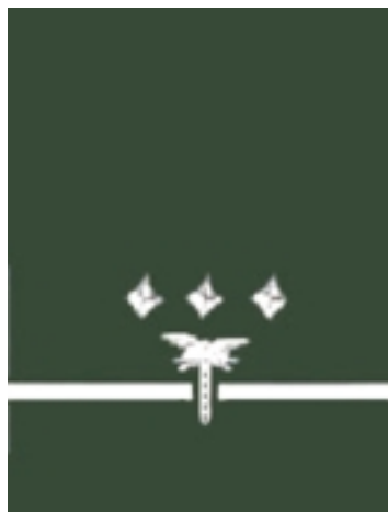
Starszy Inspektor Transportu Drogowego