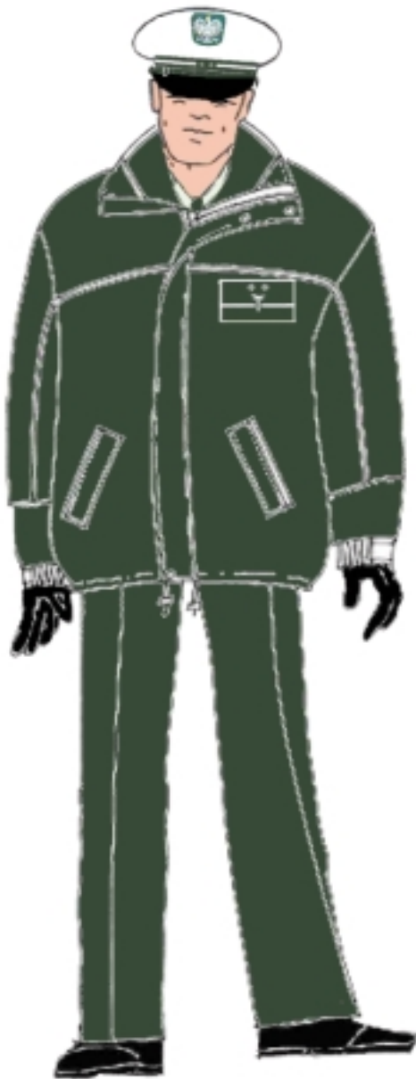
Ubiór inspektora w kurtce ocieplanej