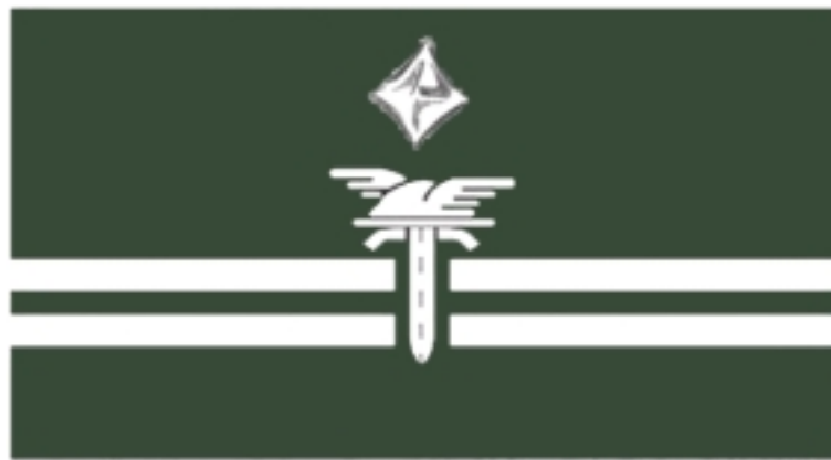
Zastępca Wojewódzkiego Inspektora Transportu Drogowego