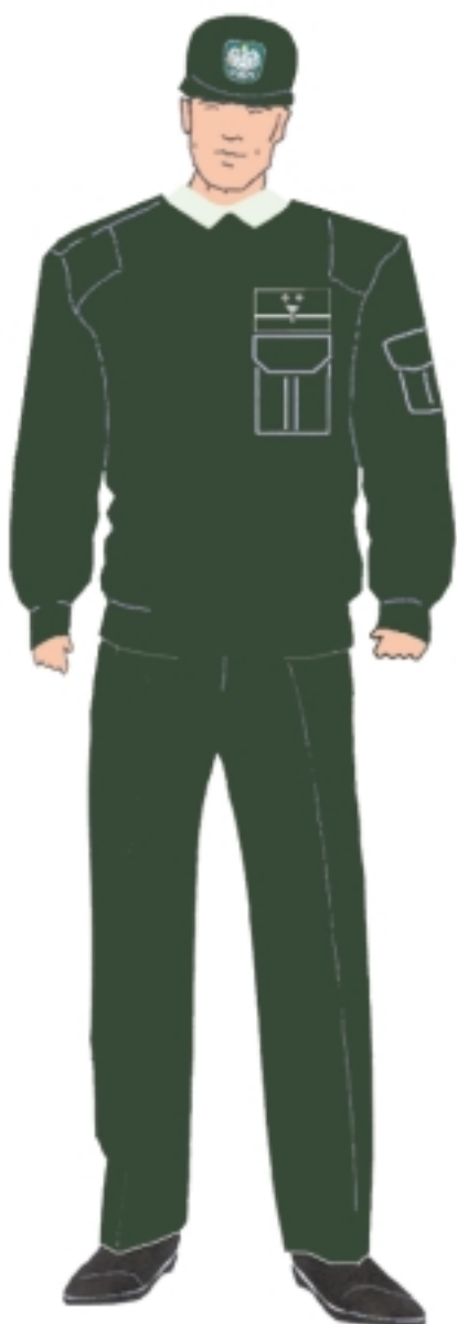
Ubiór inspektora w swetrze