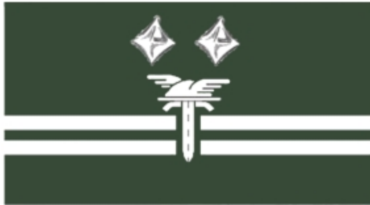
Wojewódzki Inspektor Transportu Drogowego