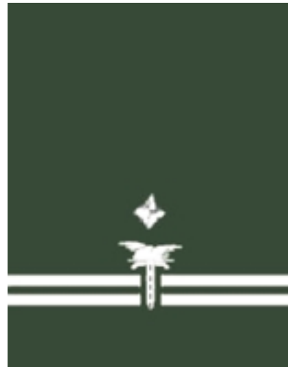
Zastępca Wojewódzkiego Inspektora Transportu Drogowego