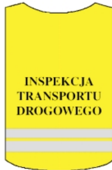
Wzór kamizelki ostrzegawczej