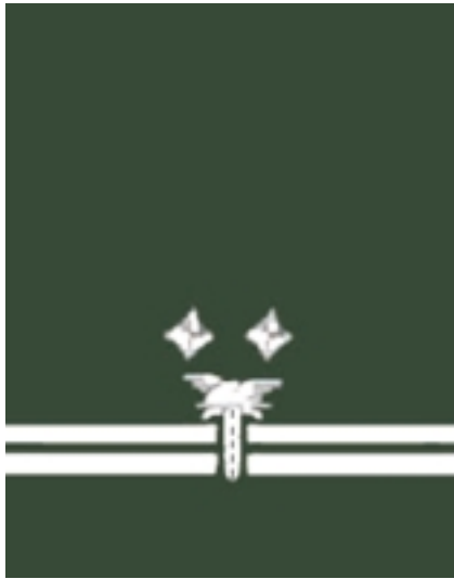
Wojewódzki Inspektor Transportu Drogowego