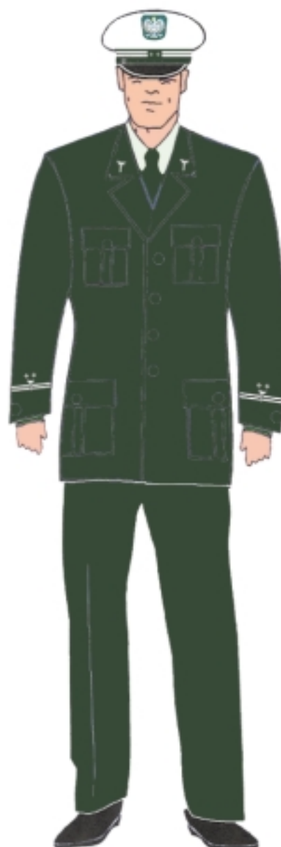
Ubiór inspektora w marynarce gabardynowej