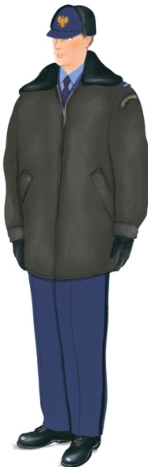
Ubiór służbowy z kurtką 3/4