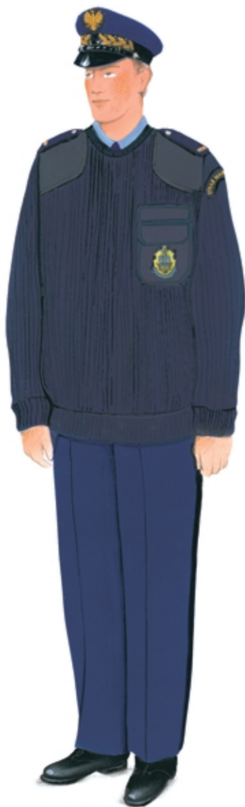
Ubiór służbowy ze swetrem