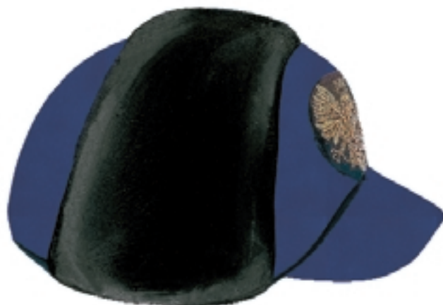
Czapka zimowa typu sportowego