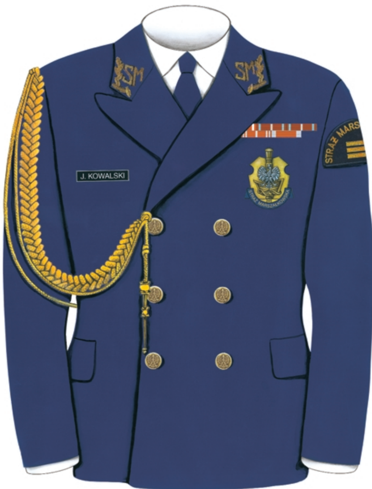
na kurtce ubioru galowo-wyjściowego