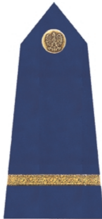
Młodszy strażnik Młodszy ratownik