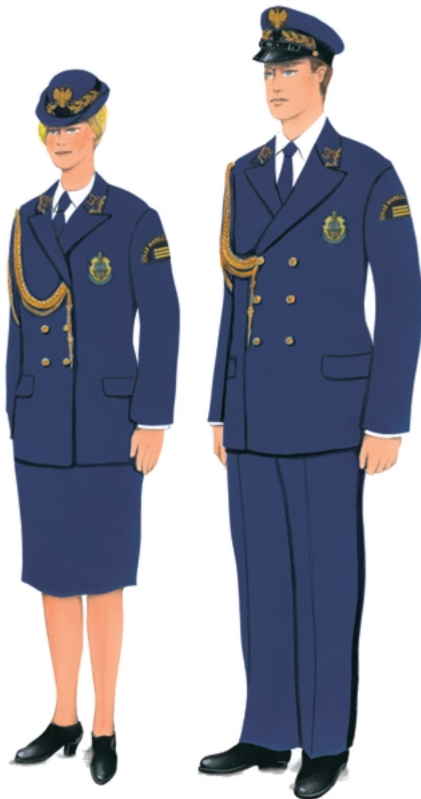
Ubiory galowo-wyjściowe ze sznurem galowym