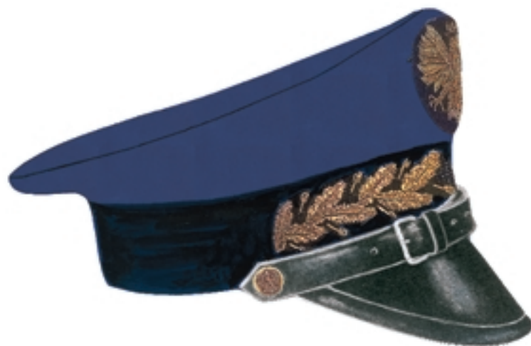
Wzór haftu na otoku czapki