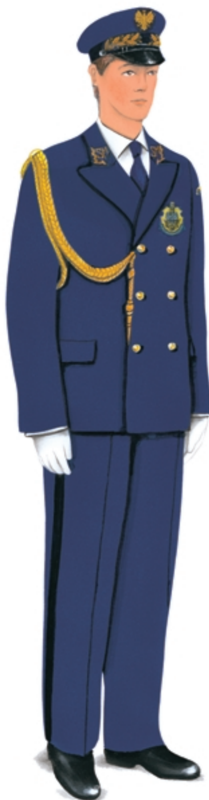
Ubiór galowo-wyjściowy z białymi rękawiczkami