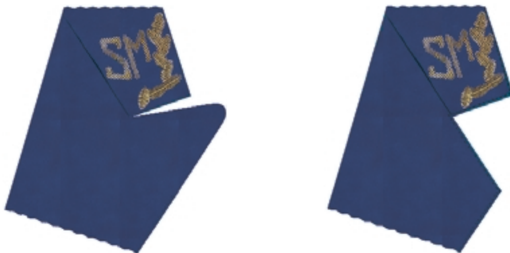
na kołnierzu kurtek mundurowych