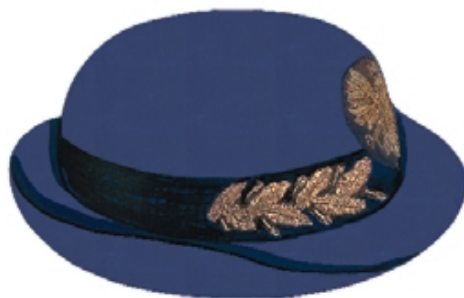
Kapelusz damski strażnika