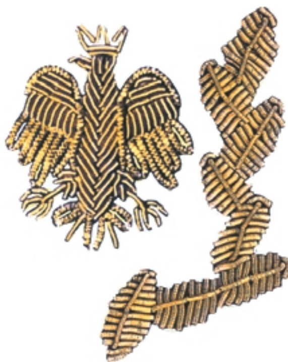
Oznaka Komendanta i zastępcy Komendanta na kołnierzu kurtki