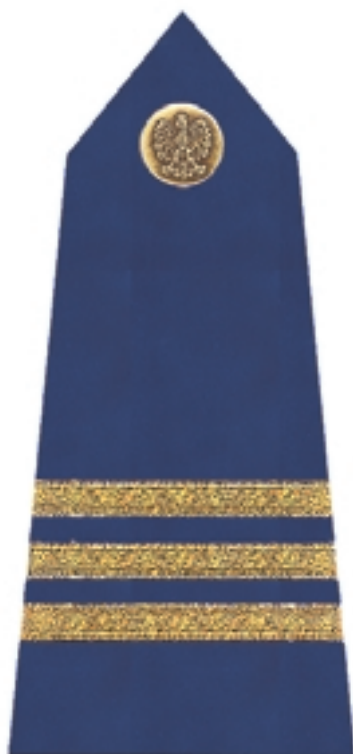
Starszy strażnik Starszy ratownik