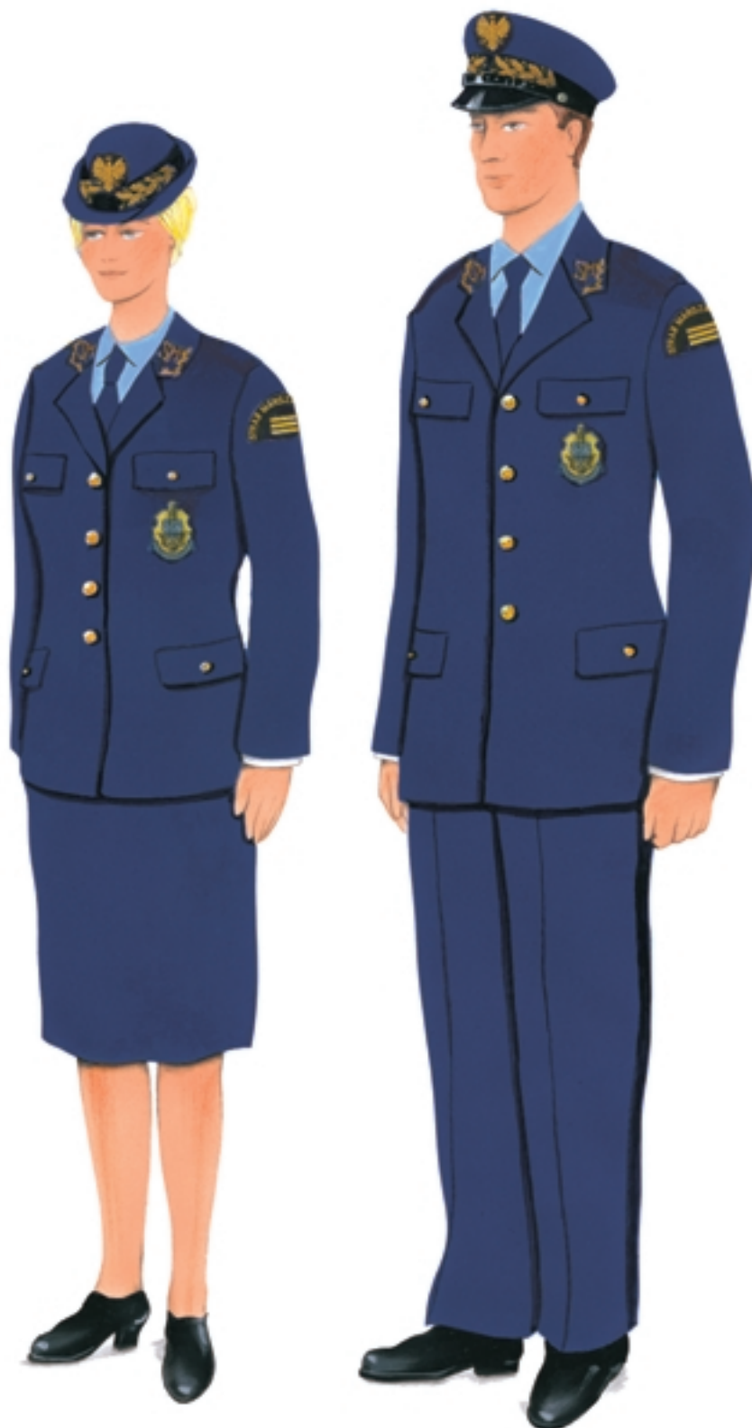
Ubiory służbowe z kurtką służbową