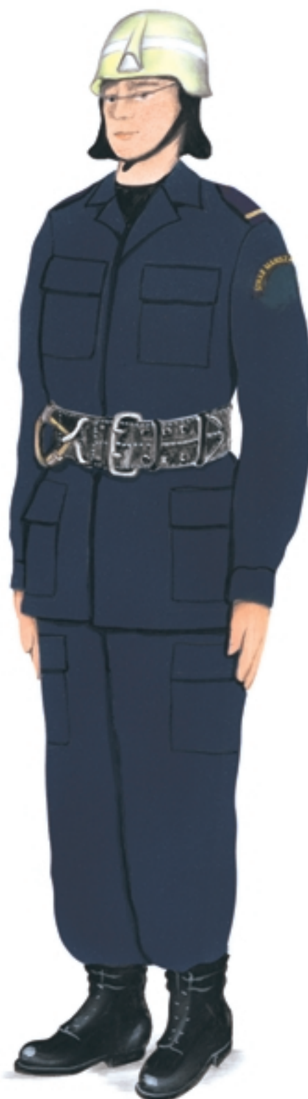
Ubiór specjalny ratownika