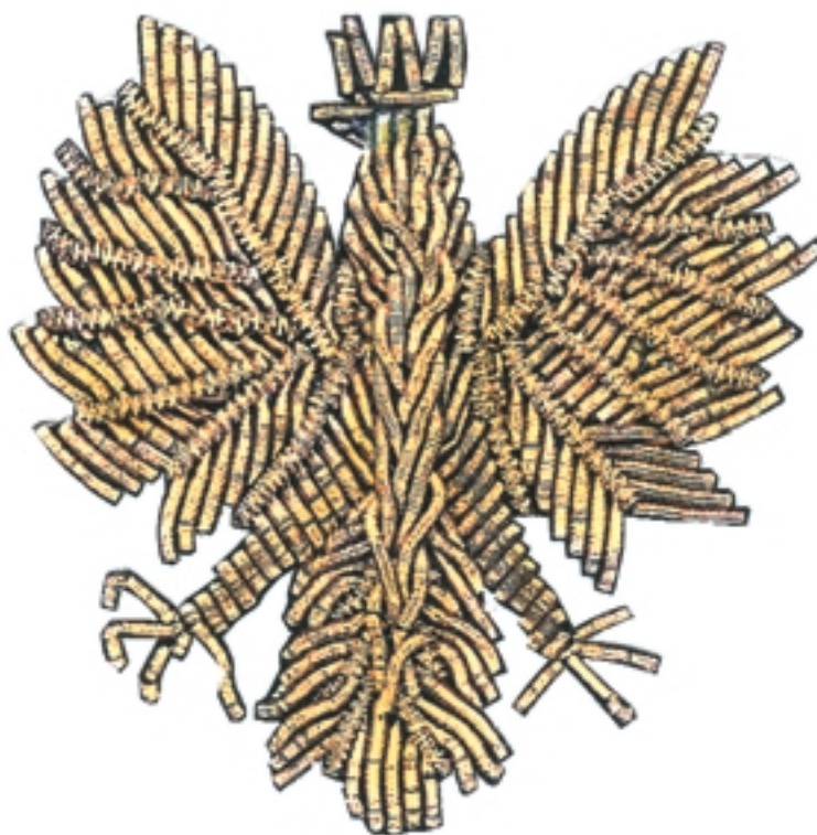
Wizerunek orła na nakryciach głowy