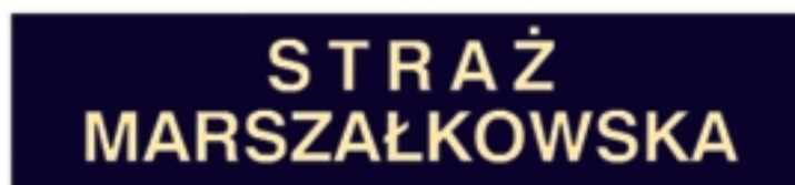
Oznaka „Straż Marszałkowska” do ubioru specjalnego