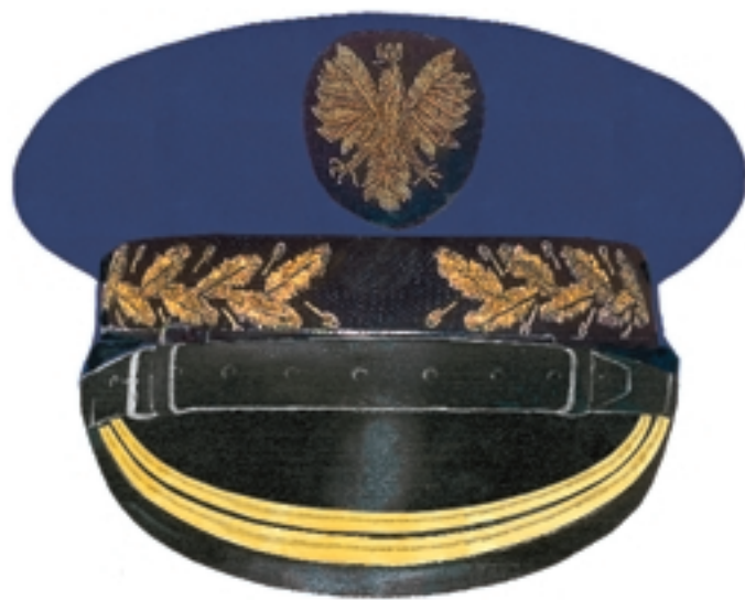
Czapka okrągła dowódcy zmiany i dowódcy sekcji