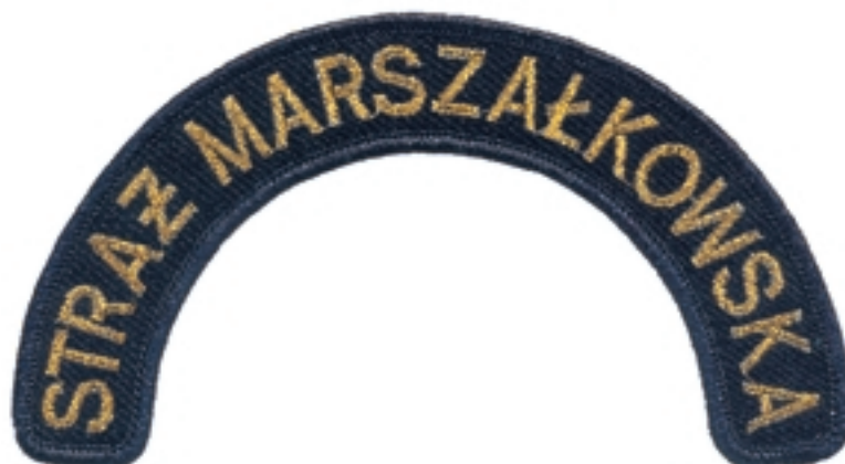
Oznaka „Straż Marszałkowska” do kurtki służbowej i galowo-wyjściowej