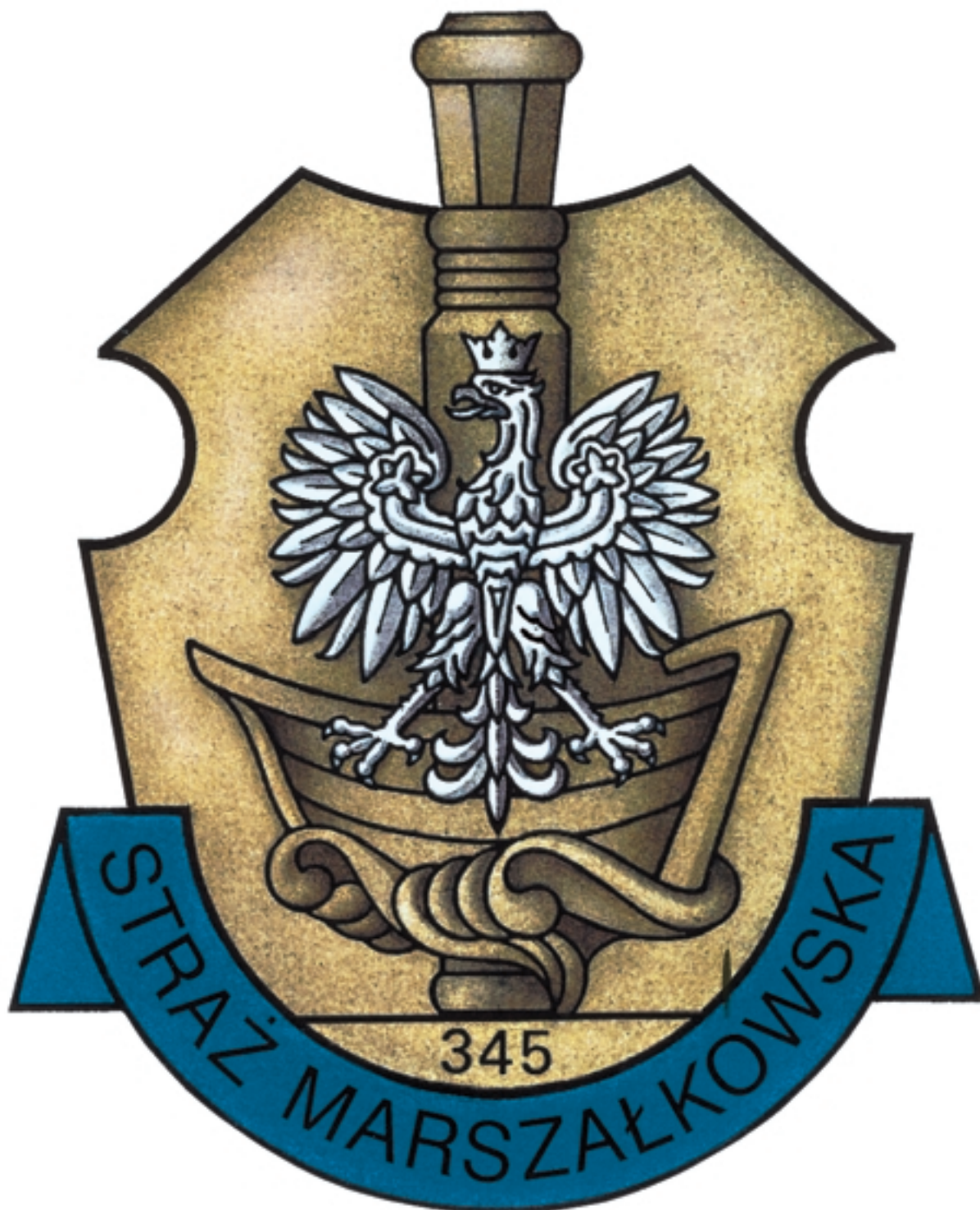
Odznaka identyfikacji indywidualnej