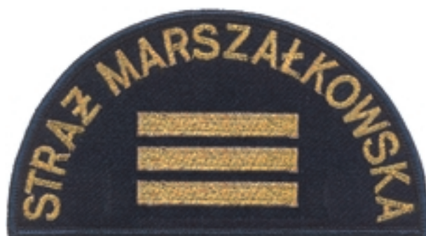
Starszy strażnik Starszy ratownik