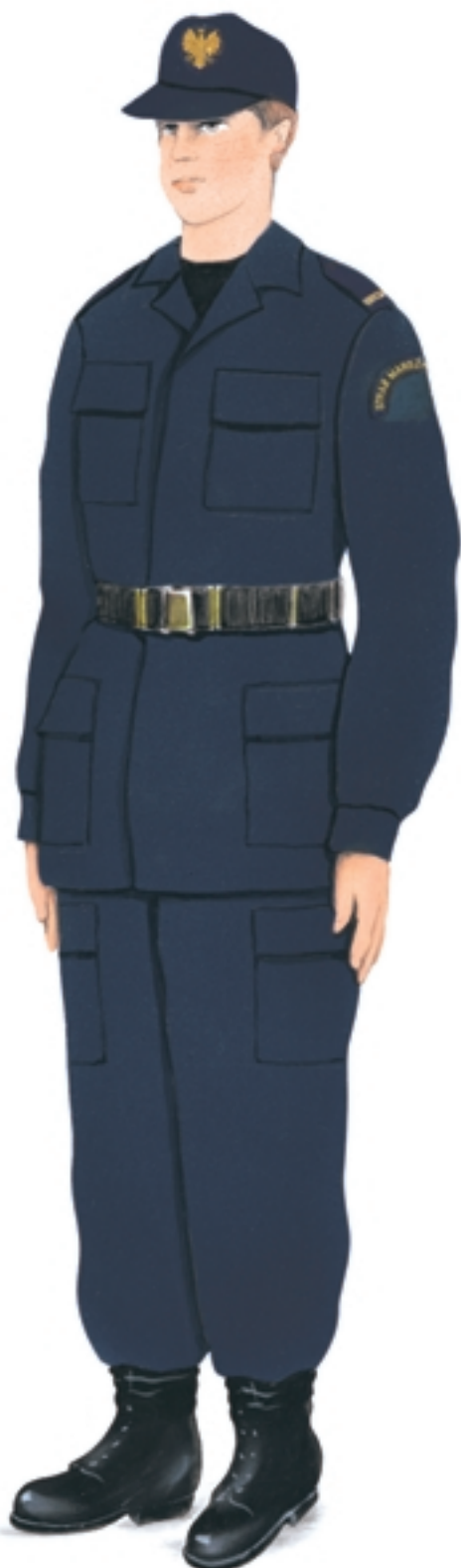
Ubiór specjalny strażnika