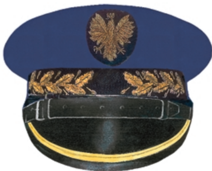
Czapka okrągła Komendanta i zastępcy Komendanta