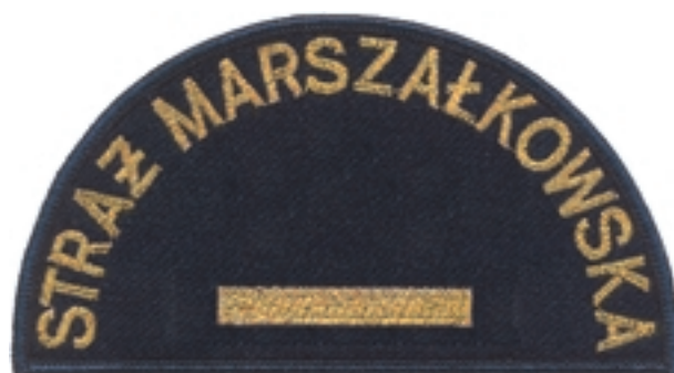
Młodszy strażnik Młodszy ratownik