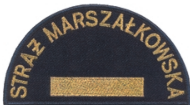
Dowódca zmiany Dowódca sekcji