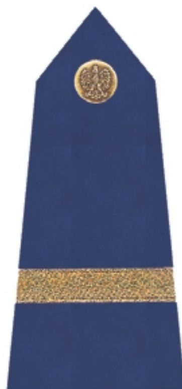
Dowódca zmiany Dowódca sekcji