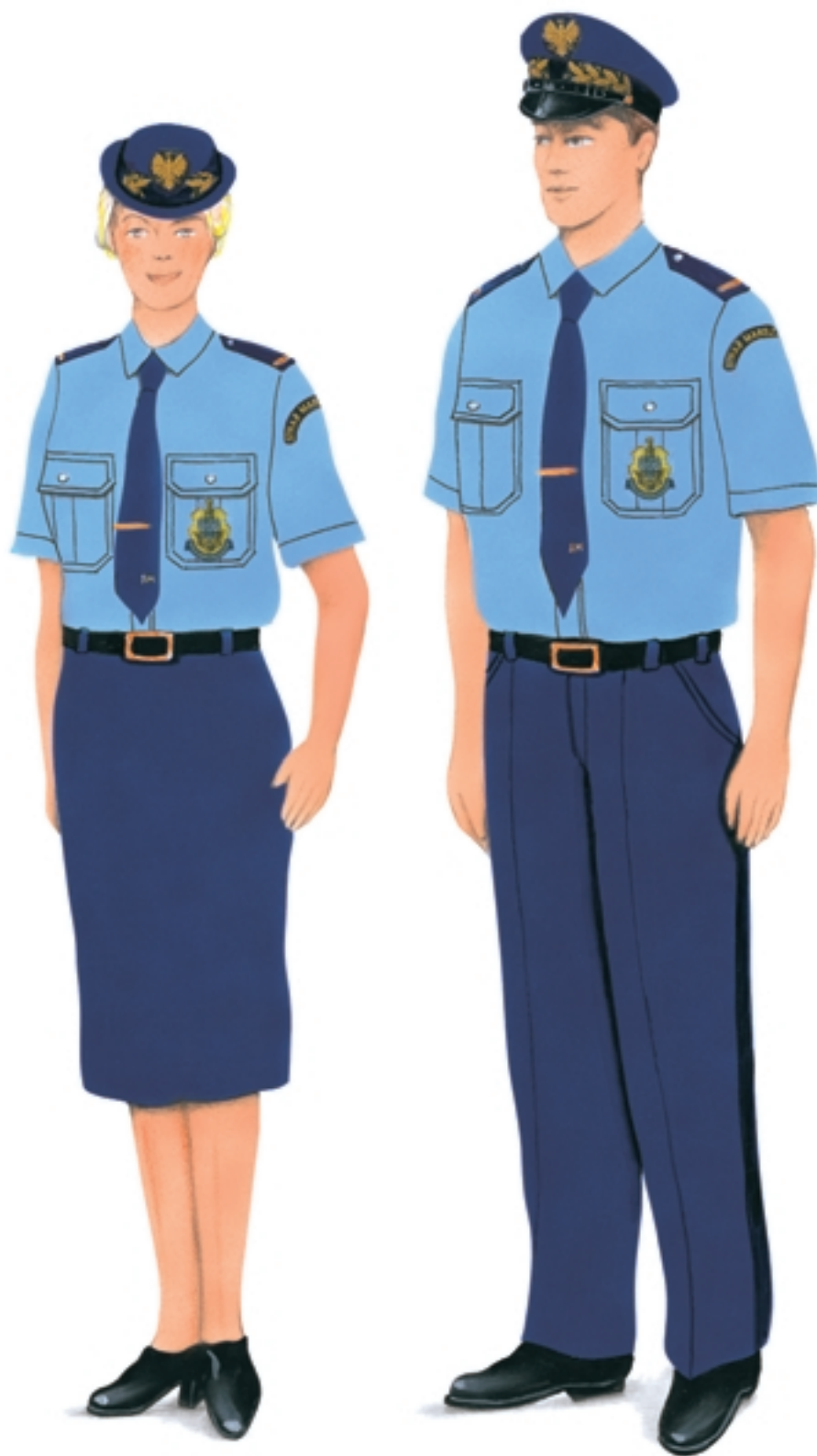
Ubiory służbowe z koszulą z krótkimi rękawami