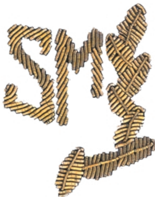
Oznaka strażnika na kołnierzu kurtki