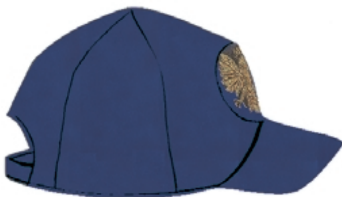
Czapka letnia typu sportowego