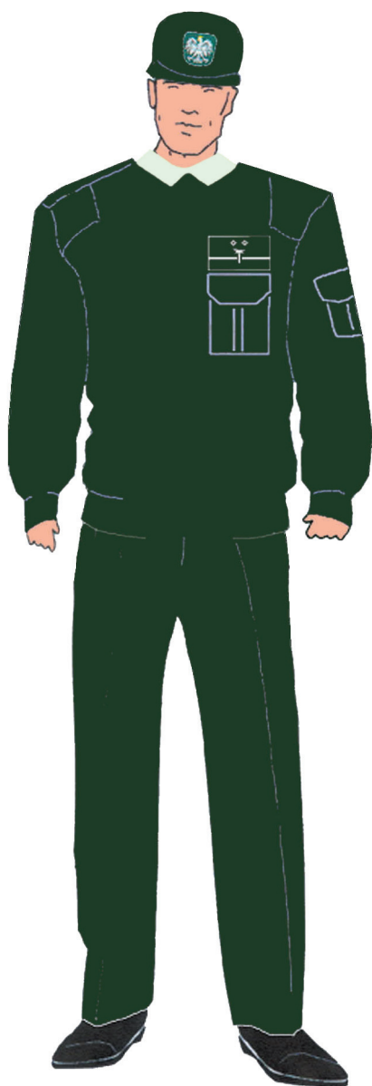
Ubiór inspektora w swetrze służbowym