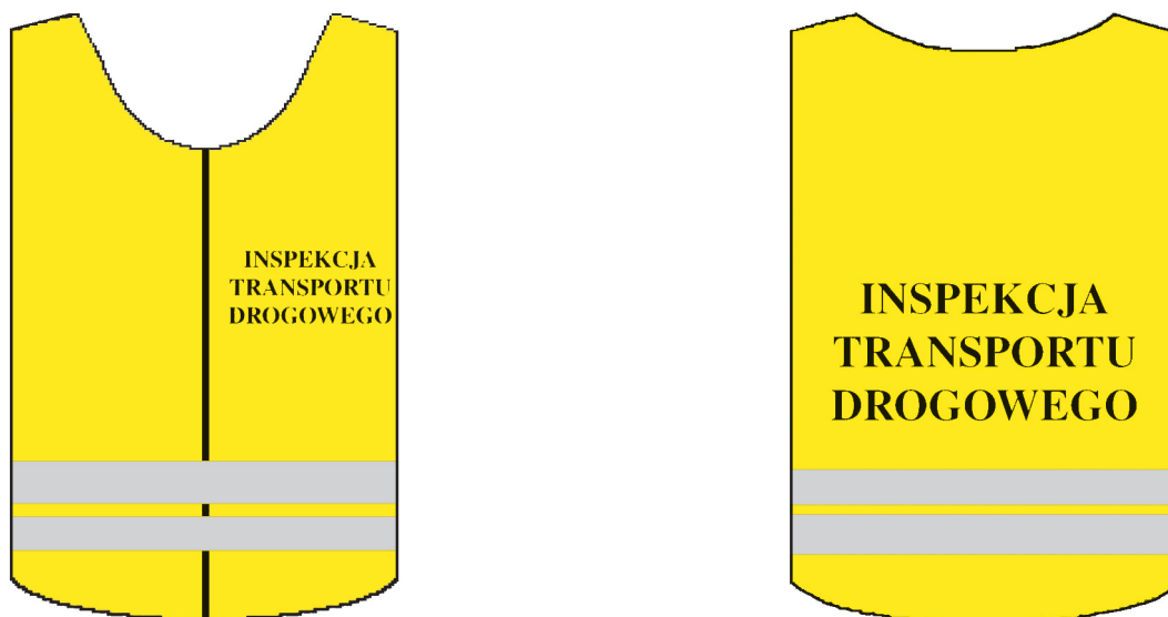
Wzór kamizelki ostrzegawczej