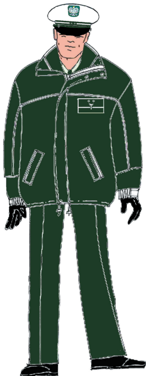
Ubiór inspektora w kurtce \frac{3}{4} ocieplanej uniwersalnej