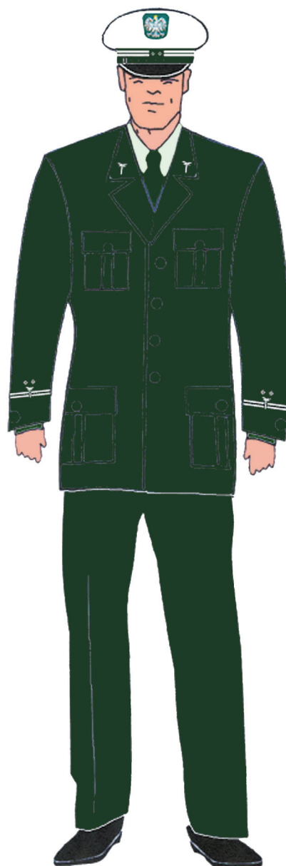
Ubiór inspektora w marynarce gabardynowej