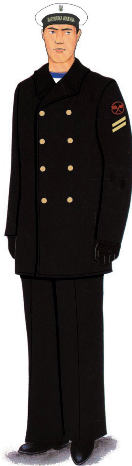
Rys. 54. Ubiór wyjściowy słuchacza szkoły podoficerskiej Marynarki Wojennej z półplaszczem marynarskim i czapką garnizonową