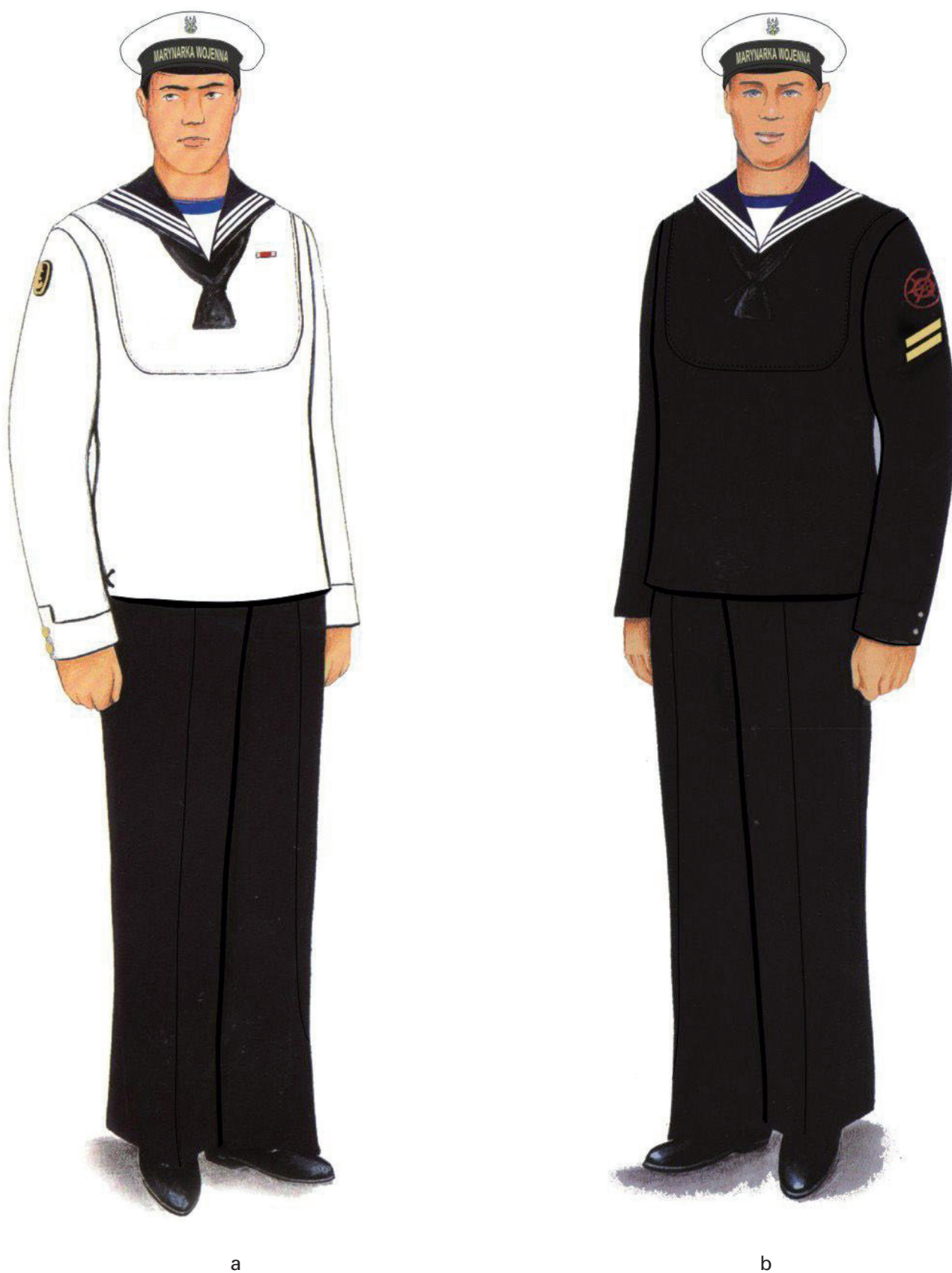
Rys. 53. a) Ubiór wyjściowy słuchacza szkoły podoficerskiej Marynarki Wojennej z bluzą letnią i czapką garnizonową