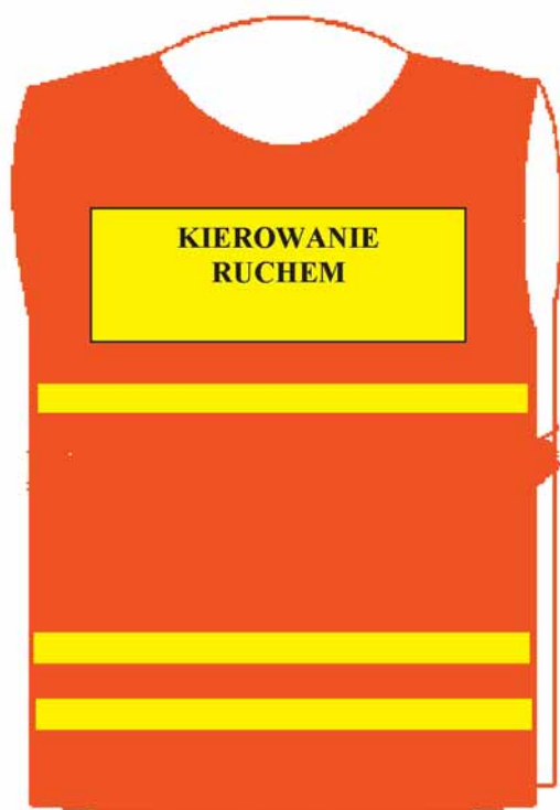
Narzutka — przód