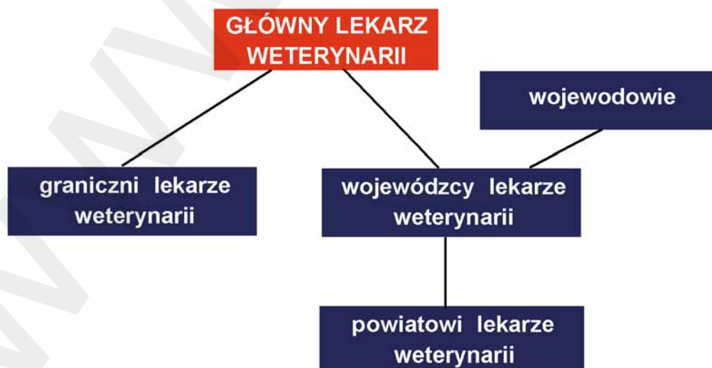
Rys. 1. Schemat organizacji Inspekcji Weterynaryjnej w Rzeczypospolitej Polskiej